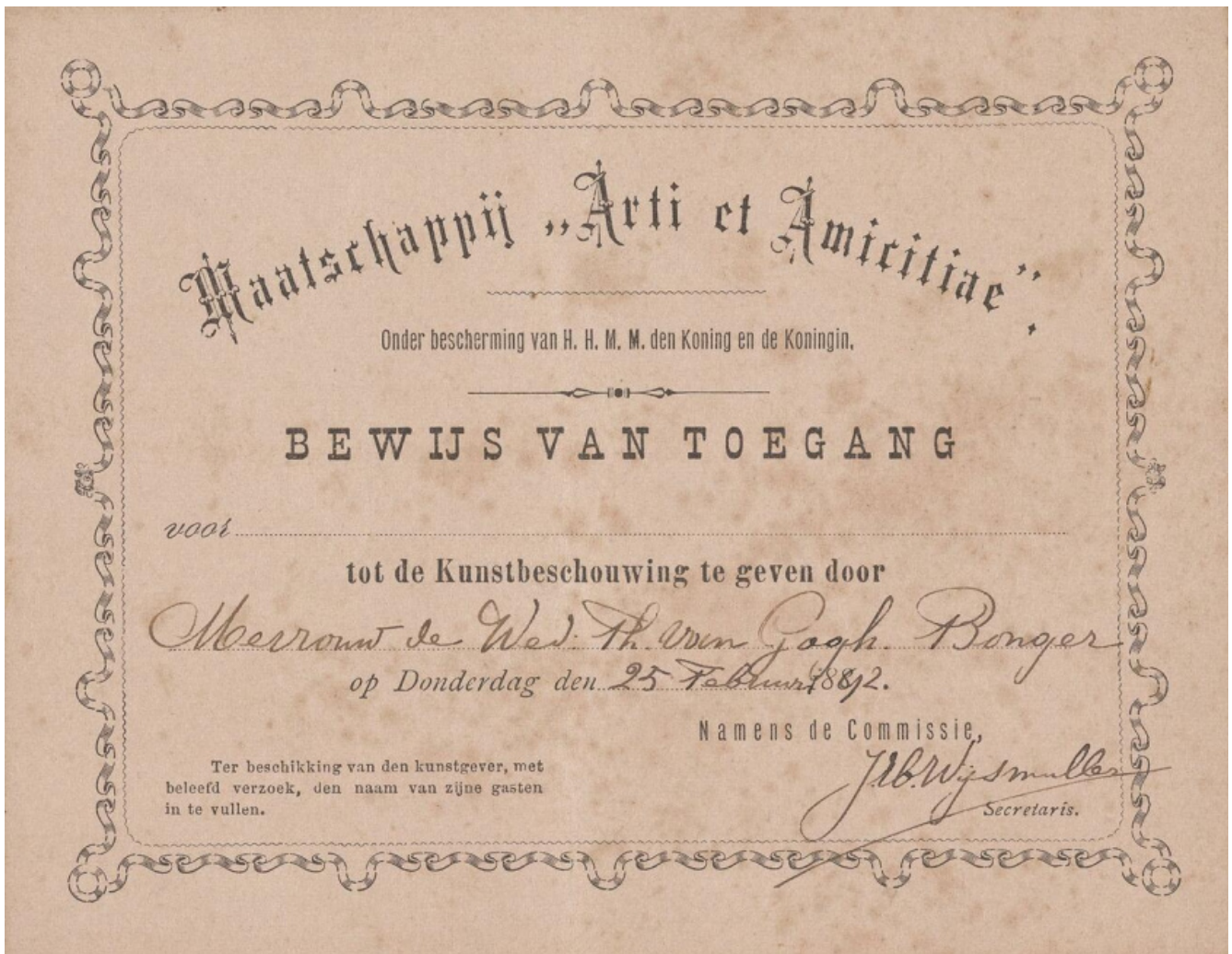
Invito di Jo van Gogh-Bonger, Arti et Amicitiae, 1892