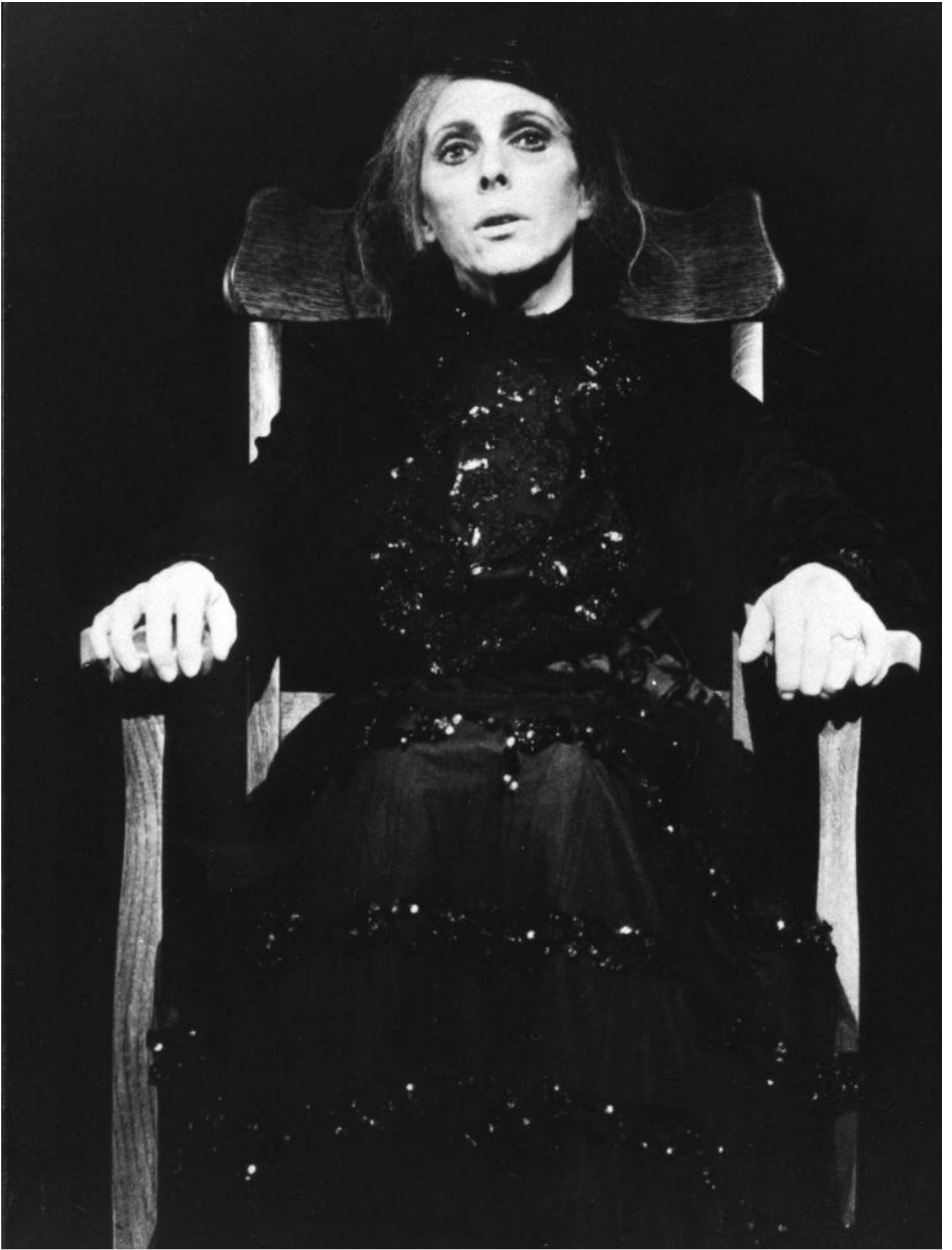
Rockaby (1981) con Billy Whitelaw, regia di Alan Schneider.