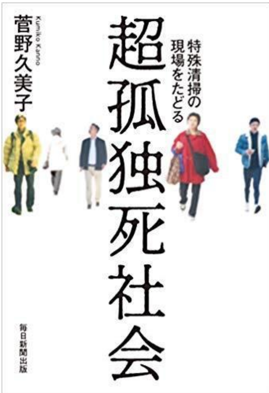
Copertina di Ch? kodoku-shi shakai di Kumiko Kanno.

Kanno è entrata in molti luoghi di kodoku-shi al seguito di alcuni addetti di tokus? e descrive minuziosamente in prima persona tutto ciò che gli operatori di tokus? vedono, sentono e fanno. In ogni casa dove è avvenuta una morte solitaria, il primo elemento che colpisce gli operatori sono gli odori. Ti assalgono appena si apre la porta d'ingresso, è un'autentica aggressione ai sensi. Penetrano persino sotto la maschera antigas professionale che gli operatori indossano, appiccicandosi all'interno delle narici, alla pelle e ai capelli, oltre che sulla tuta da lavoro che li protegge.