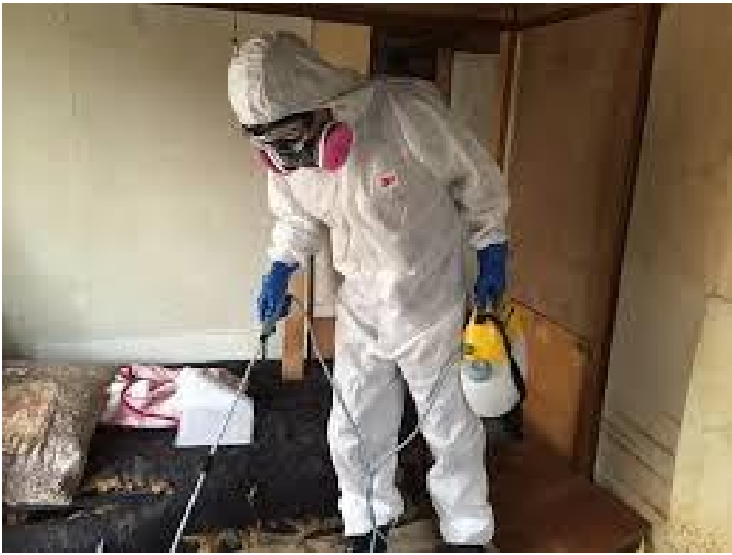
Un operatore di tokus? al lavoro.