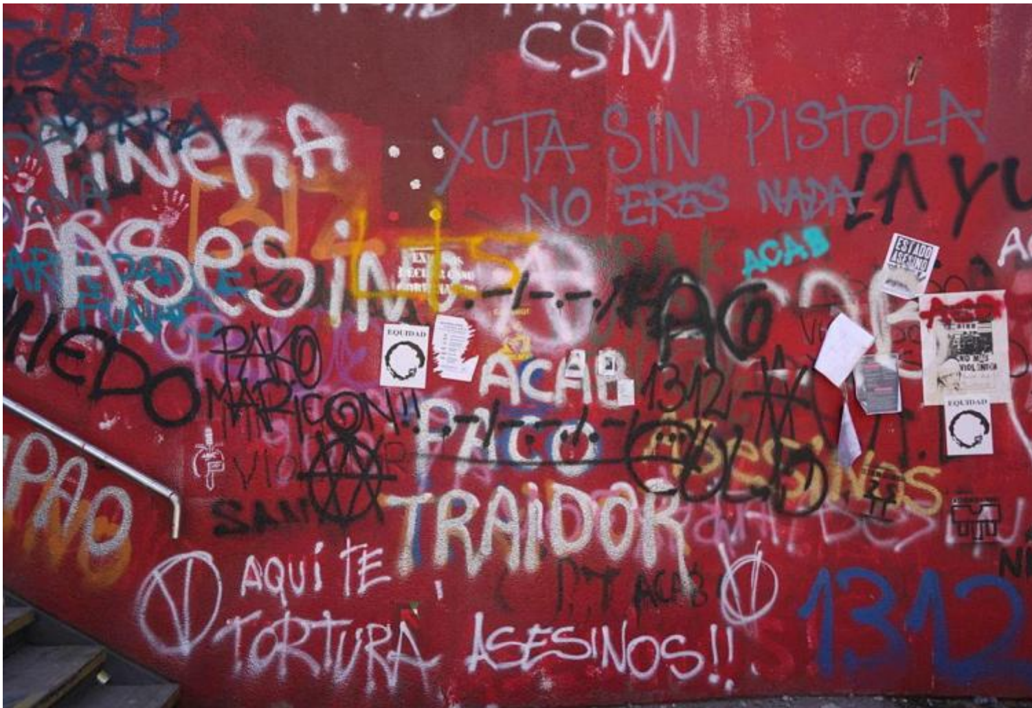
@Javier Godoy Fajardo