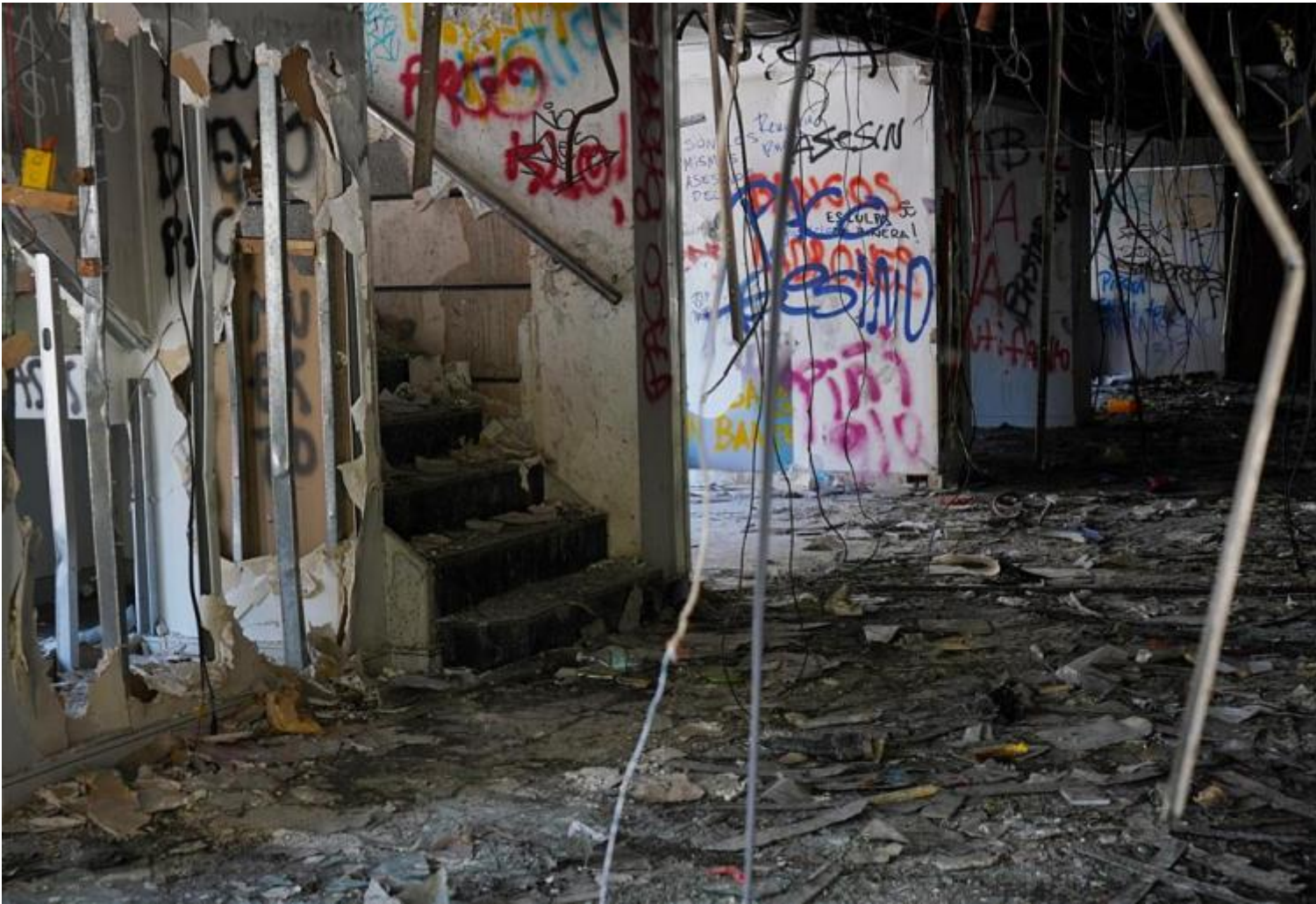
Banco Santander, distrutto