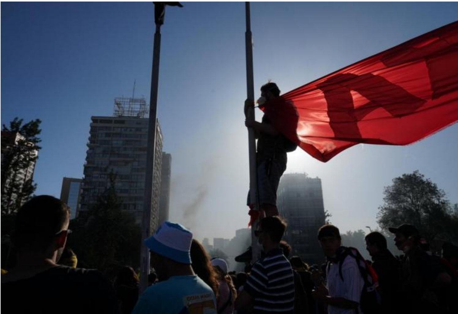
Alameda, @Javier Godoy Fajardo