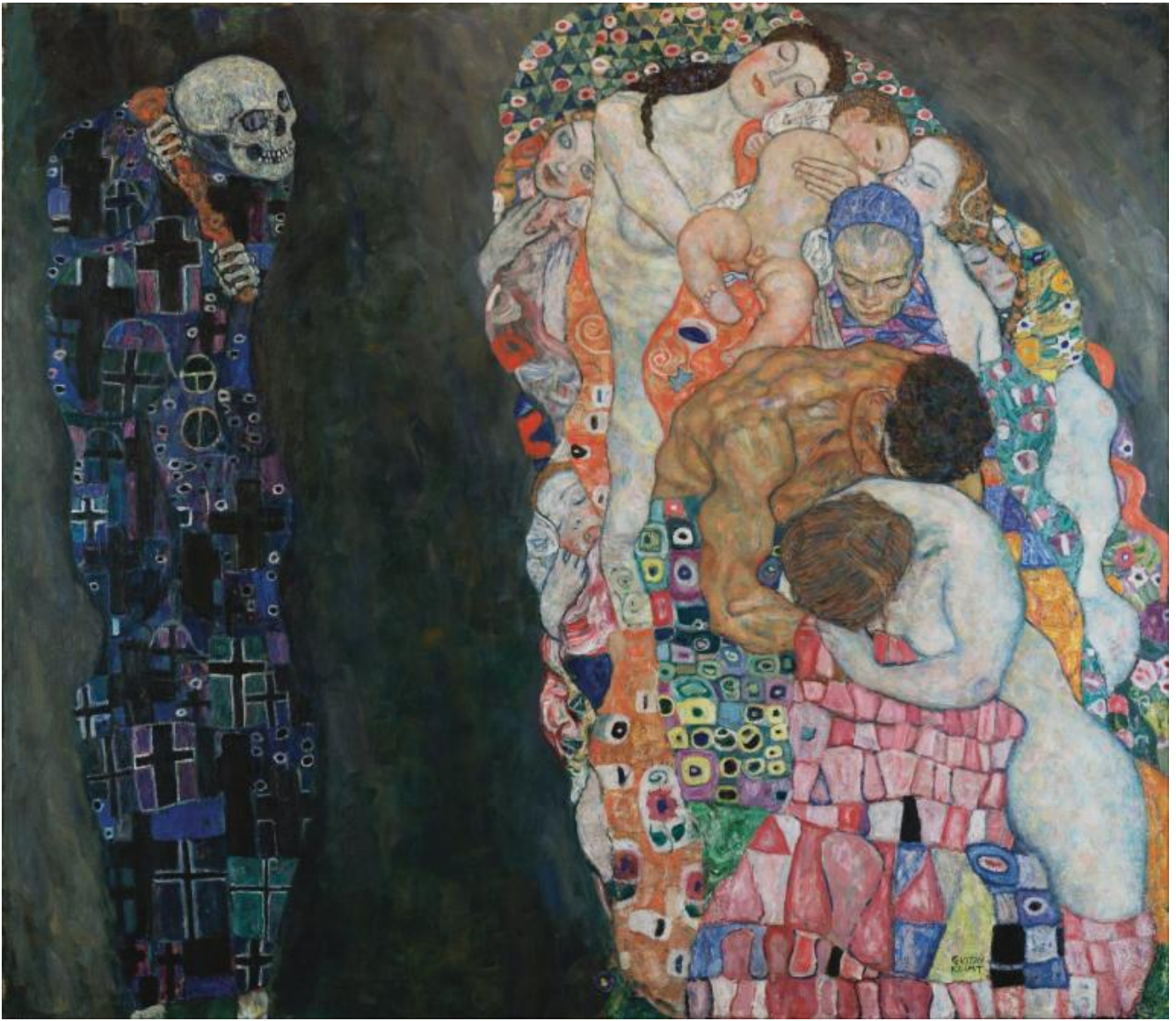
Gustav Klimt, Morte e vita.

Questa seconda possibilità, la morte intesa come attraversamento di una soglia misteriosa che non porta all'annichilimento del vivente, è stata, e probabilmente è ancora oggi, la più diffusa in tutto il corso della storia umana. Ed esprime chiaramente quanto sia inaccettabile l'idea della fine assoluta per quanto si ritenga la morte un evento del tutto naturale. È un atteggiamento piuttosto contraddittorio, che merita attenzione perché il desiderio d'immortalità che abita il cuore dell'uomo non può essere liquidato come espressione di puro egoismo o di paura. Non soltanto, almeno. Dunque, perché abbiamo così tanta paura di morire e non riusciamo proprio a farcene una ragione? Non basta dire che è perché siamo materia aggregata e, siccome la morte è disgregazione della materia, ogni nostra singola cellula per istinto biologico vi si ribella. Se è vero che morte e vita appartengono in ugual modo alla stessa realtà, il contrario della vita