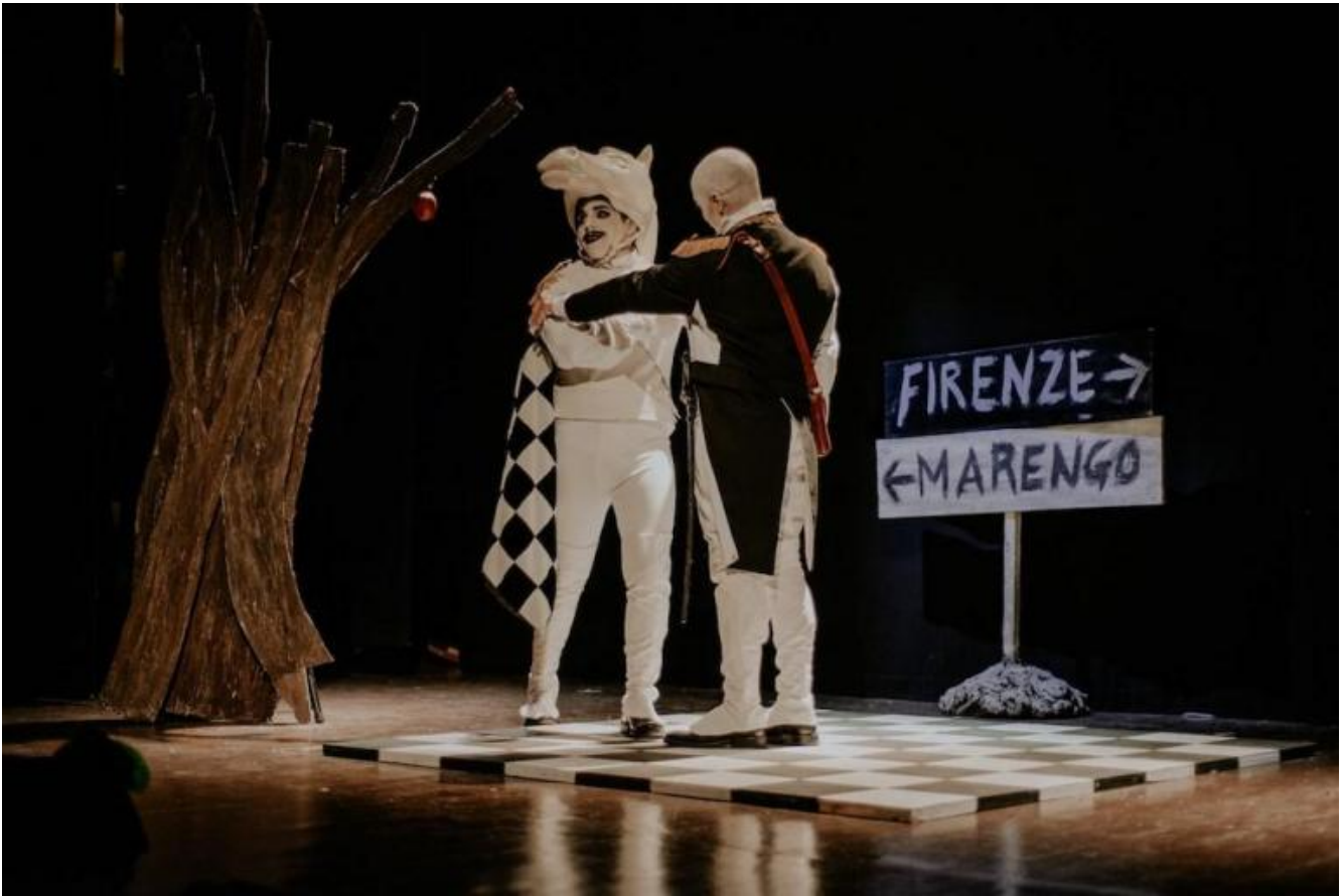
La macchia d'inchiostro