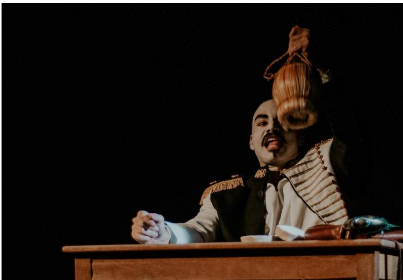
La macchia d'inchiostro, ph. Carolina Negrone.

colorato, di Peter Filippetti, poteva essere più debordante, invasiva, dominante. Il protagonista, per lo più incisivo, non sempre è accompagnato dal resto della compagnia.