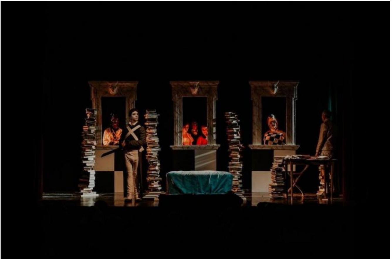
La macchia d'inchiostro, ph. Carolina Negrone.

Nella Macchina da guerra entrano molte voci - di attori e di commentatori - è un molti; intrinsecamente analogo al molti chiamati dall'Enciclopedia. Intervengono molte voci: ma, soprattutto importante, è l'umiltà (la tranquilla sicurezza di sé) del collaboratore più remoto, rimasto solo nella più lontana provincia. Nell'Enzo re ho avuto modo di vedere Roversi ricorrere a un vocabolario spogliato e ridotto a pochissimi termini. C'è una gioia intima nel vederlo lavorare a semplificare il testo, a renderlo morbido, e poco. Tutto sta nella congiunzione di due o tre parole, di due o tre frammenti contrapposti. Se si ascolta, con attenzione, si sentono le risonanze propagarsi a grande distanza, e tornare piene di forza; come grandi onde, e piccole barchette di uomini. Poco. Due o tre tocchi.