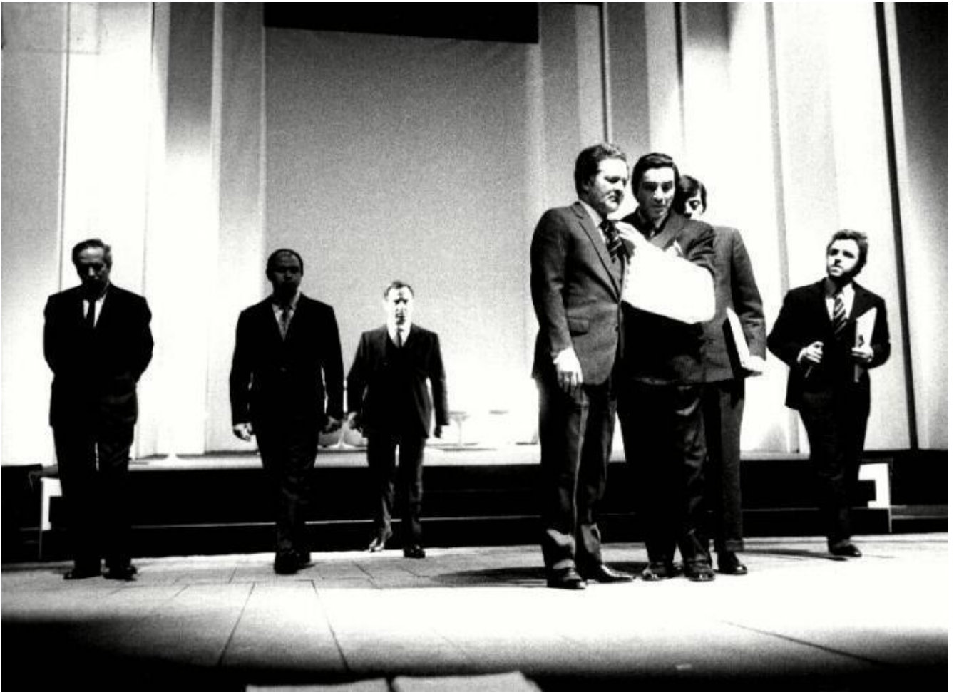
Il crack, ph. Luigi Ciminaghi, Archivio Piccolo Teatro Milano.

Il teatro, dunque. Il sentimento che segue la rappresentazione dei primi due testi è di delusione, perché è accusato di essere poco drammatico e molto retorico o melodrammatico, in critiche che sovrapponevano spesso gli esiti della regia ai testi ( Il crack era stato accompagnato da musiche verdiane, in special modo di Aida , e in slittamenti in tempi storici antichi). Quei due lavori prendevano di petto i temi dell'epoca come il ritorno del nazismo, con una rinascita di Hitler pronto a stipulare patti col grande capitale in Unterdenlinden , pièce ispirata all' Arturo Ui di Brecht, un dramma che alla lettura oggi sembra datato, ma dopo un uso e abuso del tema nei più di cinquant'anni trascorsi. Ulteriore demistificazione è Il crack , che risente forse di suggestioni pasoliniane coeve ( Porcile , Teorema ). È la storia di un fallimento per concorrenza e per decisioni delle banche di un industriale che "rovina il mercato" con prezzi troppo bassi. Il testo appare radicato nella corsa al profitto e allo sfruttamento degli anni del boom e immediatamente seguenti, visti da una doppia prospettiva: la prima è quella dei padroni e delle occulte forze che