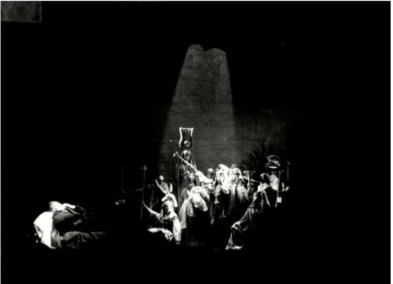
Il crack, parte terza, nella prigione, ph. Luigi Ciminaghi, Archivio Piccolo Teatro Milano.

dominano loro stessi, le banche, che in scena si moltiplicano in personaggi definiti Paladini e vacue Teste d'uovo del sistema; la seconda emerge come quella dei giovani contestatori che il padre (l'industriale ormai fallito) incontra, platonicamente, nella caverna-carcere dove finisce imprigionato per non essere stato alle regole. I giovani evocano i temi delle ribellioni del Sessantotto, la discussione sulle rivolte internazionali, quelle sull'uso della violenza, sulle merci e il consumo eccetera. Lo stesso Roversi lo definisce un testo "marcusiano".