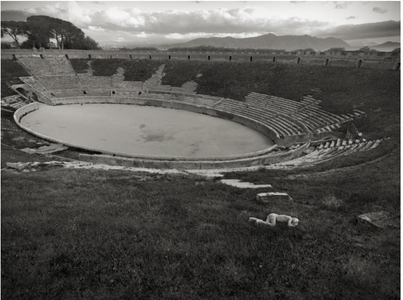
Kenro Izu Pompei, Anfiteatro, 2016 Stampa inkjet 61x76 cm © Kenro Izu Courtesy Fondazione di Modena - Fondazione Modena Arti Visive.

In questi suoi pellegrinaggi, la fotografia diventa un atto di riflessione, di osservazione paziente e lenta, dove a poco a poco gli uomini diventano parte integrante del paesaggio, corpi della natura. Kenro Izu pur appartenendo al tempo contemporaneo, passa attraverso questi luoghi sacri ricavandone una visione che rimane fedele ai luoghi stessi. Nelle immagini, appare un ritratto in cui l'anima rimane inalterata, qualsiasi sia la forma che il fotografo disegna attraverso la luce.