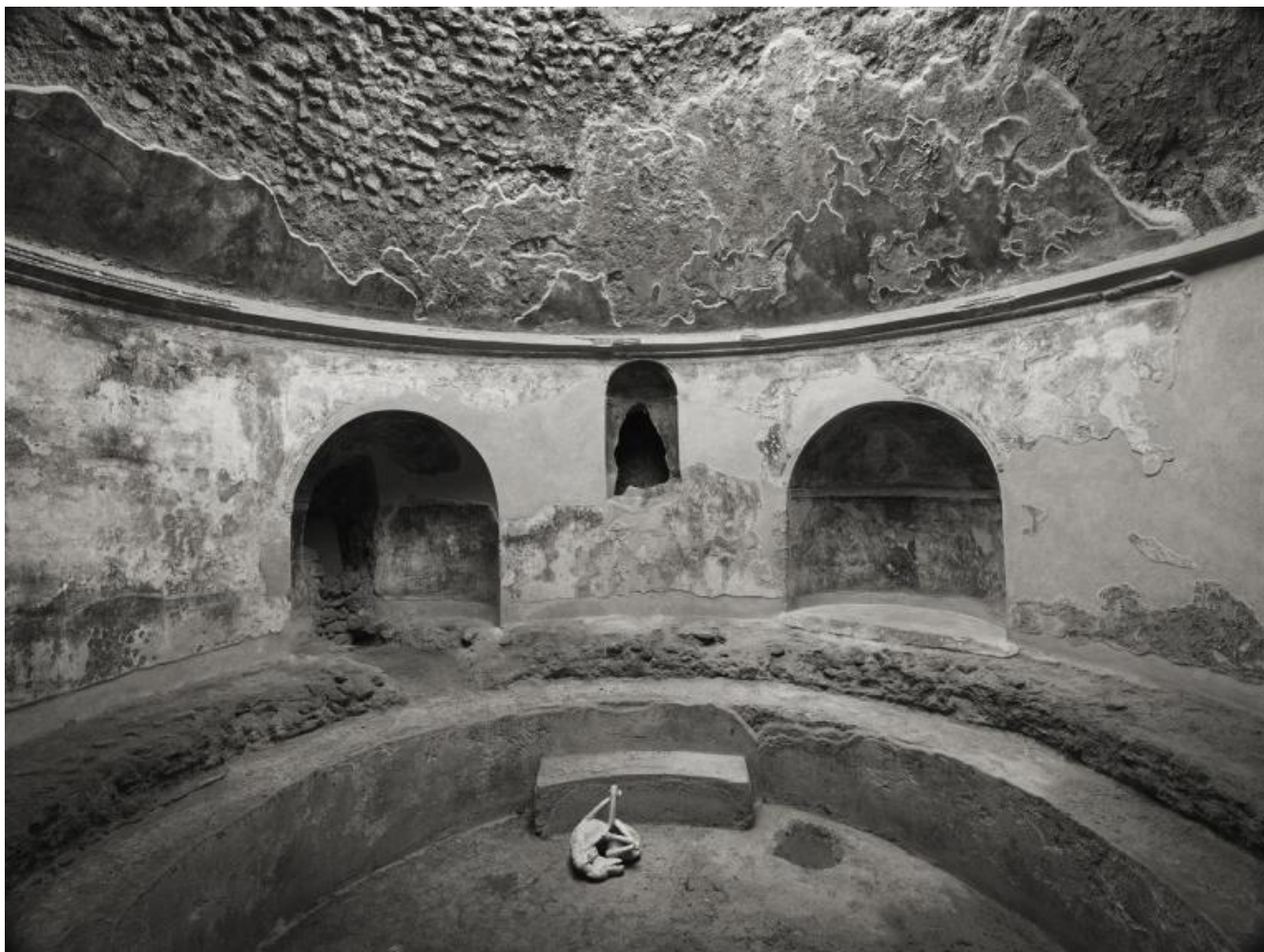
Kenro Izu Pompei, Terme Stabiane, 2016 Stampa al platino 42,5x55 cm

Al contempo la sua è una fotografia che rivela come la complessa bellezza della vita possa tramutarsi in decadimento e di come questo non smetta comunque di essere “bello”. Un approccio che emerge anche nell’atto del guardare affidato al fruitore, il quale soltanto attraverso una altrettanto lunga e paziente osservazione delle immagini può comprendere la totalità empatica che ha guidato la mano dell’autore, molto lontana dalla rapidità con cui tanta fotografia digitale contemporanea, fatta per essere consumata, si è affermata in tempi recenti.