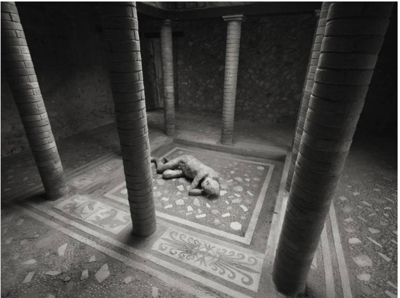
Kenro Izu Pompei, Casa del Menandro, 2016 Stampa inkjet 61x76 cm © Kenro Izu Courtesy Fondazione di Modena - Fondazione Modena Arti Visive.

Nel film come nelle immagini di Izu, l'incontro con l'improvvisa concretezza della morte altera il percorso della ragione, confuso dall'instabilità del sentimento. Ciò apre la percezione dell'uomo ad una dimensione diversa, in cui il sacro torna a far parte della materia riconducendo il corpo privo di vita all'unione indissolubile con il proprio spirito.