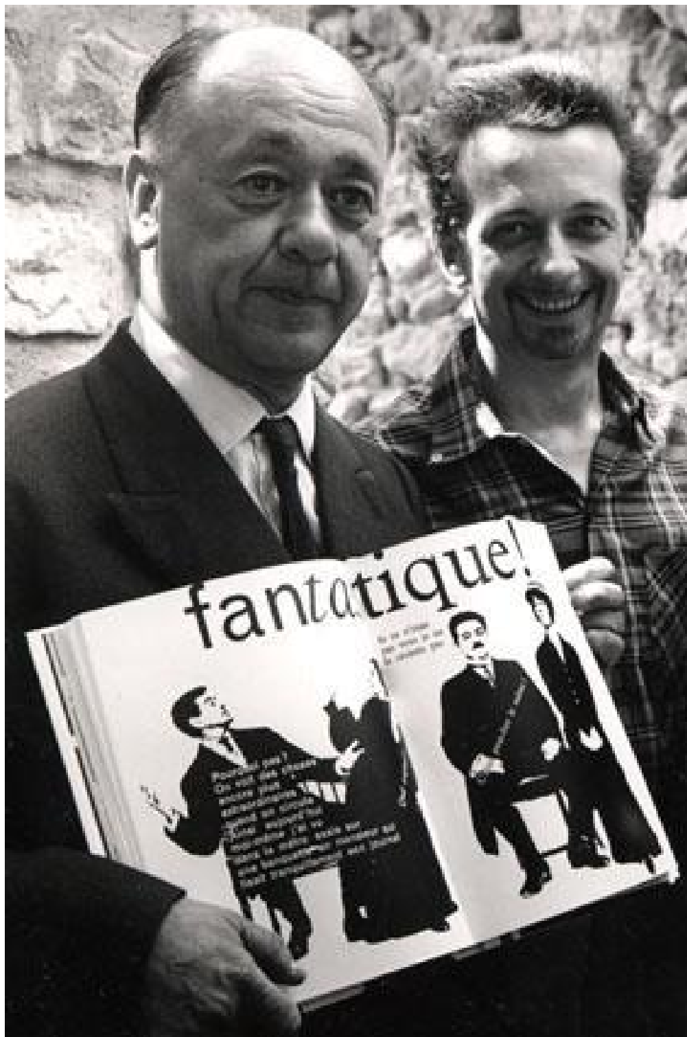
Eugène Ionesco e Massin, in occasione dell'uscita della Cantatrice chauve, 1964.

Eugène Ionesco, La Cantatrice chauve, suivi d'une scène inédite. Interprétation typographique de Massin et photographique d'Henri Cohen d'après la mise en scène de Nicolas Bataille, Paris, Gallimard, 1964 (alcune delle pagine interne, in sequenza).