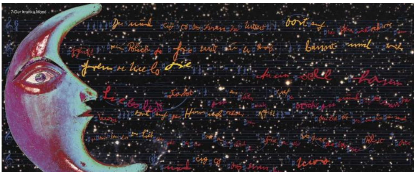
Arnold Schönberg, Pierrot Lunaire op. 21, d'après le poème d'Albert Giraud, traduction allemande d'Otto Erich Hartleben, essai de transcription typographique de la partition vocale par Massin, Paris, Typographies Expressives.