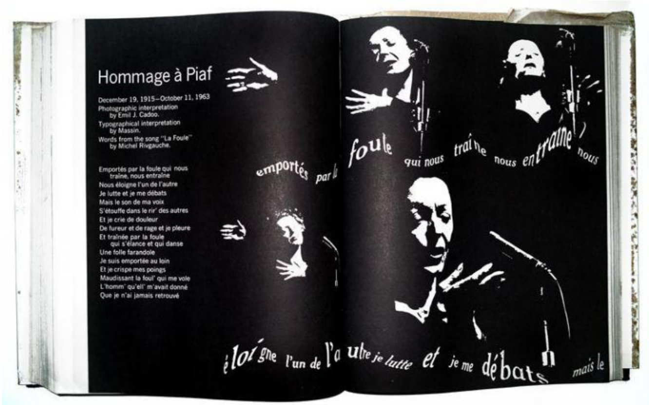
"Hommage à Piaf. December 19, 1915 – October 11, 1963 [La Foule]", interpretazione fotografica di Emil J. Cadoo, interpretazione tipografica di Massin, Evergreen Review, 38, 1965.