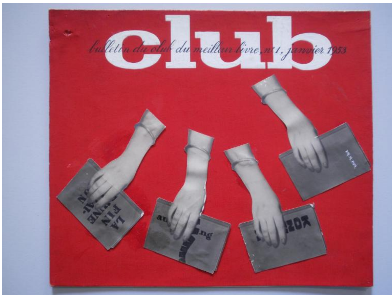
Bollettino del Club du Meilleur Livre, 1953.

Che fossero trovate tipografiche o veri e propri libri-oggetto, i libri del Club andavano letteralmente a ruba tra gli abbonati, che spesso si disputavano le copie delle edizioni più prestigiose (tutte rigorosamente numerate).