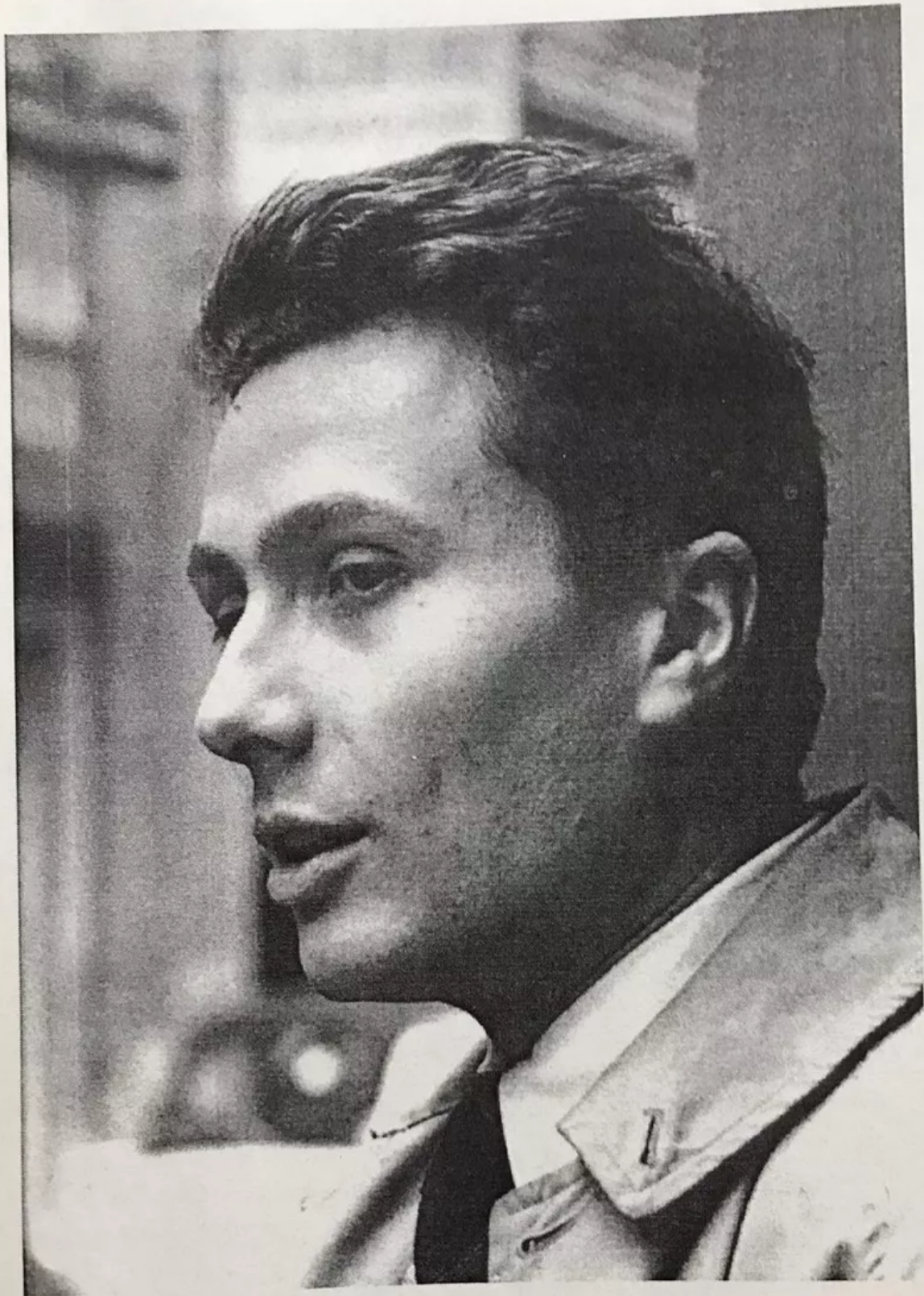
Alberto Arbasino, anni '60.