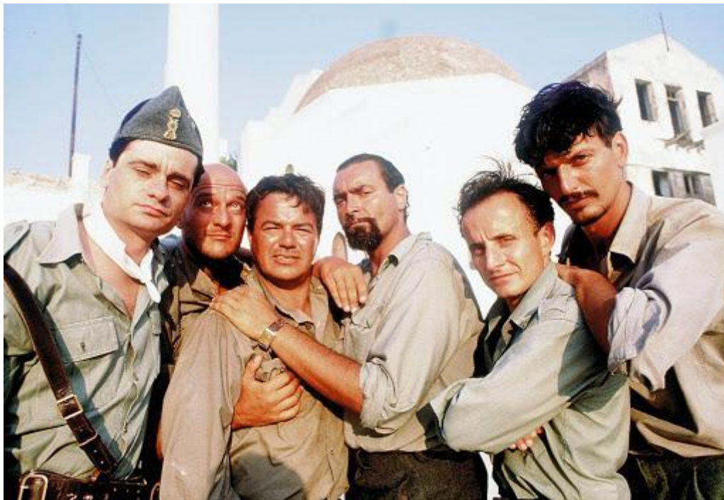
Mediterraneo di Gabriele Salvatores (1991).

del Nord e in Africa orientale, in Spagna, in Albania, in Francia, in Jugoslavia, in Grecia, in Unione Sovietica, e ovunque la guerra fascista fosse arrivata a massacrare le resistenze locali e le popolazioni civili, accusate aprioristicamente – come se fosse una colpa, oltretutto – di affiancare il partigianato locale.