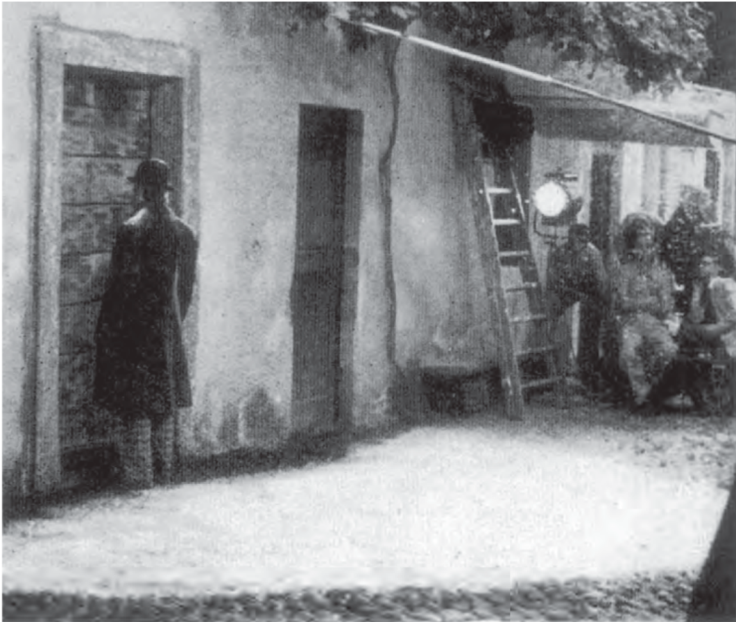
GIACOMO L'IDEALISTA (« Si gira »)