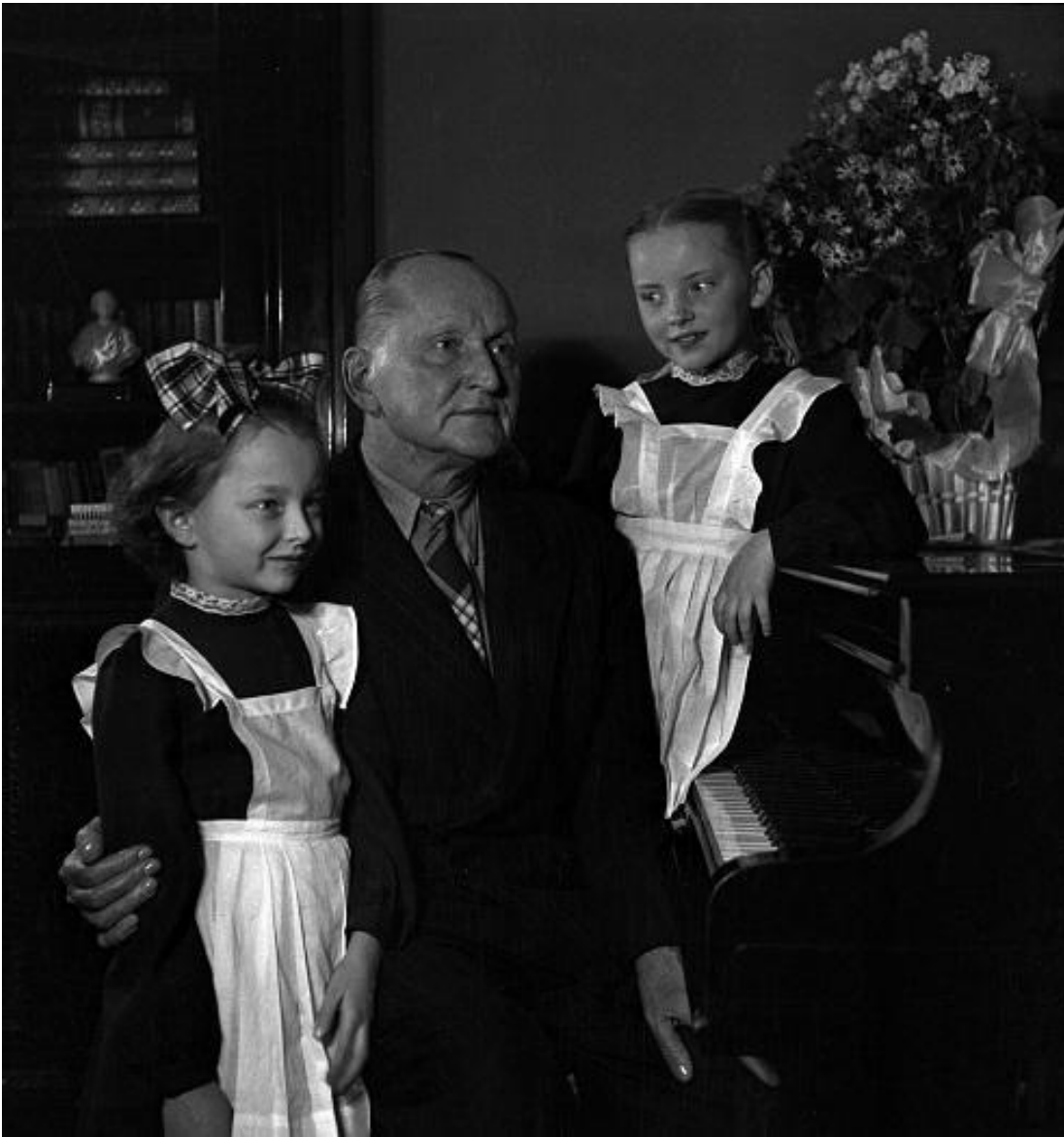
Vertinskij con le due figlie.

Difficile dire se libera scelta o imposizione fu la canzone dedicata a Stalin nel 1945 dal titolo significativo: On (Lui):