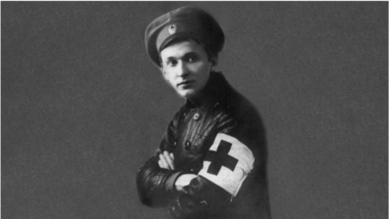
Il giovane Vertinskij volontario sanitario.

Tra le molte leggende che lo riguardarono rientra anche quella delle 35.000 fasciature compiute tra il 1914 e il 1916 al servizio del famoso chirurgo Cholin. Rientrato a Mosca tentò la fortuna al Teatro d'arte, ma fu rifiutato da Stanislavskij in persona a causa della sua erre moscia. Ottenne però al Teatro delle miniature di poter debuttare con un numero di sua invenzione: Arietki P'ero (Le ariette di Pierrot). In costume nero da Pierrot triste, con l'immane lacrima sul viso, Vertinskij iniziò una carriera travolgente che gli avrebbe portato fama e successo fino alla morte. Ideò un genere assolutamente inedito: la poesia-canzone teatrale, ciò che nei decenni si sarebbe sviluppato per diventare canzone d'autore e avrebbe visto in Russia figure epocali quali Vysockij, Okudžava, Grebenščikov, per citare solo i più grandi. Scriveva versi e melodie, talora musicando componimenti di poeti già famosi del simbolismo e dell'acmeismo: Blok, Achmatova, Esenin, talaltra componendo testi ispirati dalla sua esperienza militare e segnati dalle emozioni della guerra. Il suo primo pubblico erano stati i soldati feriti e mutilati per i quali aveva cantato in concerti improvvisati e che avevano costituito la prima ispirazione per le sue ariette.