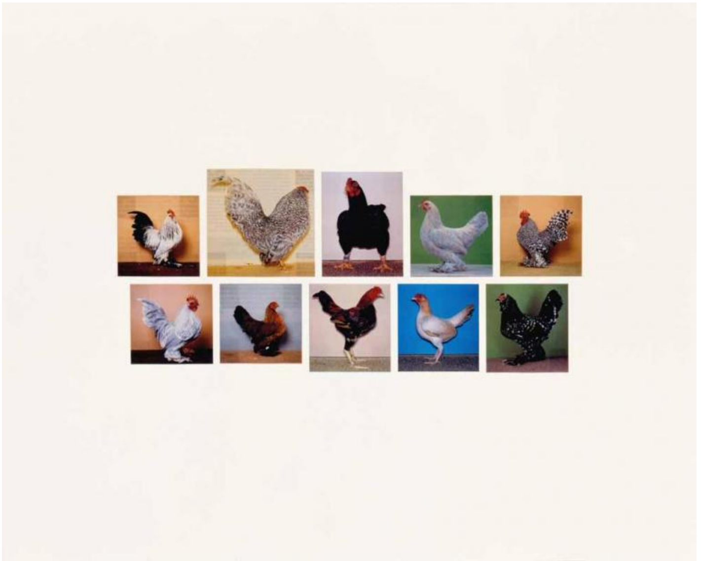
Joachim Schmid, Archiv 606, 1994, courtesy of the artist.

SB, MZ: La sua fotografia è come un testo composto da numerose citazioni senza autore, ma in questa sorta di “copia e incolla” Lei classifica, organizza. In un certo senso la sua fotografia è pensabile non secondo uno stile, ma dettata da una o più logiche. Si potrebbe affermare che la catalogazione è uno stile? O che Lei crei delle sotto-categorie o derivazioni da generi o categorie di soggetti “ben consolidati”? Come articola questa scrittura per immagini, soprattutto quando lavora con immagini della rete, in cui la casualità dell’incontro è meno imprevedibile rispetto alla fotografia analogica?