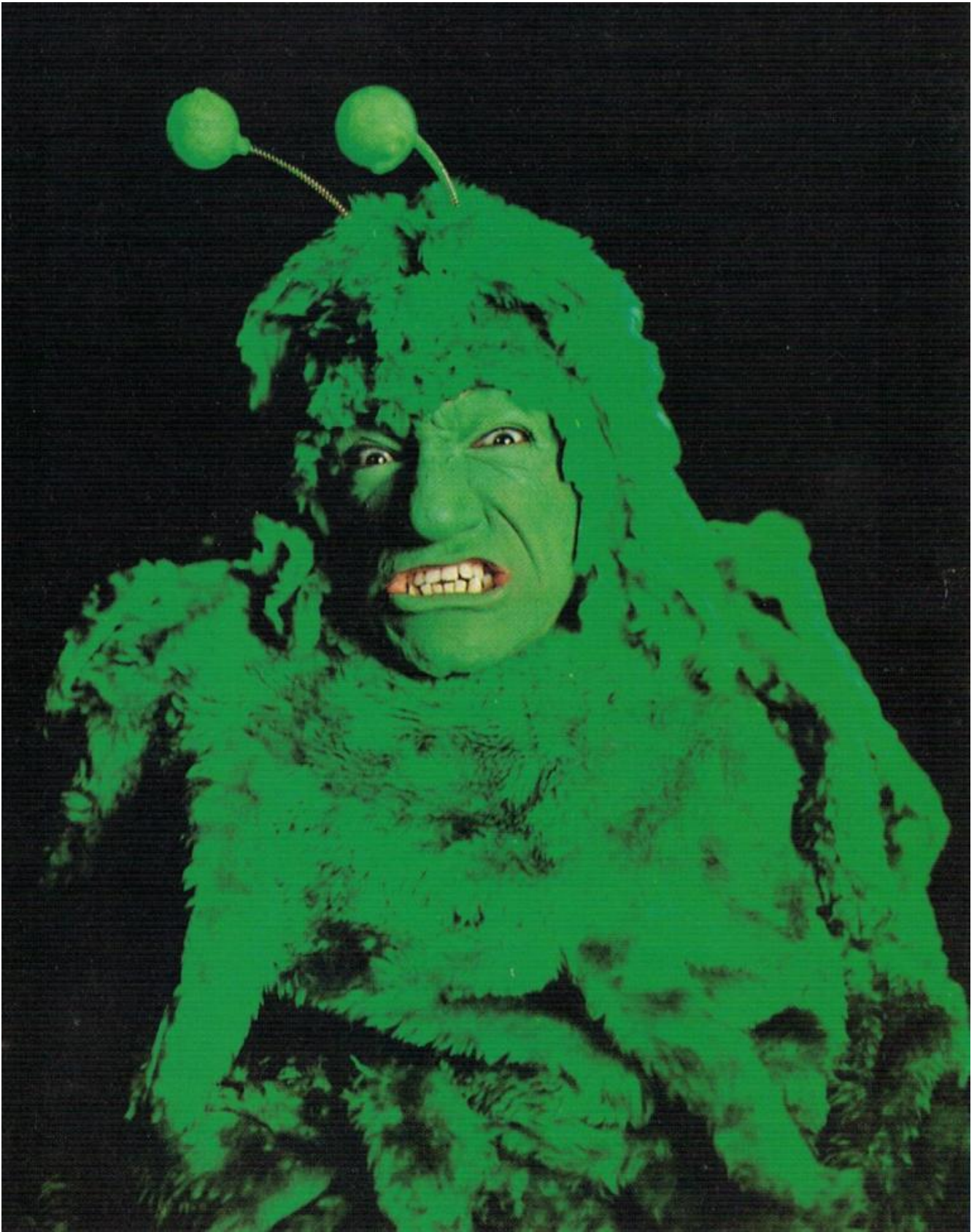
Nabil Shaban è il Marziano.