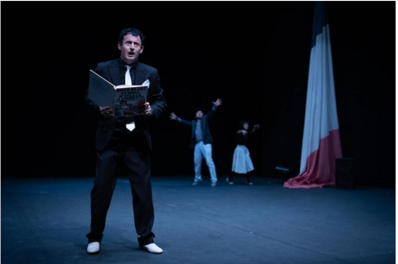
Ottantanove, di Frosini/Timpano.

La Rivoluzione Francese è stata, per certi aspetti, una rivoluzione mancata. La vostra, appunto, è rimandata. Questo vi farà sentire ancora di più lo spirito del 1789 e, chissà, di ogni rivoluzione? Paradossalmente, non “sentirete” lo spettacolo ancora di più?