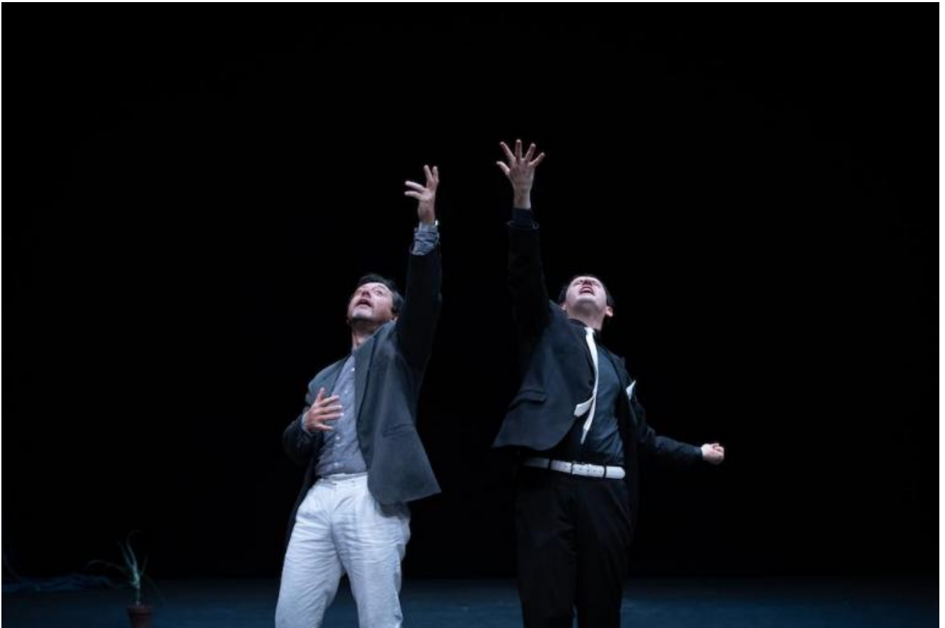
Ottantanove, di Frosini/Timpano, ph. Ilaria Scarpa.

I materiali biografici personali di cui parlava Daniele sono, per così dire, “veri” oppure ricostruiti ad arte? C’è, forse, anche il Coronavirus?