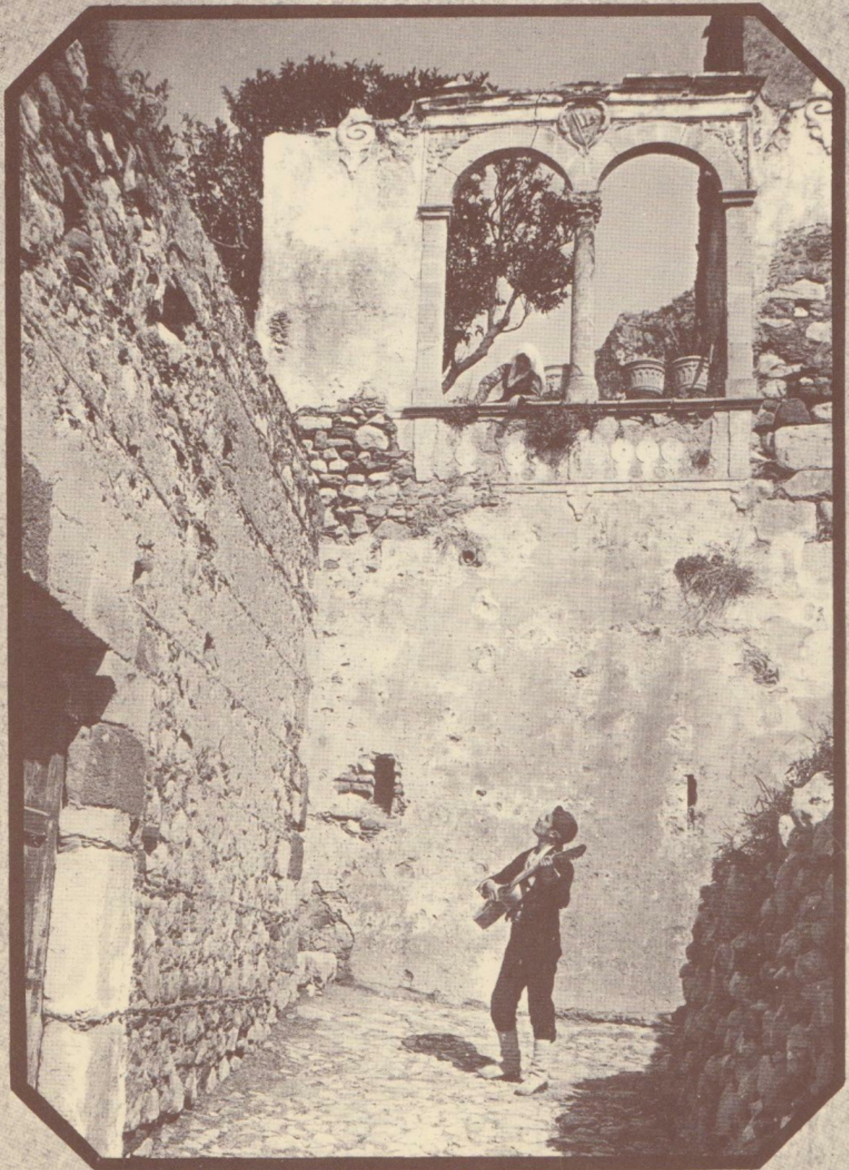
W. von Gloeden Taormina fecit