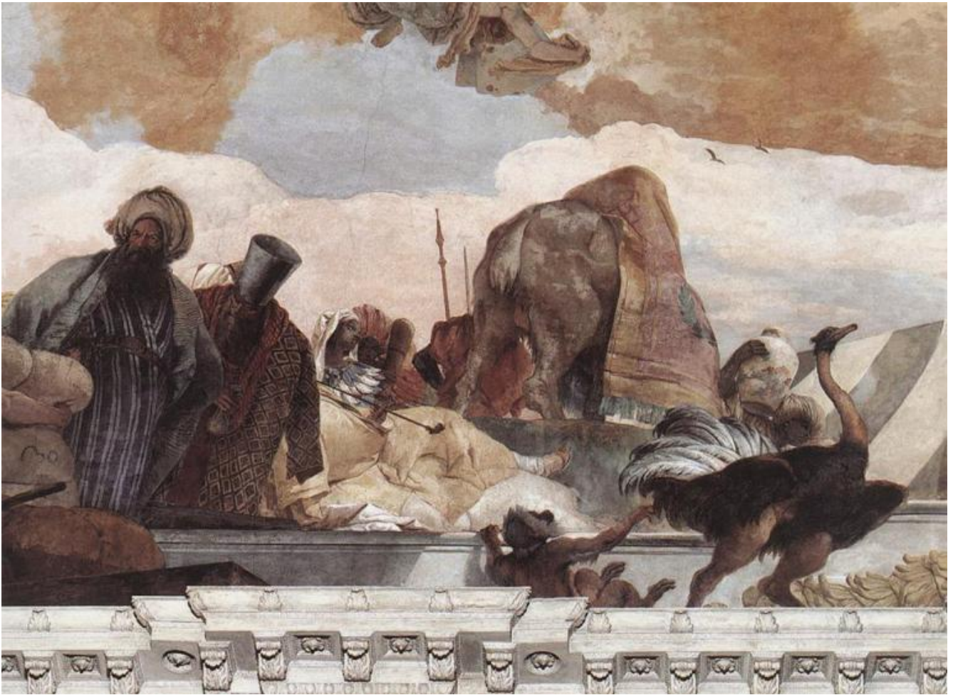
Giambattista Tiepolo, Apollo illumina e vivifica i quattro continenti, allegoria dell'Africa, particolare, 1753. Würzburg, Residenz.

Nelle decorazioni che Tiepolo affresca, insieme a figli e aiuti, per residenze pubbliche e private, il soffitto è un palcoscenico, scrive Giorgio Manganelli in un articolo pubblicato da L'Espresso il 26 settembre 1971. La pittura di Tiepolo eredita da Paolo Caliari detto il Veronese la dimensione architettonica e una sensibilità per la luce e il colore che è tipica della pittura veneta.