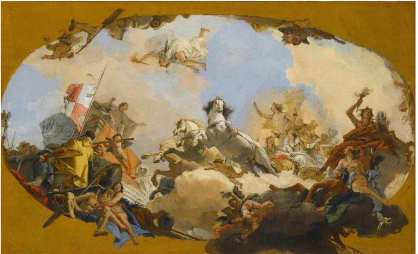
Giambattista Tiepolo, Apollo conduce Beatrice di Borgogna al Genio dell'Impero, particolare, 1751. Stoccarda, Staatsgalerie Stuttgart. Bozzetto per l'allegoria dipinta sul soffitto della sala da pranzo o Kaisersaal della Residenza di Würzburg.

In una intervista rilasciata il 20 marzo 1762 alla Nuova Veneta Gazzetta , Tiepolo dichiara: “Li pittori devono procurare di riuscire nelle opere grandi, cioè in quelle che possono piacere alli signori nobili, e ricchi perché questi fanno la fortuna de' professori [gli artisti], e non già l'altra gente, la quale non può comprare quadri di molto valore”. Nelle quattro puntate Gli abissi di Tiepolo trasmesse da RAI 5 dal 27 novembre 2020 al 18 dicembre per celebrare i 250 anni dalla morte dell'artista, avvenuta il 27 marzo 1770 (il programma ha subito dei ritardi a causa delle restrizioni imposte dalla pandemia), lo storico dell'arte Tomaso Montanari commenta: “sono i ricchi e i potenti che servono alla fortuna dei professori, non sono gli artisti che servono ai ricchi e ai potenti”. In altri termini Tiepolo non dipinge la gloria dei potenti, ma la gloria di una luce che si rivela attraverso la pittura. Per mezzo del colore e della luce l'artista svela l'esistenza di uno spazio che si dilata gradatamente, forse seguendo un'ispirazione musicale, che espande ogni cosa e la porta con sé con leggiadria attraverso il moto dell'aria e della luce.