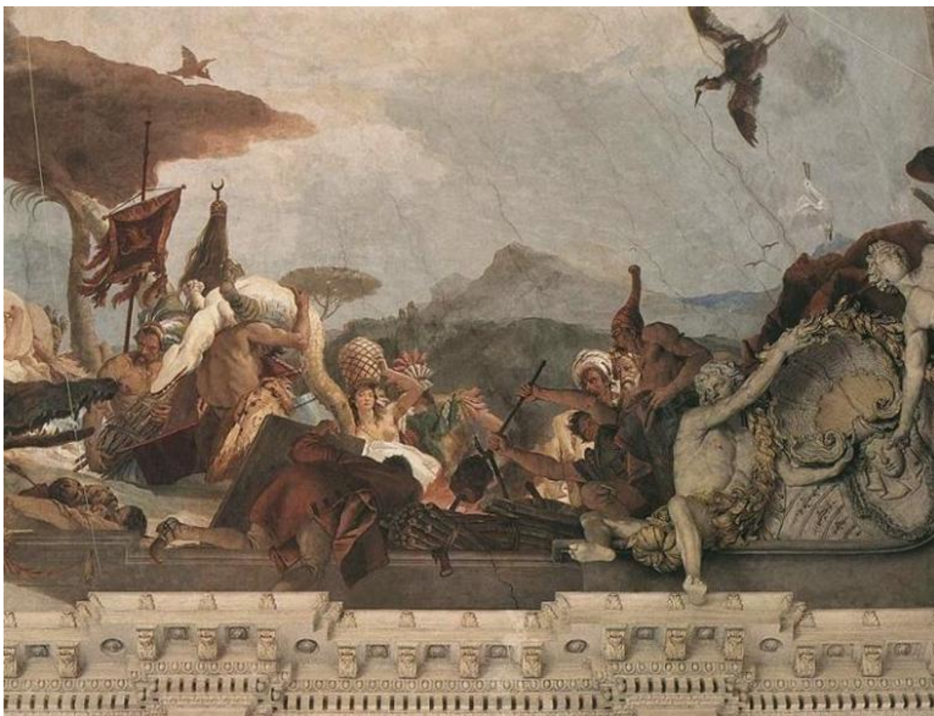
Giambattista Tiepolo, Apollo illumina e vivifica i quattro continenti, allegoria dell'America, particolare, 1753. Würzburg, Residenz.

Un pittore spia dei cannibali che arrostitiscono delle teste umane. Un macaco strappa le piume a uno struzzo. Caimani, cammelli e una varietà di soggetti bizzarri si arrampicano, transitano o sostano sul cornicione del soffitto dello scalone monumentale della Würzburger Residenz. Lungo questa cornice Giambattista Tiepolo mette in scena la rappresentazione allegorica dei quattro continenti allora conosciuti.