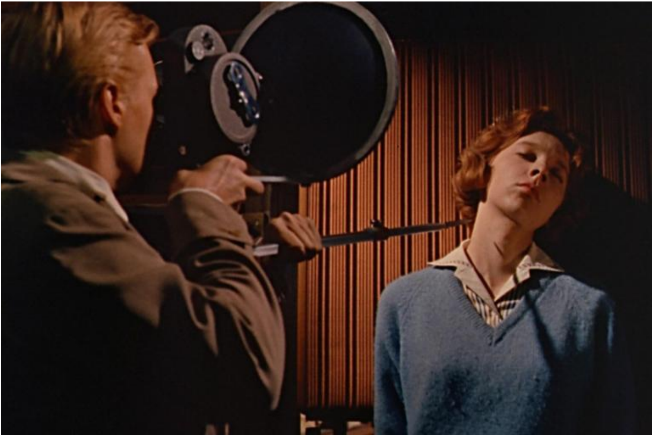
Karlheinz Böhm e Anna Massey in "Peeping Tom".

Se Peeping Tom può essere oggi considerato un progenitore "profondo" dei complessi thriller psicologici del nostro tempo, è l'enorme successo popolare e culturale di Psycho a creare di fatto un genere (lo slasher ) e a settare un nuovo standard di quanto si possa considerare accettabile in materia di violenza esplicita e devianze comportamentali e sessuali al cinema. Tra le cose che accomunano i due titoli: una rappresentazione del serial killer come mostro, la cui eziologia possiamo anche indagare - finanche comprendere - ma che resta una pura e semplice manifestazione patologica. Nessuno si sognerebbe di guardare i due assassini con la benevolenza mista ad ardente ammirazione con cui ci rapportiamo al dottor Lecter.