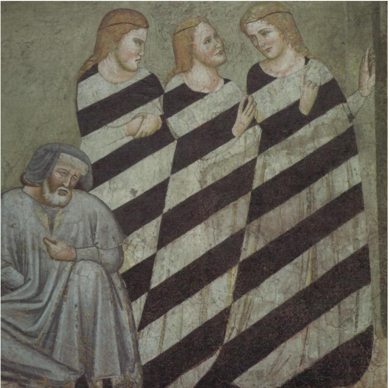
Storie di San Nicolò. Particolare dell'affresco della Cappella di San Giovanni, Chiesa dei Domenicani, Bolzano.

In un'altra ricerca ha parlato di un affresco trecentesco dipinto nella cappella di San Giovanni della Chiesa dei Domenicani, qui a Bolzano. Tre giovani donne, destinate alla prostituzione per il fallimento del padre, vestono la stoffa del diavolo, come l'aveva definita Pastoureau, un abito a righe, e vengono salvate da San Nicolò. Ma che dire delle altre figure che, nella stessa cappella, sono dipinte con abiti a righe?