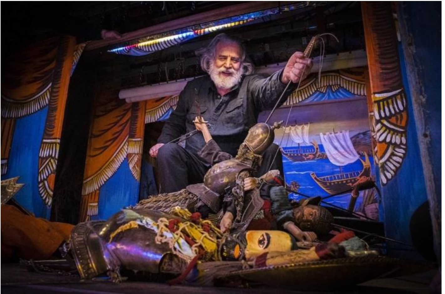
Un'immagine da Eneide.