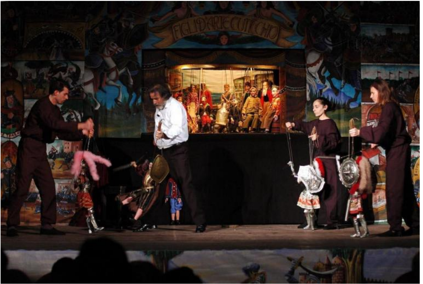
Un'immagine da Don Giovanni.

Continua Cuticchio: “Aprimmo quindi la sala nel vecchio magazzino vicino all’antico porto arabo. Intanto continuava il lavoro nelle scuole. Non potevo tornare tutti gli anni con le stesse storie. Gli insegnanti mi chiedevano se avevo qualcosa di nuovo e dovevo far fronte alla concorrenza di clown, prestigiatori, giocolieri, animatori... Mi misi a leggere alcuni libri di testo delle medie e scoprii che studiavano l’ Iliade , l’ Odissea e altri poemi. Dal 1974 iniziai a costruire i pupi per queste altre storie, e ci sono voluti molti anni. Integravo le nuove figure con paggetti della tradizione. Il lavoro più impegnativo è stato sbalzare le armature. L’ Iliade è quasi diventata un’ Odissea , tanto ci ho lavorato”.