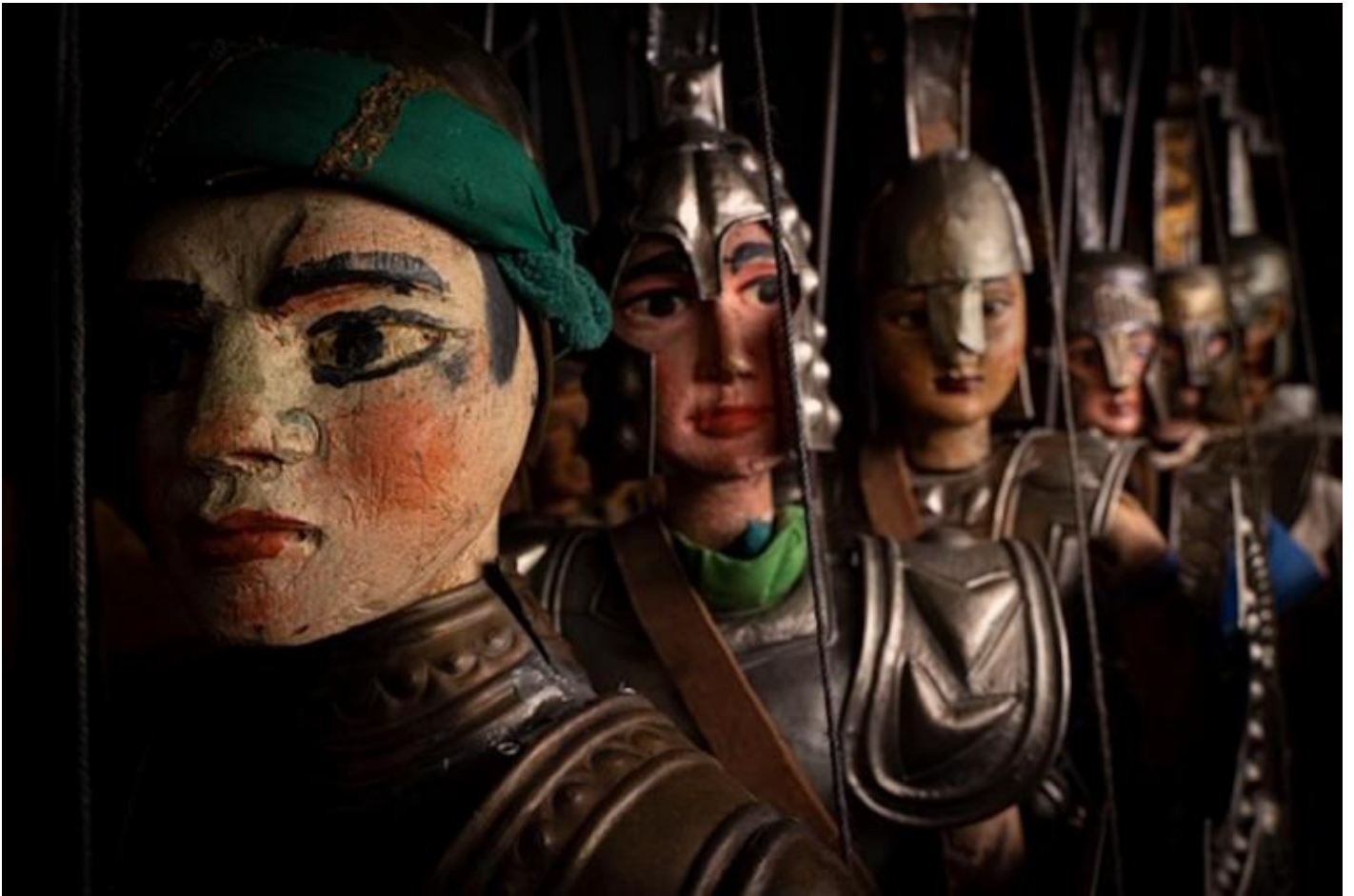
Guerrieri dell'Ira di Achille.