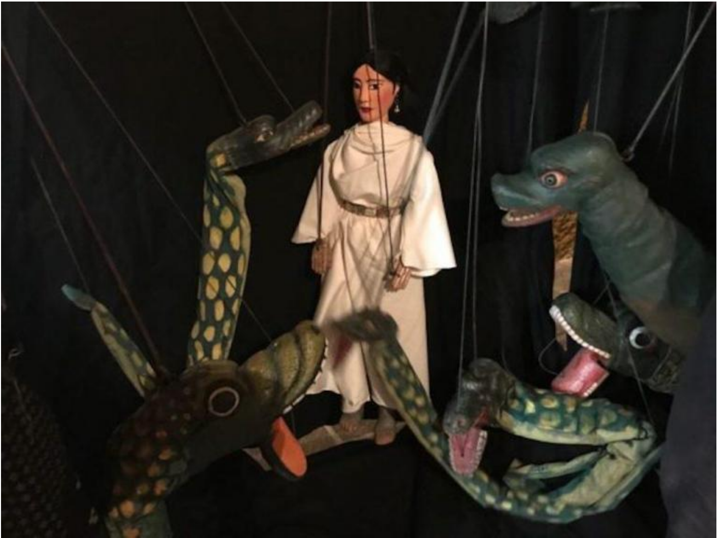
Un'immagine da Medusa.