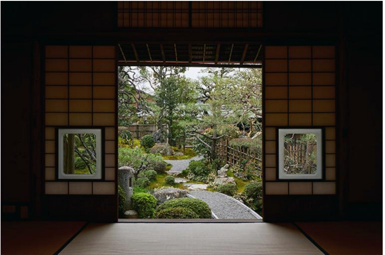
Una veduta del giardino della Sekison-tei, la casa in cui Tanizaki abitò dal 1949 al 1956.

Il corpo e la natura, e più in generale la meditazione sul passato, rimandano incessantemente per Tanizaki all'archetipo materno, dunque a un rapporto di fusione tra il bambino e la madre, che nel ricordo intreccia il piacere al rimpianto. Dopo una giovinezza influenzata soprattutto da modelli occidentali, il suo interesse per la cultura e le arti della tradizione crebbe a partire dagli anni '20, ed è spesso associato al trasferimento dal Kantō al Kansai, ma già in precedenza, non a caso, aveva trovato espressione in uno dei suoi racconti più evocativi basati su questo archetipo, scritto due anni dopo la morte della madre e poco prima di quella del padre. In Nostalgia della madre (1919) un bambino cammina nelle tenebre della notte tra filari di pini in uno scenario apparentemente sconfinato, seguendo i bagliori che intravede in lontananza, il rumore delle onde del mare e i suoni di voci e strumenti musicali che richiamano il Giappone di un tempo, come visioni di una fantasmagoria. E come in un altro racconto in cui Tanizaki reinventò la propria infanzia nella magnifica casa di Kyōto dove visse per alcuni anni dal 1949, Il ponte dei sogni (1959), due sono le figure femminili che incontra: dapprima una matrigna che scambia per sua madre, in una casa di contadini dal