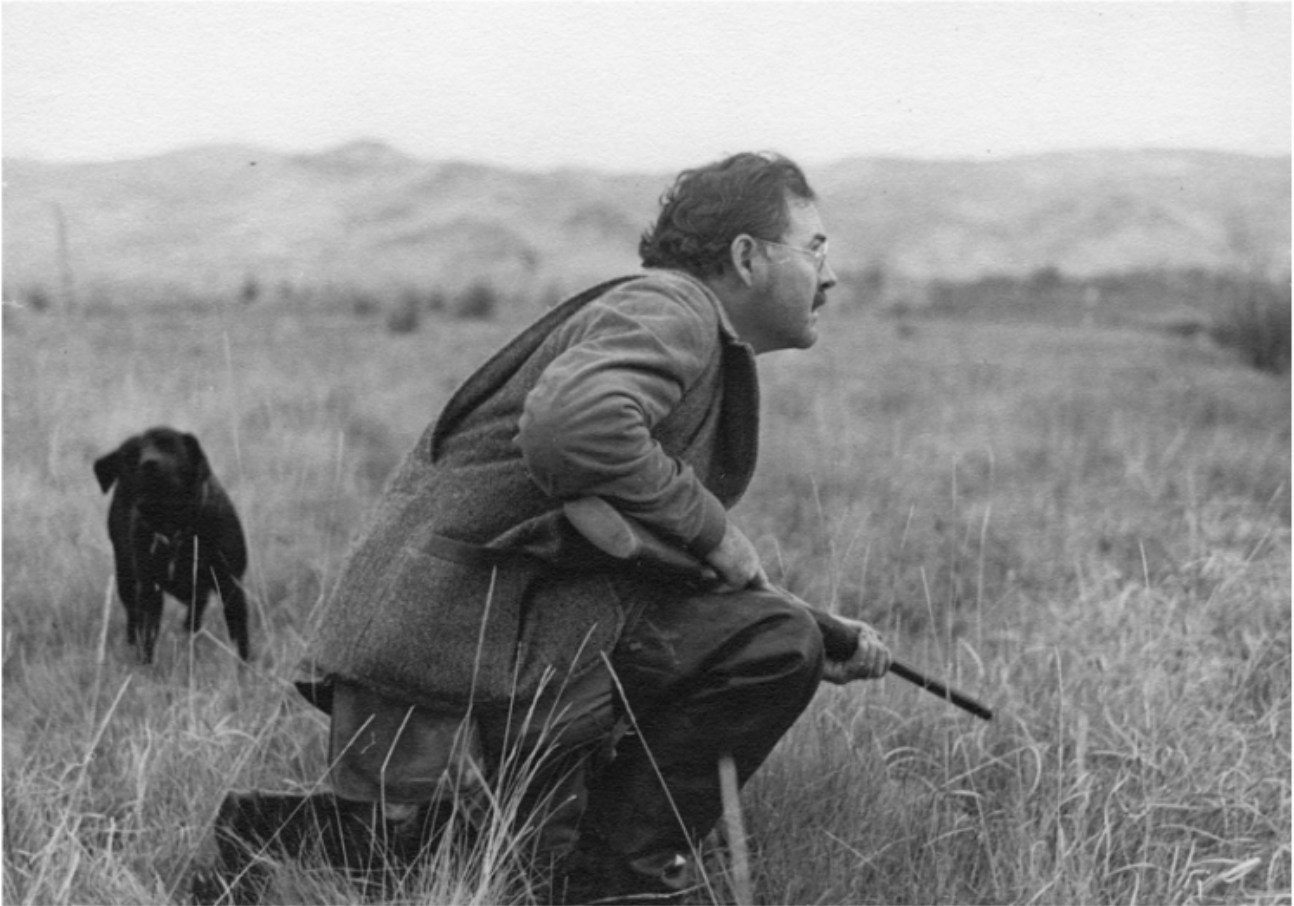
Ernest Hemingway a caccia di anatre a Ketchum, Idaho. Ottobre 1941.