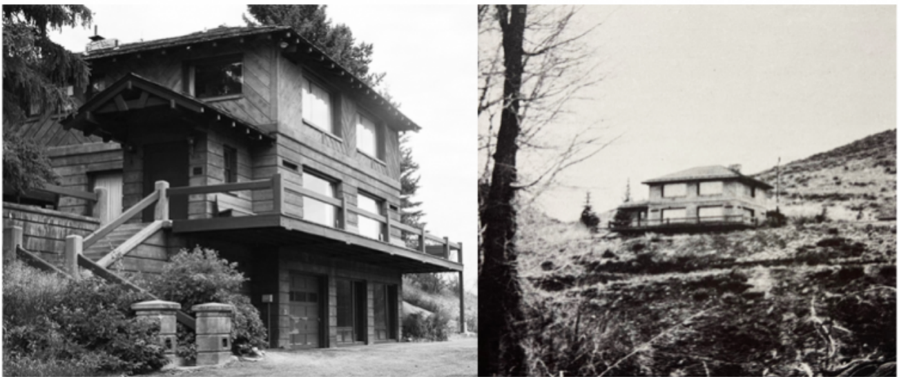
La casa di Ketchum dove Ernest Hemingway si suicidò. A sinistra come è oggi, a destra durante la costruzione

Il 1940 fu l'anno del divorzio da Pauline e il secondo in cui passò la stagione invernale a Sun Valley con Martha. Presero alloggio in una suite da 38 dollari a notte che, grazie ai servizi da testimonial, pagava al prezzo nominale di 1 dollaro. A novembre Ernest e Martha si sposarono. Festeggiarono con amici del posto e Robert Capa, che lo aveva raggiunto, come dicevamo poc'anzi, per lavorare a un reportage per Life ("The Novelist Takes A Wife"), contribuendo così ad alimentare il mito hemingwayano e quello della stazione sciistica. Capa immortalò, poi, in un secondo reportage, l'anno successivo, le avventure di caccia di Hemingway e ("Life Goes Hunting At Sun Valley").