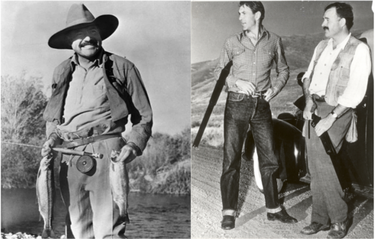
La prima foto “ufficiale” di Hemingway a Ketchum fu presa a pesca sul Big Wood River. Quella fu anche l’unica volta in cui si dedicò alla pesca in Idaho. Per il resto fu sempre e solo caccia. A destra è ritratto insieme all’amico Gary Cooper.