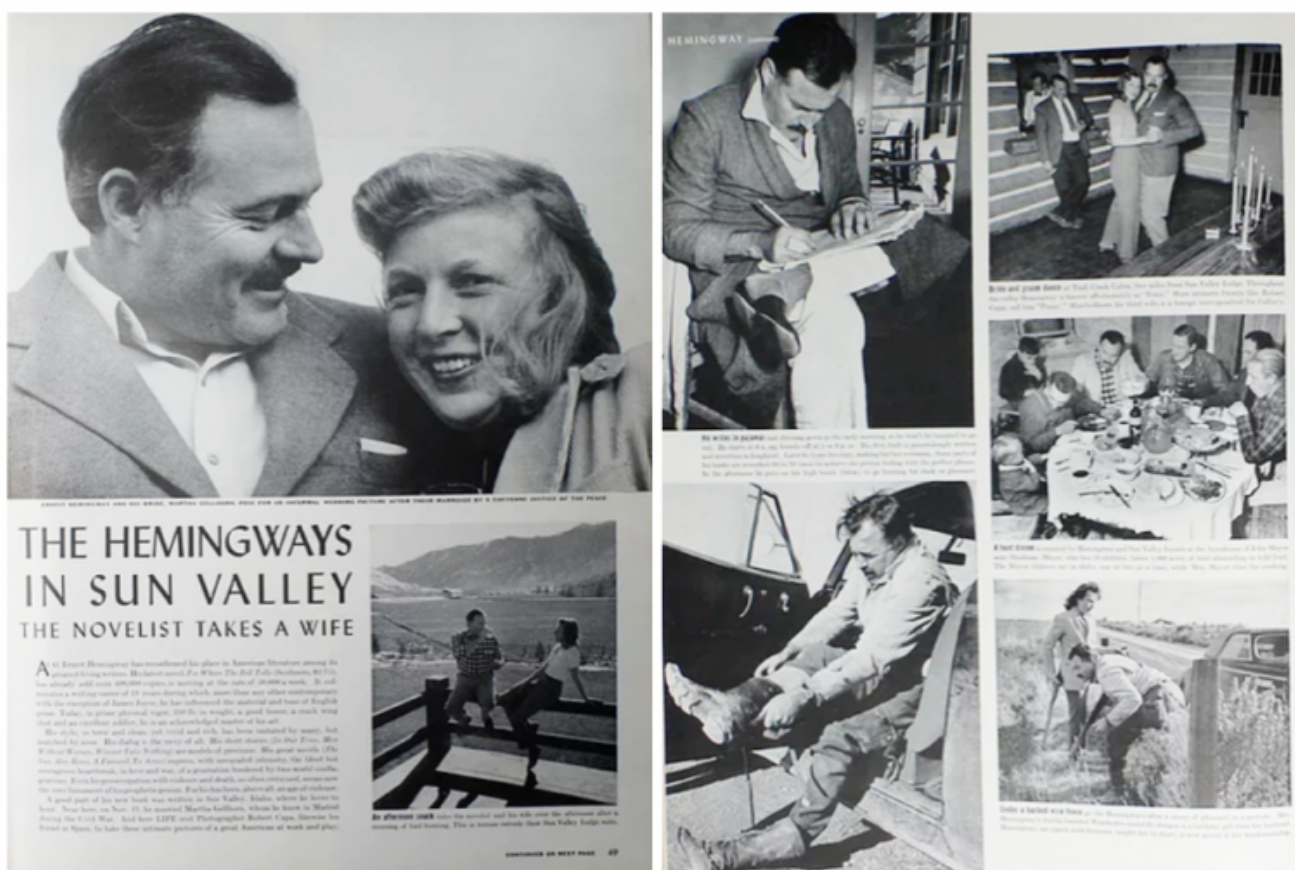
Reportage di Robert Capa pubblicato sul settimanale Life . Gennaio 1941.

La trasposizione cinematografica avrebbe fatto infuriare lo scrittore al punto di essere stato vicino a rompere l'amicizia con Cooper per aver accettato i compromessi della sceneggiatura (comunque i due rimasero sempre vicini e il ventennale sodalizio tra lo scrittore e l'attore è stato raccontato nel film documentario The True Gen , del 2013). Il pubblico fu però di diversa opinione, e il film ebbe un successo strepitoso, con gli uomini che si commuovevano davanti all'eroismo di Cooper (il senatore John McCain disse che il personaggio di Jordan era stato il suo idolo giovanile), e fra le signore divenne di gran moda il taglio di capelli "alla Bergman". La pellicola ricevette anche ben nove nomination all'Oscar (1944), vincendone solo una per Katina Paxinou come migliore attrice non protagonista, mentre quello stesso anno l'Oscar come miglior film lo vinse Casablanca , pellicola in cui, anche lì, aveva recitato Ingrid Bergman.