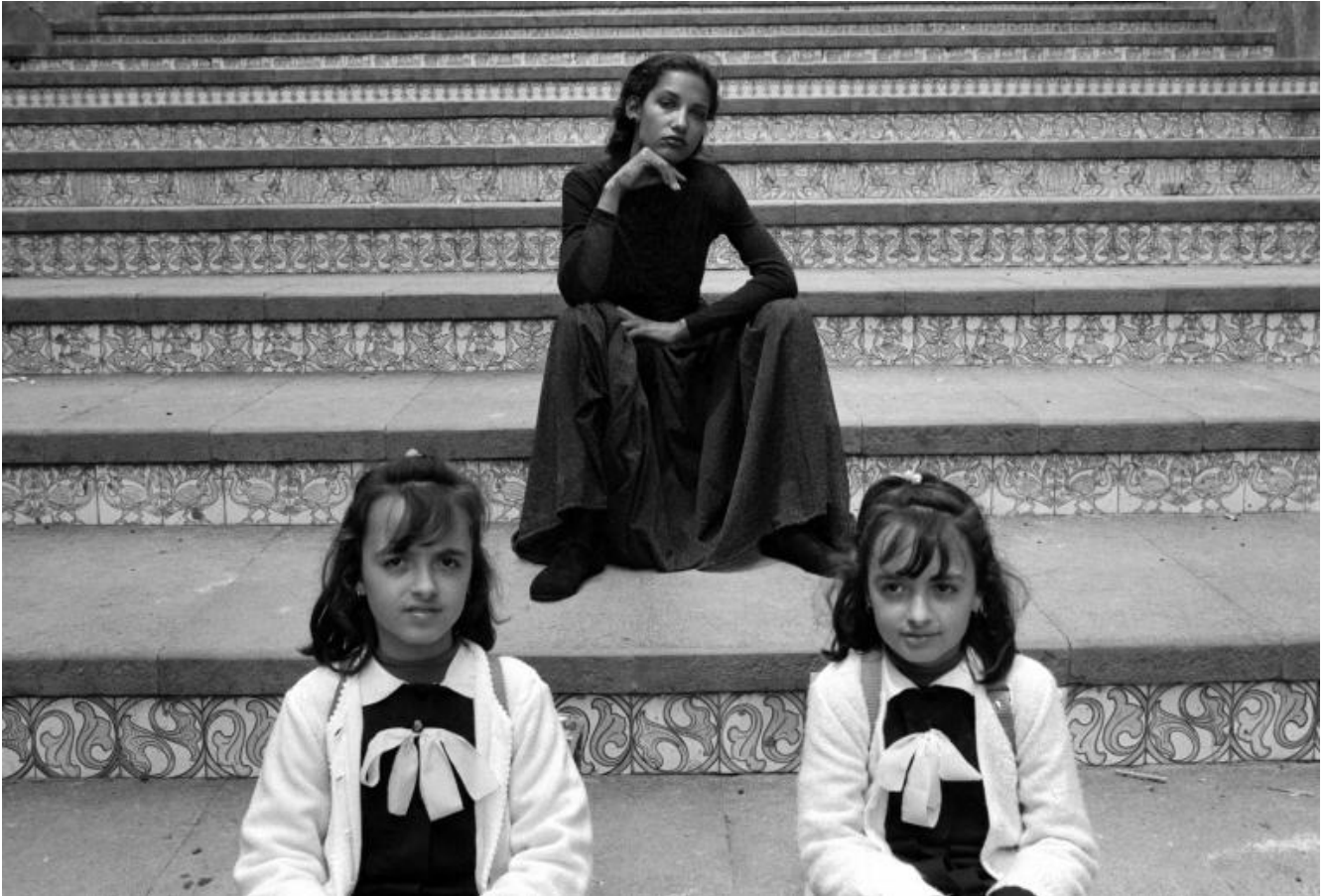
Ferdinando Scianna, Marpessa e Gemelle, 1987 negativo bianco e nero, stampa digitale © Ferdinando Scianna.

narrazione, tesa a dimostrare che “l’umanità è ‘una’”, che gli individui sono accomunati da un unico destino, che “nascono, lavorano, ridono e muoiono dappertutto nella stessa maniera” rischia di impedire “una comprensione storica della realtà.” Non a caso, infatti, le fotografie non riportavano né date, né luoghi o indicazioni di soggetti, ma unicamente il nome del fotografo, della sua nazione di provenienza e della rivista o dell’agenzia di riferimento.