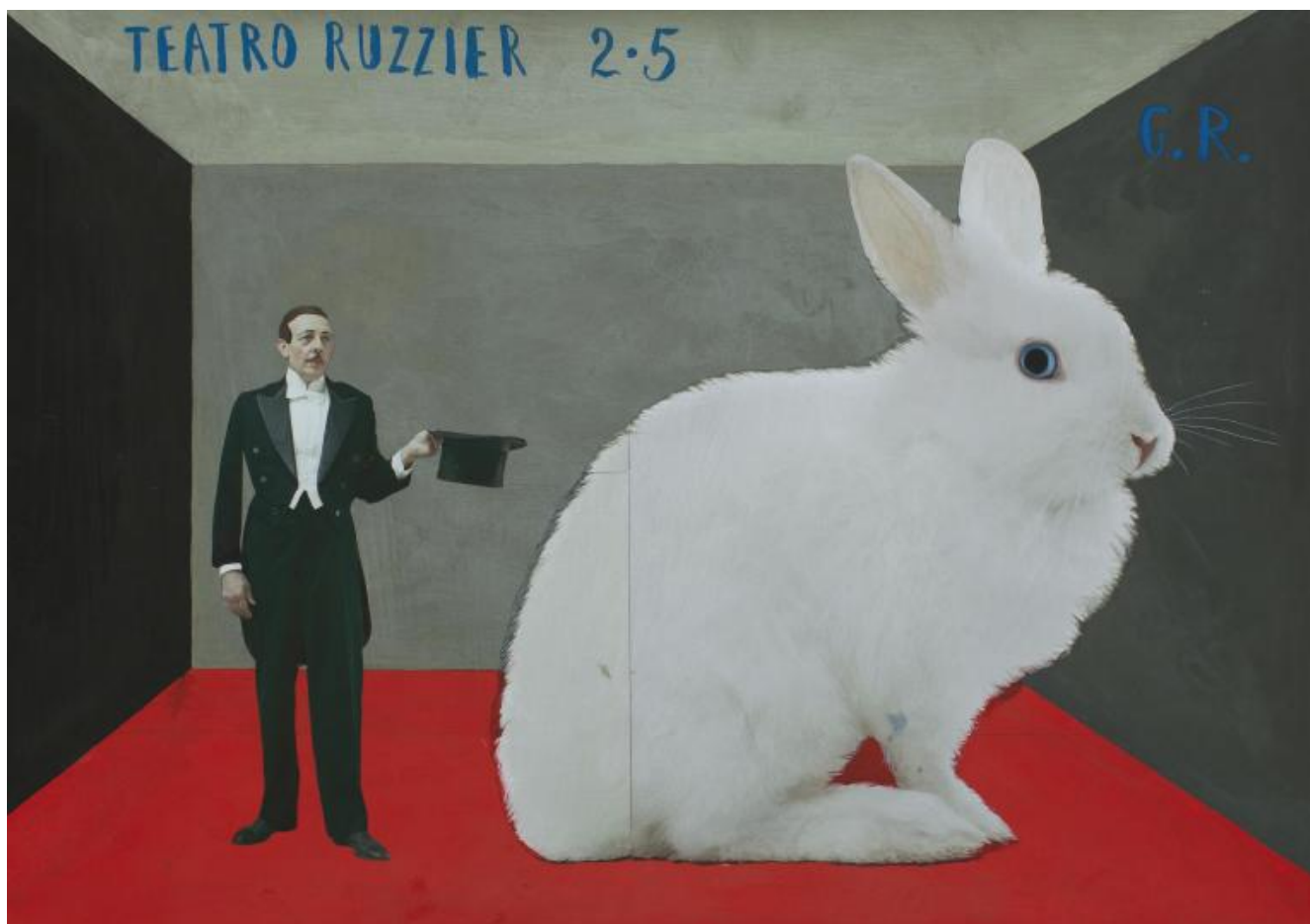
Paolo Ventura, Teatro Ruzzier, 2020, tecnica mista e collage Monza, Collezione Privata Courtesy Matteo Maria Mapelli.

In definitiva, cosa lega queste fotografie e queste date? E cosa unisce queste due mostre?