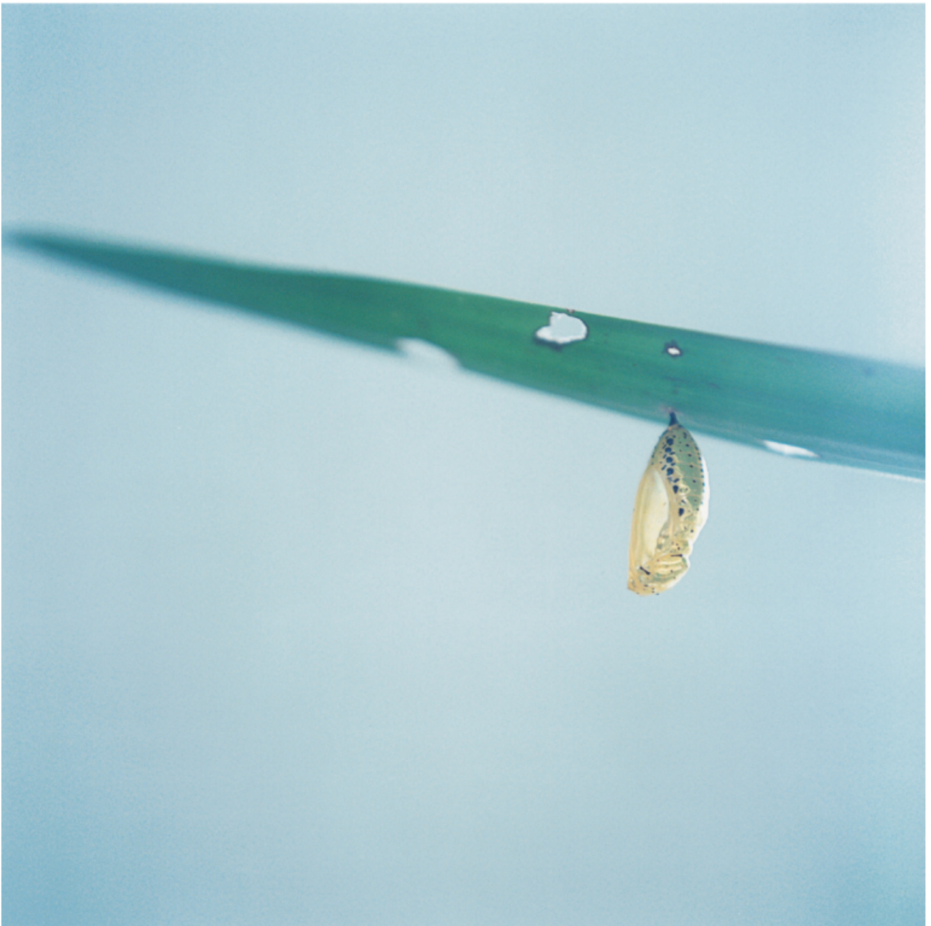
Kawauki Rinko, Untitled, 2004.

Il capitolo Vita intima - probabilmente tra i più sentiti dall'autrice, attenta alle tematiche femministe e di genere che trovano qui molta eco - presenta una pratica fotografica come «esercizio di patologia, un montaggio e una messa in sequenza di momenti privati apparentemente senza filtri che rivelano le origini e le manifestazioni delle vite emotive dei soggetti». Capostipite di questa pratica è la statunitense Nan Goldin (n. 1953), il cui lavoro documenta con grande intensità ed autenticità le proprie relazioni affettive e amicali. Cotton cita anche l'influenza delle foto di Araki Nobuyoshi (n. 1940), un diario senza censure delle proprie