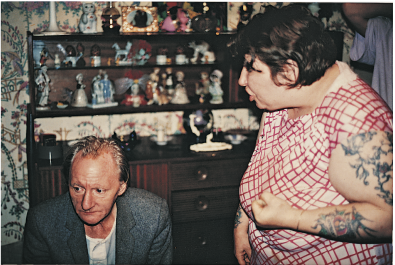
Richard Billingham, Untitled, 1994.

fantasie erotiche, e di quelle di Larry Clark (n. 1943), che negli anni sessanta e settanta ritraeva con grande complicità il nichilismo sex & drug & rock'n'roll dei giovani americani. Un esempio molto efficace, sia per l'espressività delle immagini, sia come paradigma di questa categoria, è la foto dell'inglese Richard Billingham (n. 1970), che aveva cominciato a scattare istantanee della sua famiglia alla Andy Capp - padre alcolizzato, madre obesa e irascibile - come bozzetti per i suoi quadri alla scuola d'arte ( Untitled , 1994). Nel giro di pochi anni le sue foto sono finite in un libro ( Ray's laugh ) e si sono guadagnate una mostra alla Royal Academy.