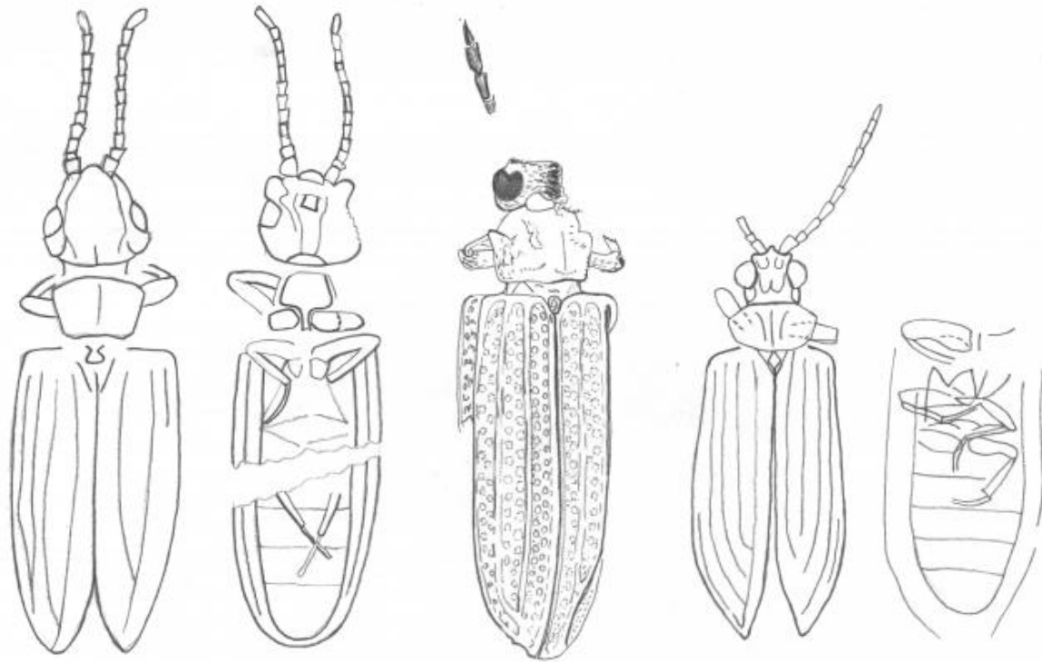
1) Cupes manifestus

notizie strabilianti dall'al-di-là entomologico. Mi scopro prostrato, in uno stato semi-crepuscolare di esistenza.