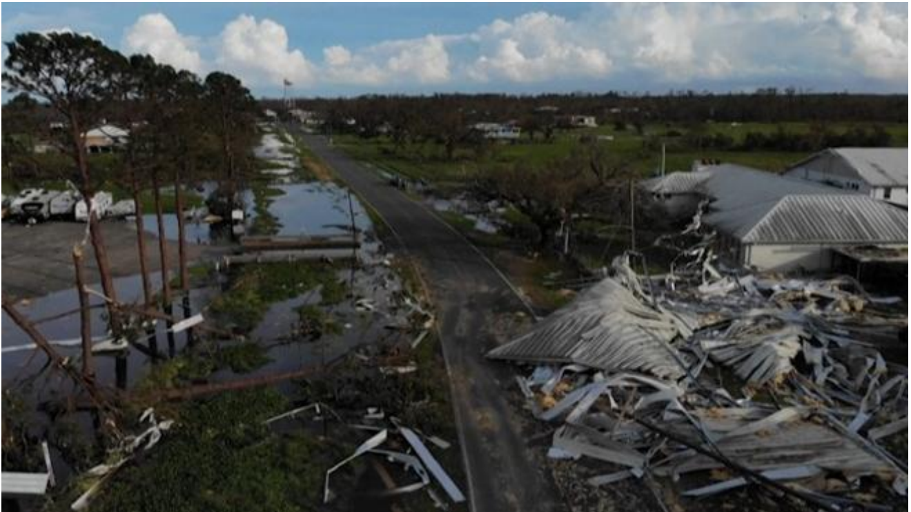
Ida in Louisiana

L'emergenza climatica quaggiù è parte della vita di tutti i giorni. Le temperature invivibili, gli uragani e le tempeste sempre più frequenti. Non che sia un'esclusiva. Lì dove l'acqua non arriva, c'è il fuoco che a est da mesi sta divorando case, campi e boschi. Questi sono però gli stati più poveri d'America e la povertà ha un modo tutto suo di moltiplicarsi in via esponenziale. Serve aggiungere che la comunità afroamericana in maggioranza vive al Sud? E allora per una volta, prima che l'attenzione si spenga, vale la pena soffermarsi su questo disastro in termini di umanità perché ogni uragano è un trauma che segna intere generazioni.