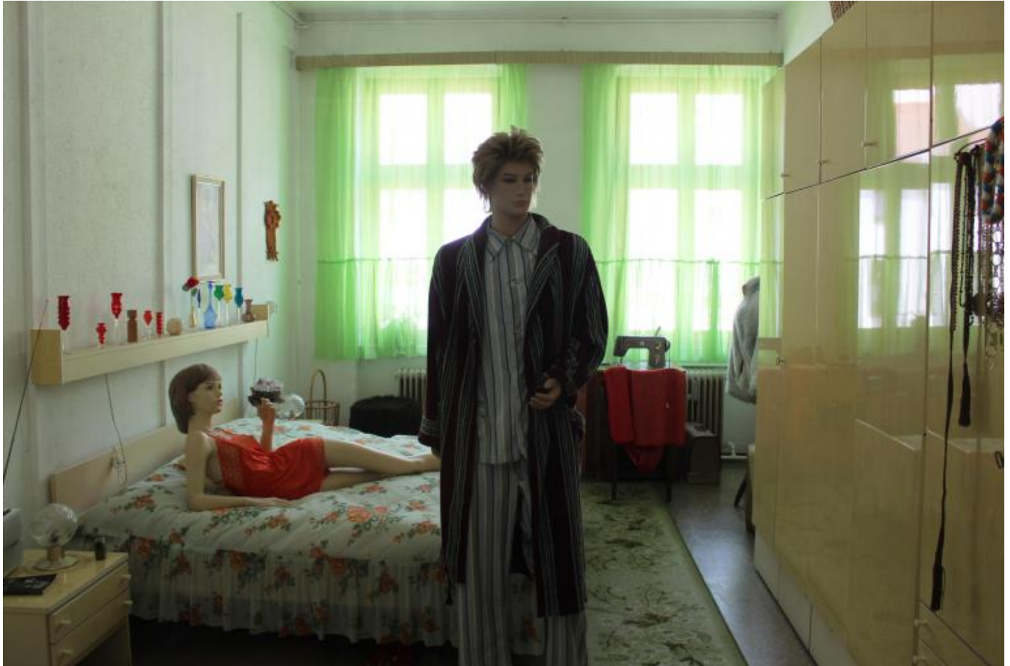
Camera da letto con donna in négligé.

stili della ex DDR con il dovuto distacco e straniamento. Sono piuttosto mimetiche rivisitazioni di situazioni abitative, ampiamente corredate di manichini, che puntano a una rappresentazione idilliaca della quotidianità ma che risultano prive sia di spirito critico che di atmosfera. Si trovano anche in netta contraddizione con ciò che Jurij Lotman sosteneva già parecchi decenni fa: Un'opera d'arte, nel contesto del suo insieme naturale, convive con opere non solo di altri generi ma anche di altre epoche. Qualsiasi intérieur culturale realmente esistente noi scegliessimo, non sarà mai riempito da oggetti e opere sincroniche rispetto al momento della loro creazione. Lo scrupoloso assemblaggio creativo segnato dai decenni di appartenenza pecca, dunque, anche sul fronte metodologico.