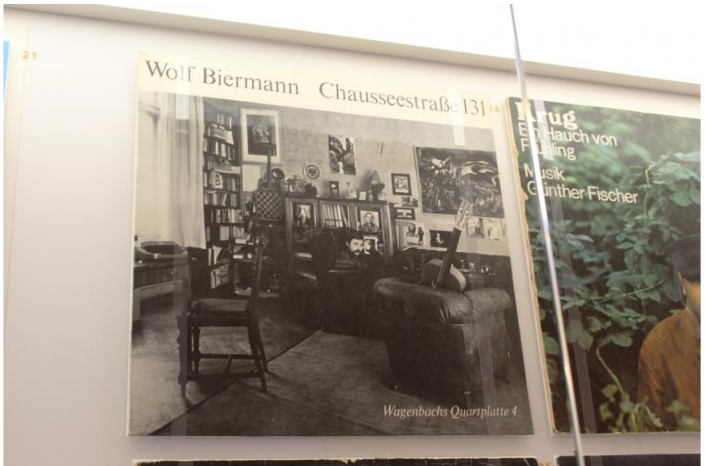
Momenti di storia culturale della DDR (Nina Hagen e Wolf Biermann).

In quello che era stato il bagno originale dell'asilo si conservano documentazioni dell'epoca, senza scadere nell'oleografica ricostruzione struggente di un habitat perduto.