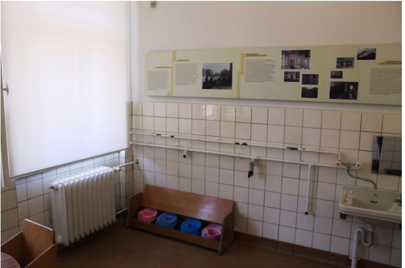
Il bagno dell'asilo.

I tabelloni illustrativi non si limitano a fornire dati cronologici o statistici, ma suggeriscono riflessioni concettuali. Heimat : l'idea di patria come interpretata dalla DDR, un Paese nato senza essere voluto, sorto dalla disfatta della Germania nella Seconda guerra mondiale, dalla divisione in zone del Paese e dalla guerra fredda che avrebbe regolato l'esistenza di cittadini in due sistemi ideologici opposti. Heimat per la DDR diventava non soltanto uno stato emotivo e mentale (sicurezza, appartenenza, mentalità) ma un programma politico. L'iniziale idea di utopia a cui dare il proprio contributo si era trasformata, con l'erezione del Muro di Berlino, in una costrizione definita da confini di stato. Apprezzabile è anche la sintetica riflessione sul cambio di status degli oggetti dopo il crollo del sistema, sul loro deprezzamento e conseguente rottamazione: "auto di cui si attendeva la consegna per anni offerte in cambio di ben più potenti macchine occidentali, simboli di partito prestigiosi ridotti a carabattole senza valore, restaurazione e demolizioni di edifici, la torre di Alexanderplatz, ex simbolo del socialismo, che diventa l'icona della nuova Berlino unificata". Pensieri sui quali vale la pena di soffermarsi e che i materiali della mostra aiutano ad approfondire.