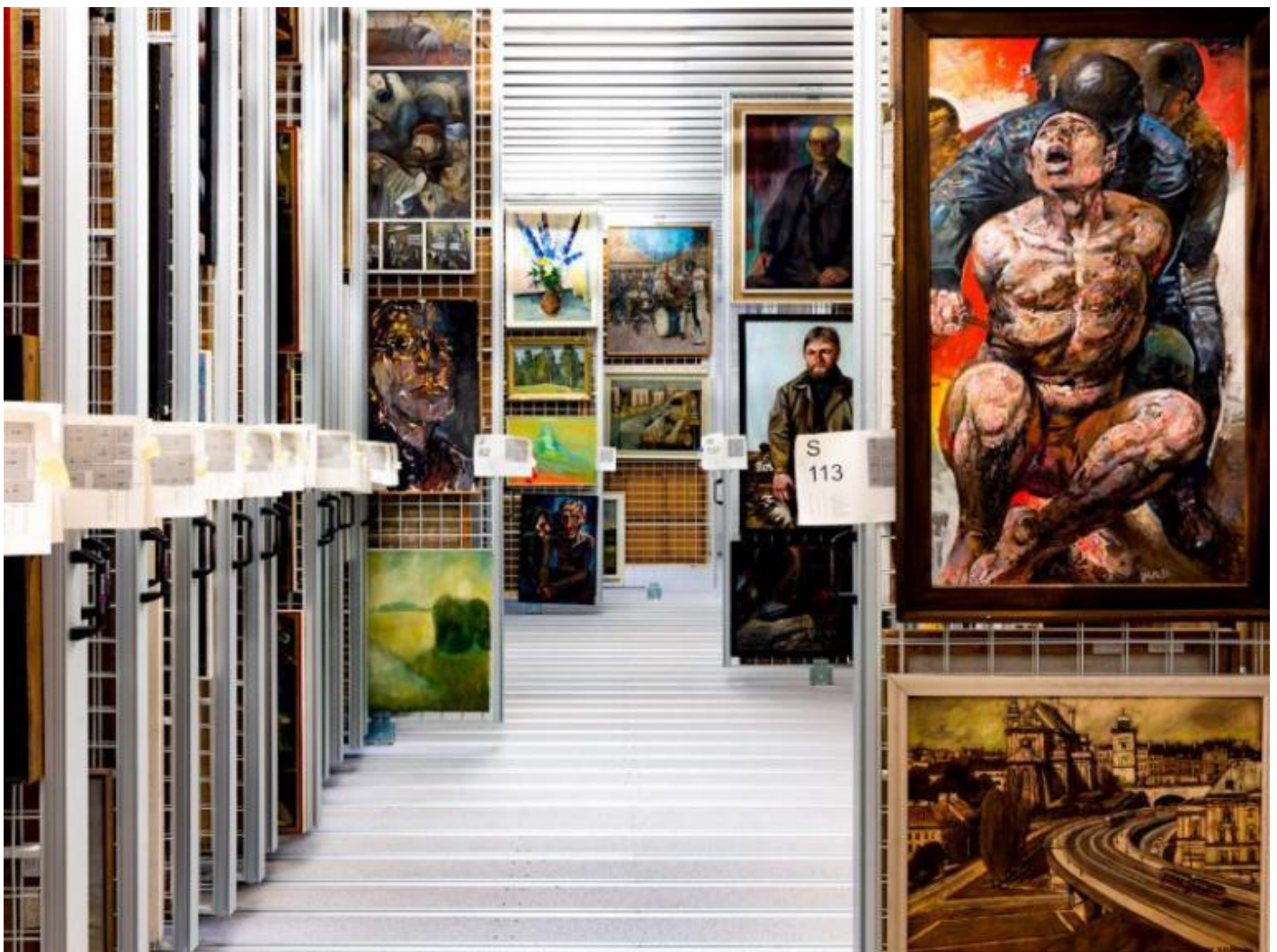
Il deposito dei quadri al museo di Beeskow.

Di levatura considerevolmente superiore, sia per l'impianto generale che per la conduzione delle ricerche, è il Museum Utopie und Alltag , con sede a Eisenhüttenstadt, una cittadina dalla storia molto particolare di cui ho già avuto occasione di trattare su "Doppiozero" , responsabile oggi sia della collezione iniziata in loco nel 1993 (sotto la rigorosa direzione dello storico Andreas Ludwig, proseguita fino al 2012), e confluita dal 2001 nella mostra permanente, che della raccolta d'arte conservata nella cittadina di Beeskow . Il Centro di documentazione sulla cultura quotidiana della DDR conta 170.000 pezzi e lavora con uno staff di tutto rispetto alla digitalizzazione, sistematizzazione e schedatura dei materiali per arrivare a costituire un vero archivio della cultura materiale. L'archivio artistico di Beeskow conta 18.500 reperti di arte visuale: quadri, sculture, disegni, grafica, fotografia. Negli anni i responsabili hanno sviluppato collaborazioni con Università, Fondazioni, Scuole, Istituti di ricerca tedeschi e stranieri.