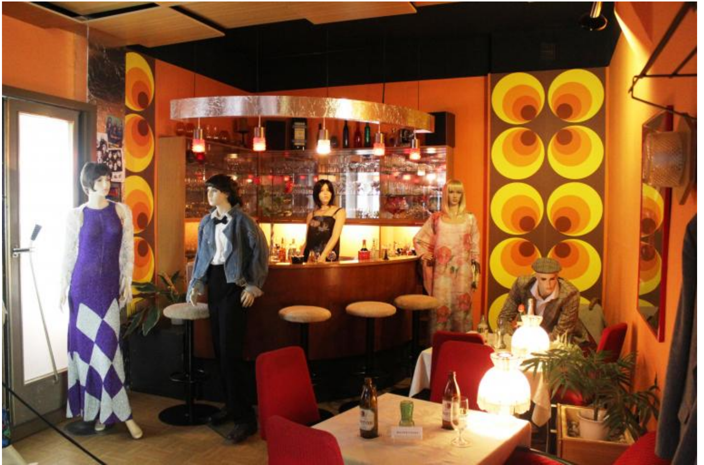
Nightclub anni Settanta.