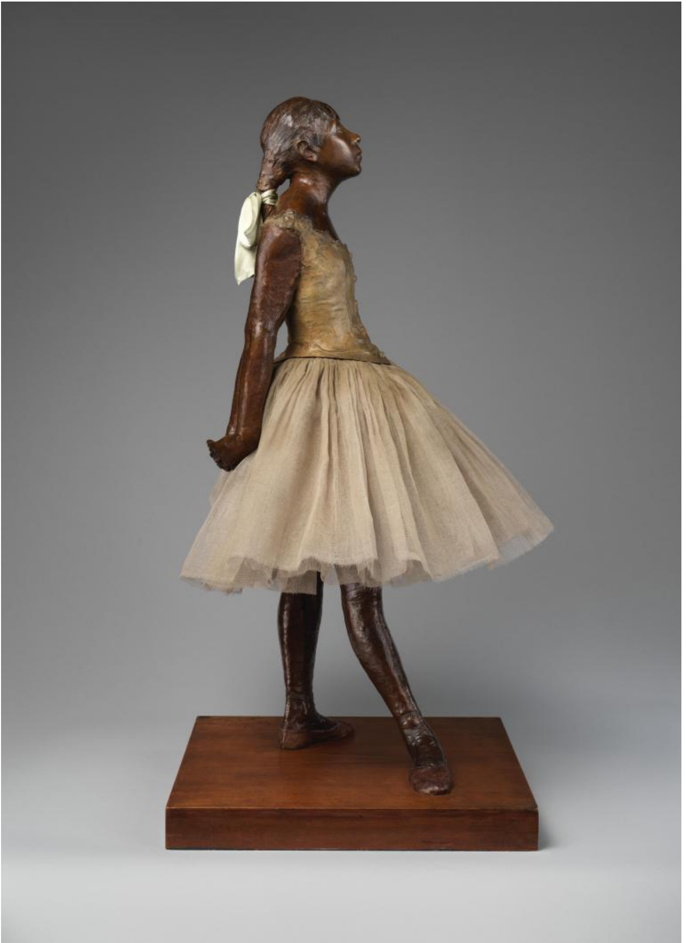
E. Degas, "Petite danseuse de quatorze ans", 1880-81.