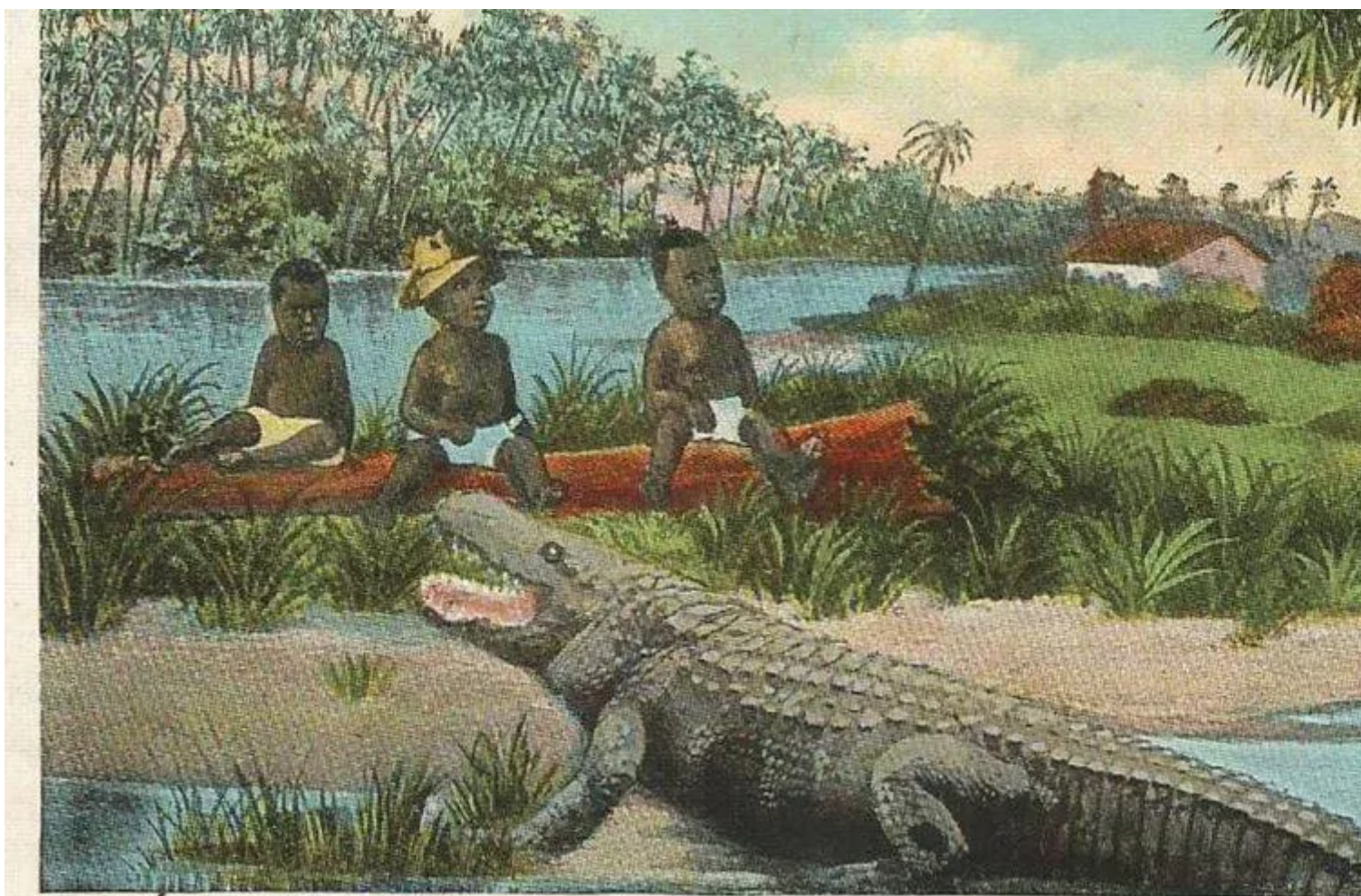
ALLIGATOR BAIT, ON THE CHAGRES RIVER, PANAMA CANAL

Se continuiamo a tenere vivo questo spazio è grazie a te. Anche un solo euro per noi significa molto. Torna presto a leggerci e SOSTIENI DOPPIOZERO