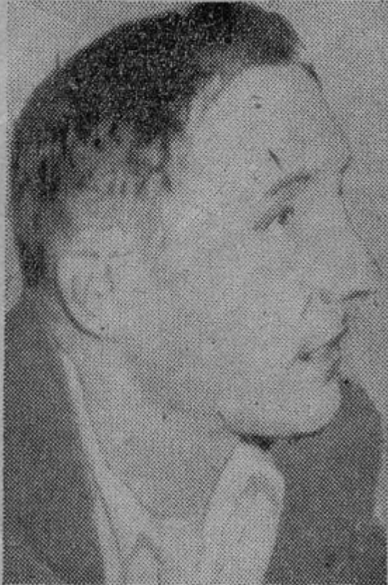
WILLIAM S. BURROUGHS