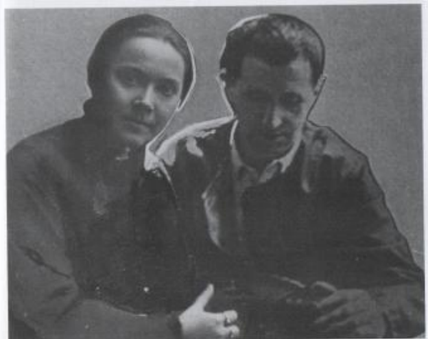
Fotomontaggio con immagine di Bertolt Brecht.