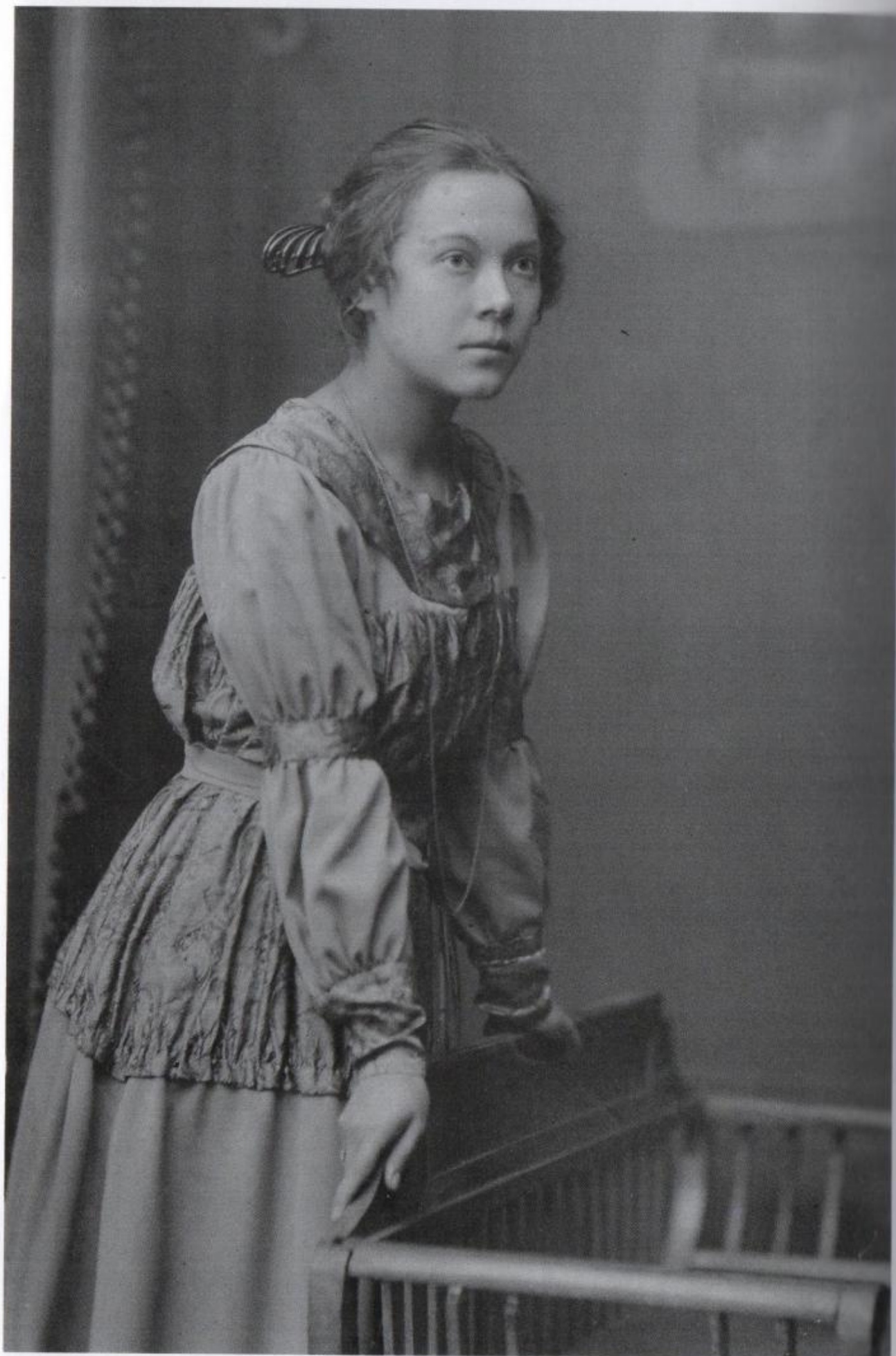
Ritratto di Asja Lācis, 1910-12 circa.