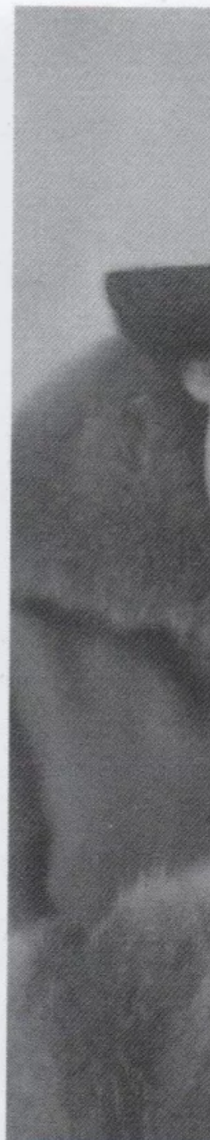
Ritratto di Asja Lācis, Mosca, 28 gennaio 1918.