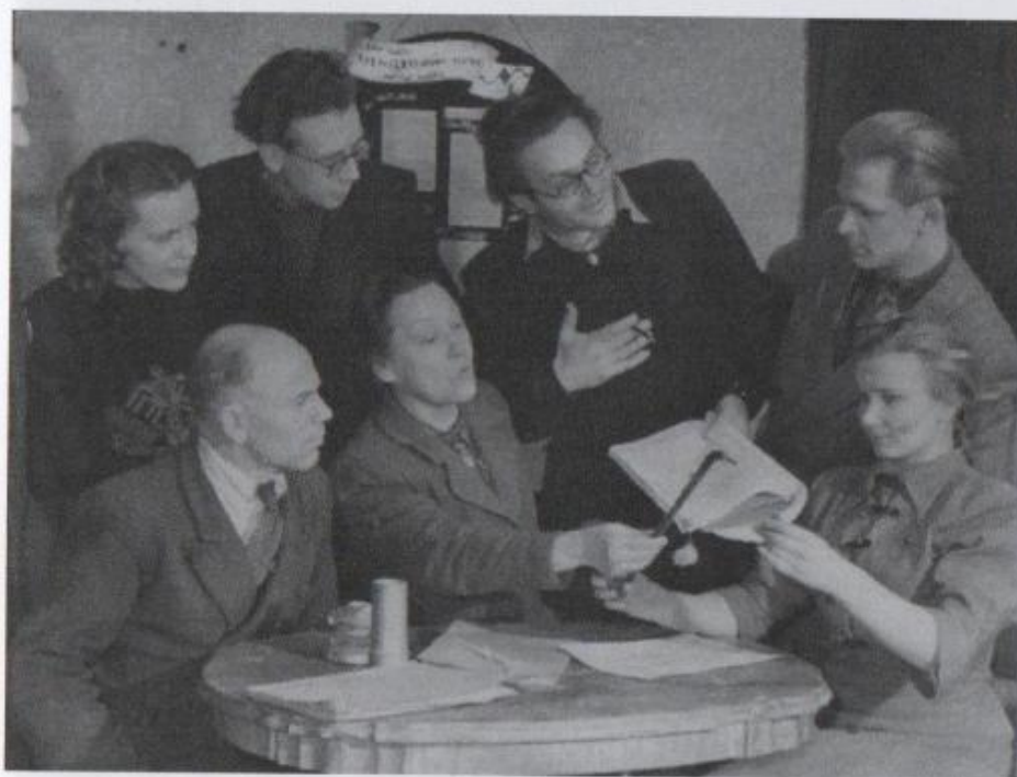
Asja Lācis con gli attori del Teatro di Valmiera, anni Cinquanta.

Quando torna dal Kazakistan diventa regista del teatro di Stato di Valmiera, in Lettonia, e riallaccia i rapporti con i vecchi amici, primo fra tutti Brecht, di cui negli anni Venti era stata preparatissima informatrice della scena teatrale sovietica, nonché assistente, incaricata di provare le scene di massa. Di quest'uomo gentile racconta che «lavorava con incredibile precisione: un'inflessione o un gesto che gli sembravano importanti poteva farli ripetere all'infinito», rimanendo sempre cortese e paziente. È proprio da Brecht che viene a sapere della morte di Benjamin. Le memorie si concludono in modo netto, senza nessun bilancio o formula conclusiva, lasciando spazio ai saggi e a un ricco apparato iconografico.