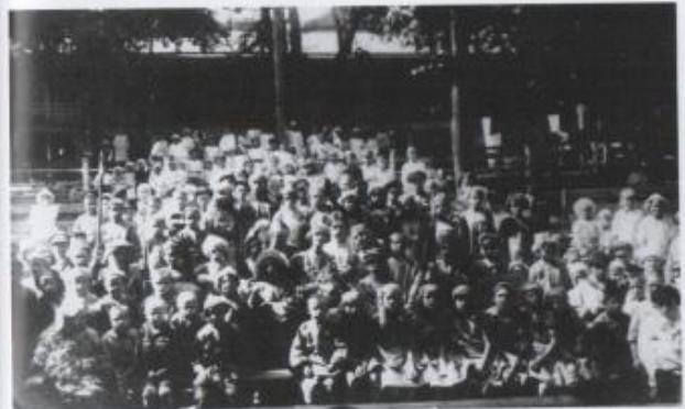
Membri del gruppo di teatro per bambini che con Asja Lācis mettono in scena la fiaba Alina di V. Mejerchol'd, Orel, luglio 1920.