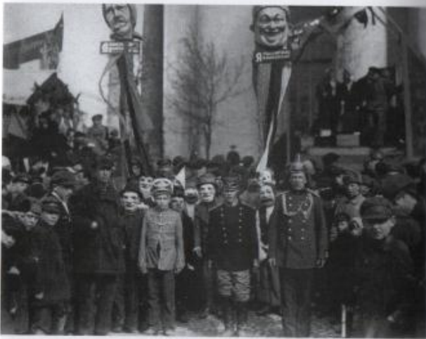
Dimostranti con maschere a Leningrado, 1° maggio 1924. Slogan: a sinistra "Compro dal mercante privato"; a destra "Compro dalla cooperativa". "Krasnaja Gazeta", 2 maggio 1925.

È proprio il teatro dei bambini uno dei primi argomenti di conversazione con Benjamin. I due si conoscono a Capri nel 1924, dove L'cis trascorre la primavera e l'estate con la figlia Daga e il futuro marito Bernhard Reich. È piuttosto noto l'episodio che la vede in difficoltà mentre cerca di comprare delle mandorle di cui non conosce il nome in italiano, quando Benjamin, che da giorni la osservava da lontano, accorre in suo aiuto. Si può leggere qui il bel racconto dei rapporti tra Benjamin e L'cis dal punto di vista del filosofo, che non ha mai nascosto la fascinazione che la regista esercitava su di lui. A volte la scrutava così intensamente che a stento ascoltava ciò che lei diceva, scrive nel Diario moscovita , resoconto del viaggio che Benjamin fece tra il dicembre 1926 e il gennaio 1927 nella Russia 'sovietista', come veniva allora chiamata la Russia sovietica nella pubblicistica italiana.