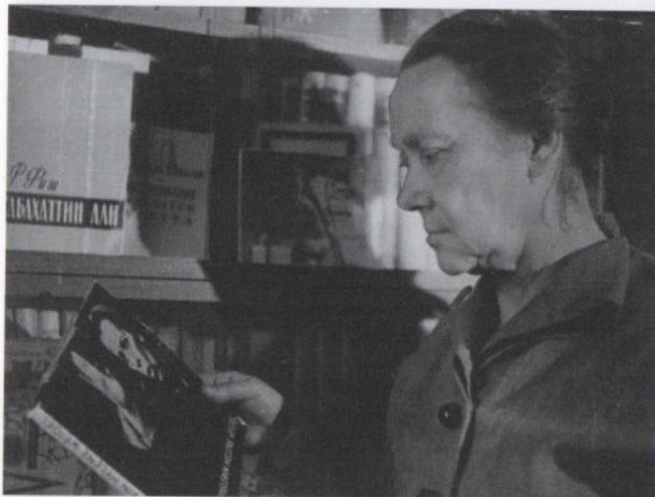
Ritratto di Asja Lācis, anni Cinquanta.