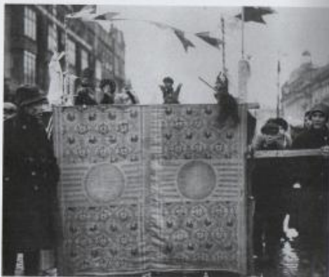
Presentazione del Teatro delle marionette Petrushka in una strada di Mosca, 1° maggio 1929