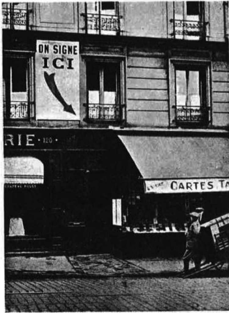
PLATE 17. The Humanité bookstore (SEE PAGE 63)