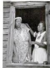
WAITING , the young mother leans forward against the window, spending quietly and looking for Maude's car.