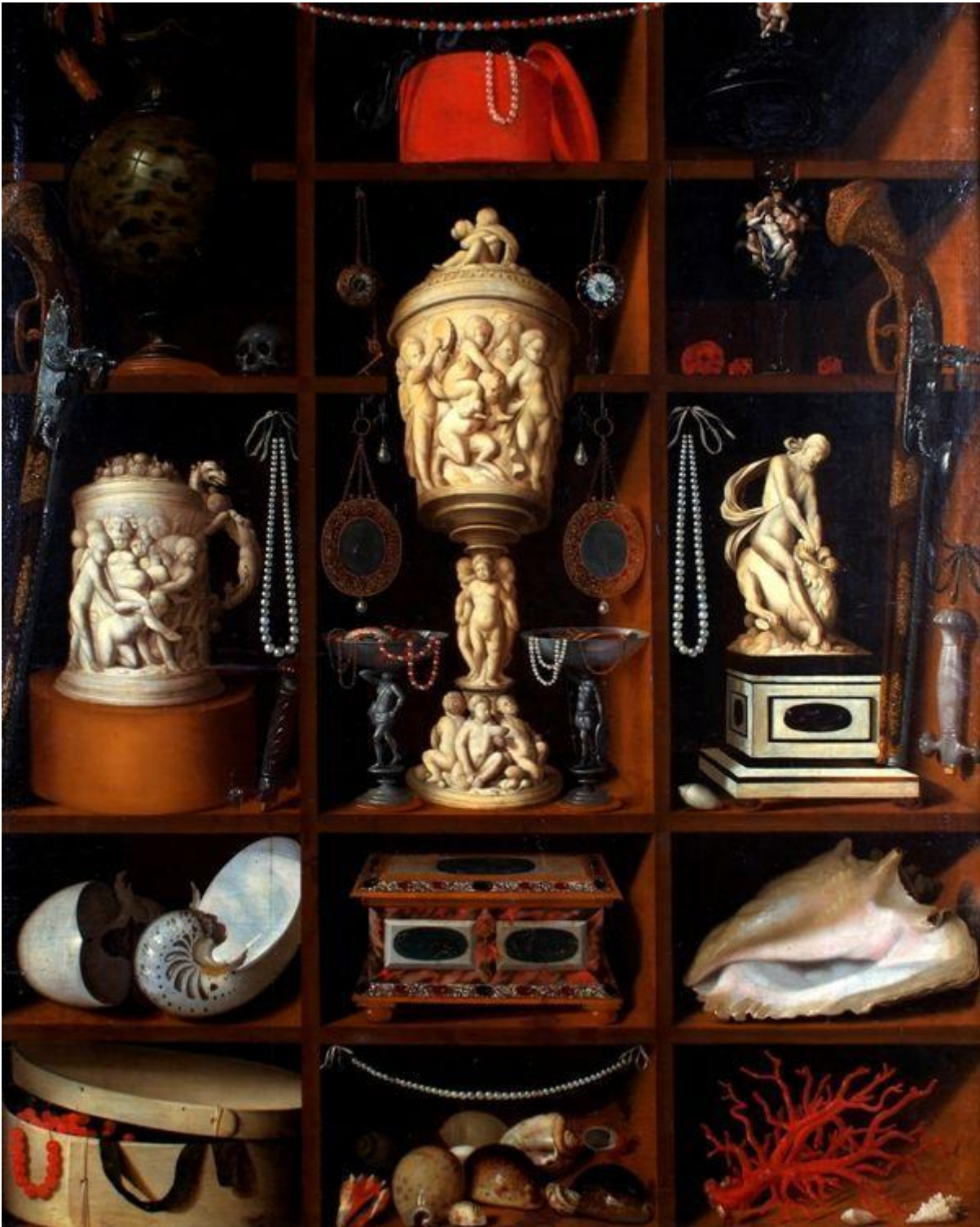
Gabinetto delle curiosità di Georg Hainz.

del secondo Lukács e dei suoi innumerevoli seguaci.