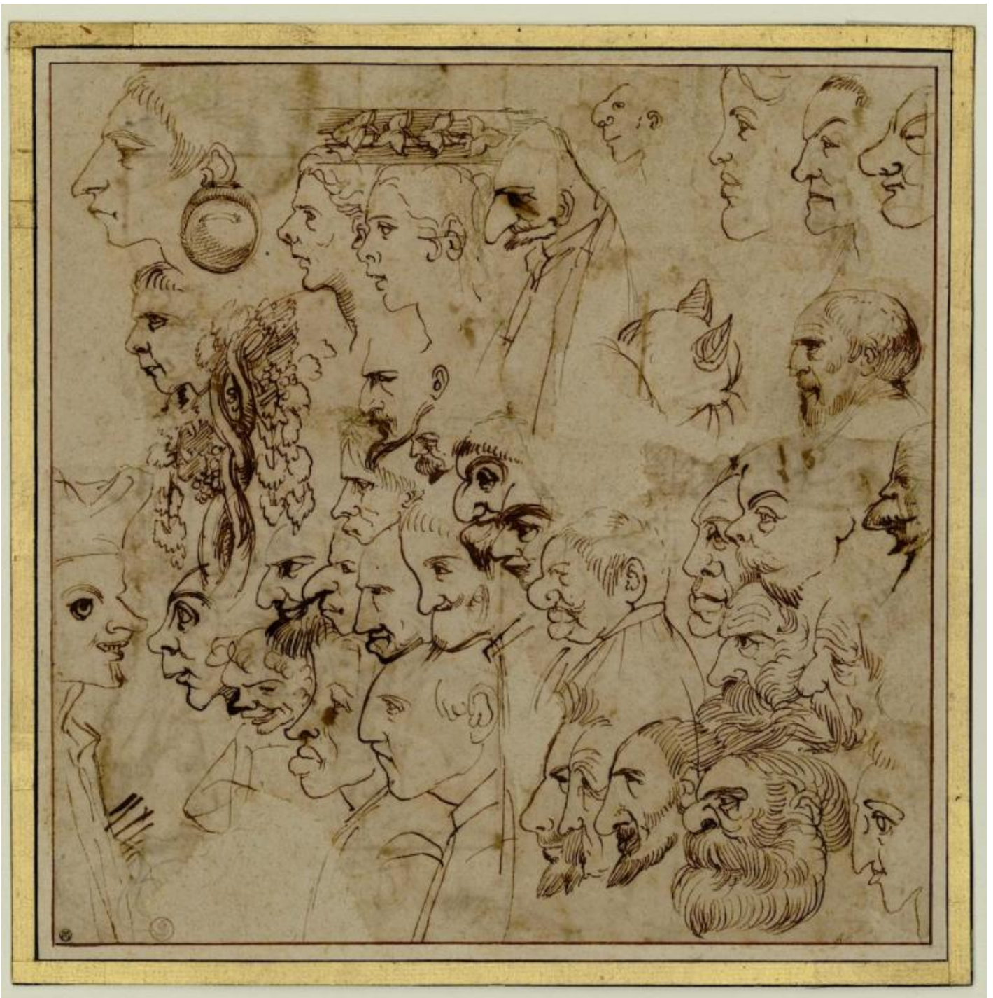
Agostino Carracci (1557-1602). Serie di teste caricate c. 1594 inchiostro su carta Torino, Musei Reali, Biblioteca Reale di Torino, inv. D.C. 16066

Come è da ritornare – sempre con attenzione – alla eterna questione dell’arte dei disegni dei bambini, o, meglio, quella che a un occhio adulto non sembra (e non può essere) arte, proprio perché frutto di mano “acerba”, non allenata al perfezionismo del disegno “accademico”. Eppure: ecco, in mostra, un dipinto eccezionale di Caroto. Ma non per i motivi, di nuovo, di intrinseca qualità pittorica dell’opera.