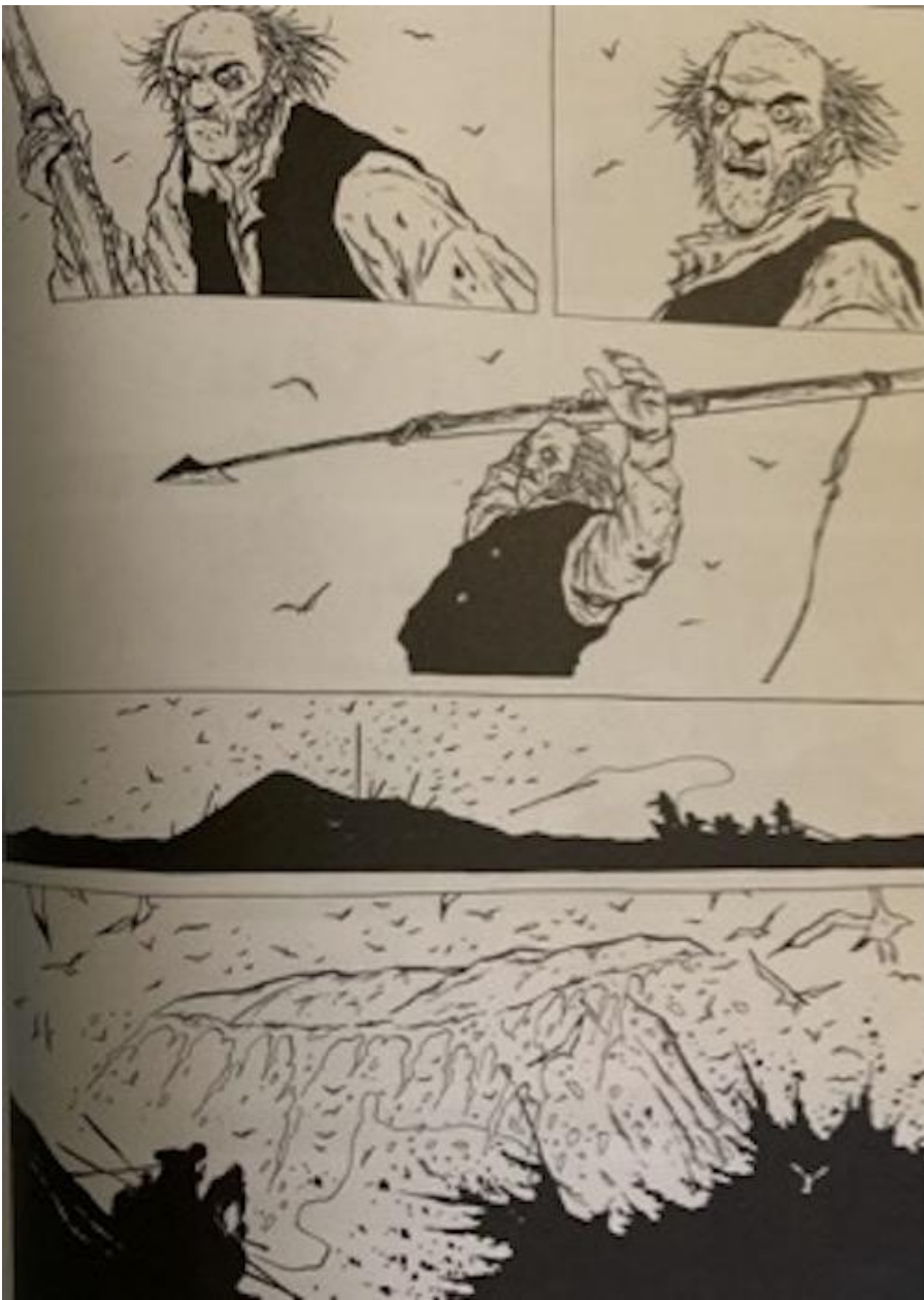
Moby Dick, Christophe Chabouté, 2017.

figura del capitano Achab, che egli considera la quintessenza del borderline.