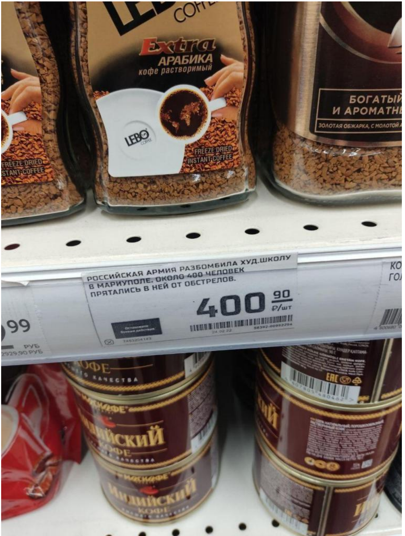
400 – l'esercito russo ha bombardato una scuola d'arti dove si riparavano circa 400 persone.