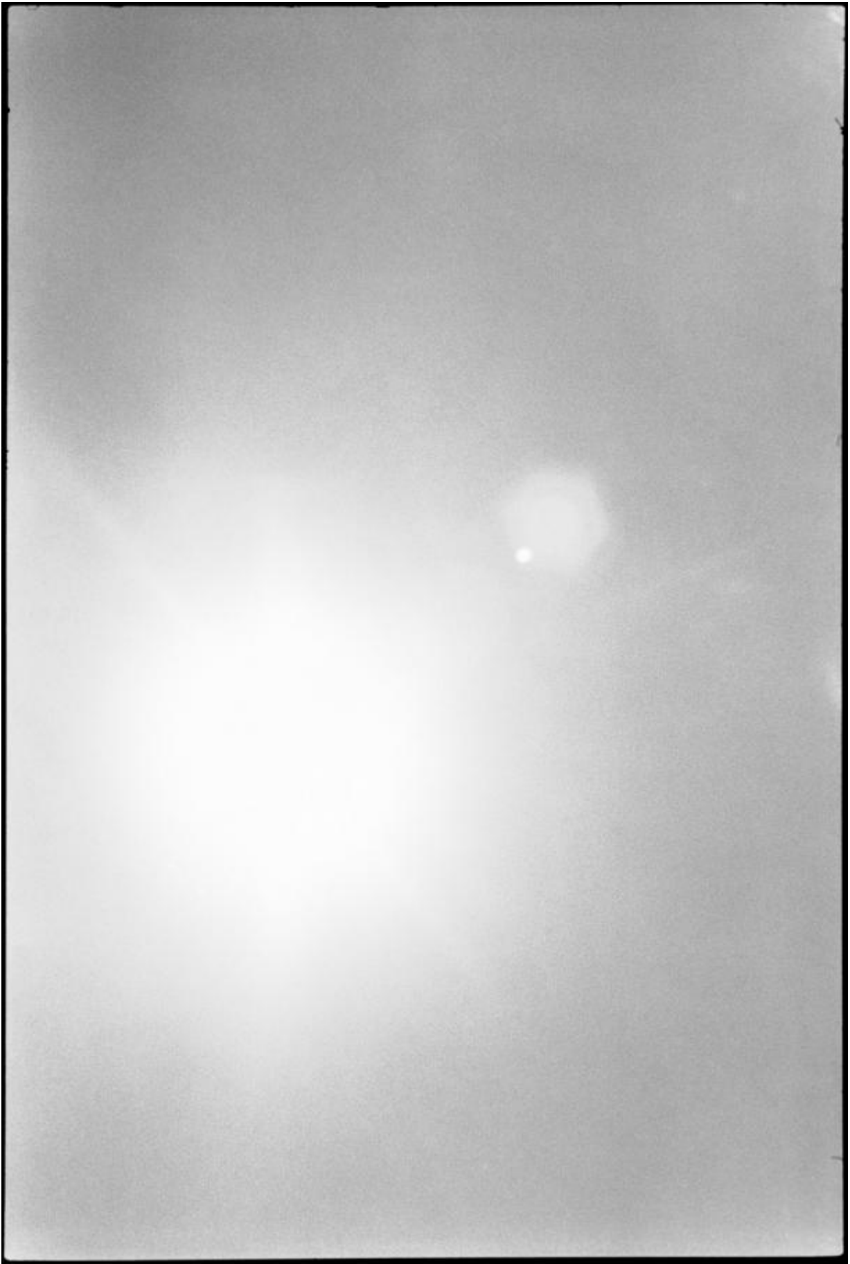
Zoe Leonard, January 23, frame 8, 2011. Gelatin silver print 47 × 70 cm.