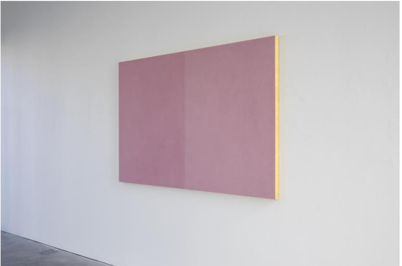
Exhibition view ph. Werner J. Hannappel Courtesy Galleria Lia Rumma, Milano | Napoli e Studio Ettore Spalletti.

I colori non caratterizzano soltanto le tavole colorate sospese alle pareti singolarmente, oppure in coppie o a creare vere e proprie installazioni ambientali, ma connotano altresì le carte, gli alabastrici, i marmi di Spalletti a cui l'artista spesso attribuisce specifiche forme recuperandole dalla storia dell'arte, come l'uovo (probabilmente citazione da Piero della Francesca), il libro, la fontana, il vaso, l'anfora, la colonna. L'artista fa proprie le forme che hanno attraversato tutta la storia dell'arte per rivederle con gli occhi della contemporaneità e dare loro il colore del proprio tempo. Coniuga perciò tradizione e contemporaneità, passato presente e futuro. Anche grazie al profilo delle montagne che spesso appare nelle sue opere su carta, rinvia a un'idea di paesaggio morandiano, fatto di oggetti e forme 'polverose', silenziose, desiderose di attivare un rapporto, seppur a distanza, con lo spettatore.