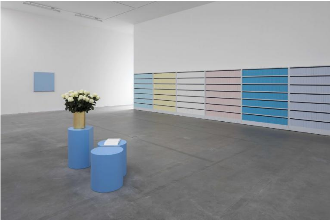
Exhibition view ph. Werner J. Hannappel Courtesy Galleria Lia Rumma, Milano | Napoli e Studio Ettore Spalletti.

Al primo piano della galleria, invece, sono allestite opere realizzate nel 2019 dal titolo Dittico, oro , ciascuna costituita da due tavole di due colori differenti, separati da una linea verticale e racchiusi in una cornice rastremata sui lati ricoperta di foglia d'oro. "Sono dittici, prima erano tavole separate", racconta l'artista: "Ora ho voluto che l'abbraccio dei colori si depositasse su un'unica tavola, divisa da una linea verticale".