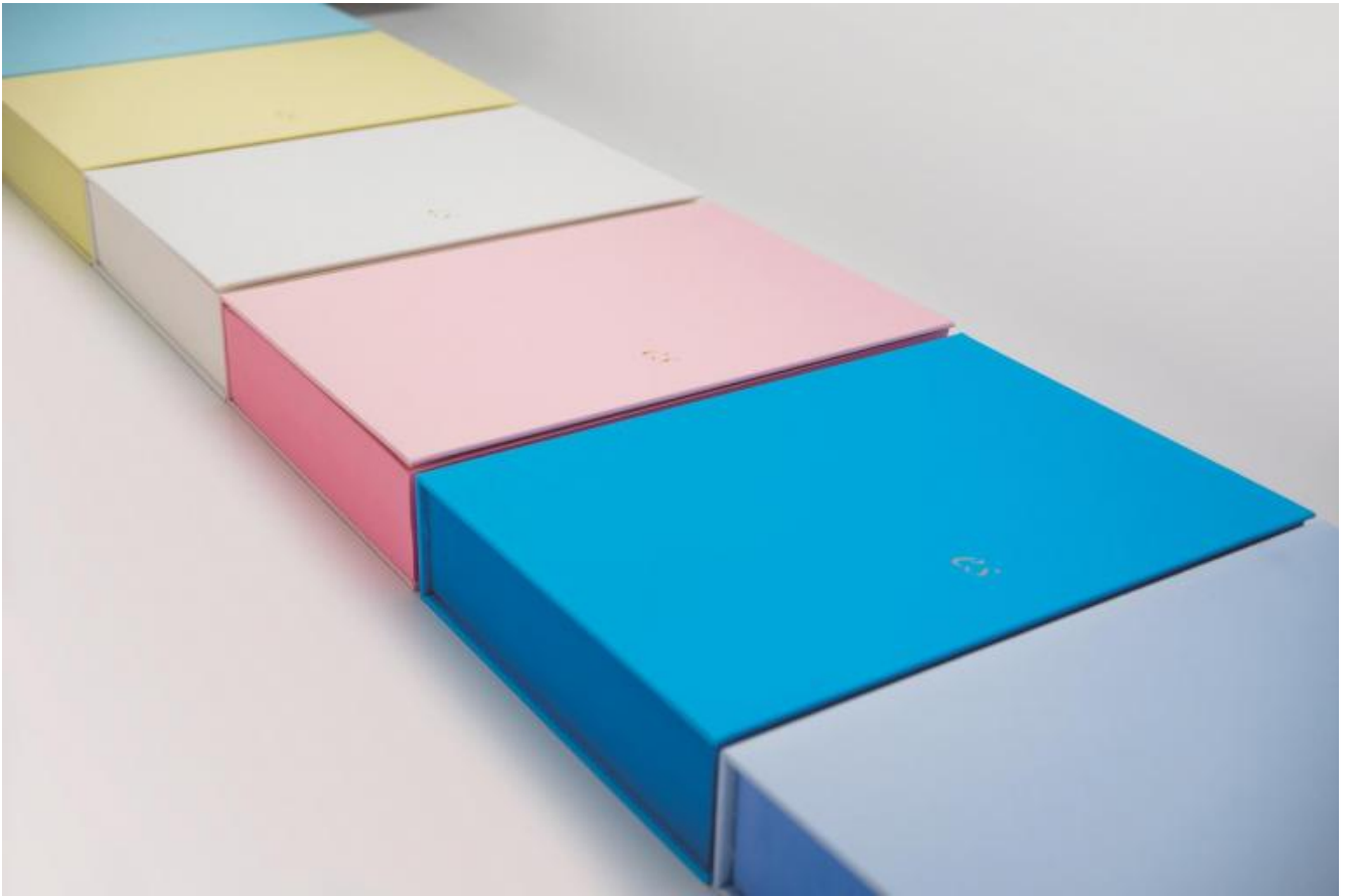
Libreria (particolare) 2018

Nel corso della sua vita, terminata l'11 ottobre 2019, ha tenuto numerose mostre personali in prestigiose istituzioni e ha partecipato alle più importanti rassegne internazionali, tra cui alle edizioni VII e IX di Documenta (1982 e 1992) e alle edizioni XL, XLIV, XLVI e XLVII della Biennale di Venezia (1982, 1993, 1995 e 1996). Quando varchiamo la soglia di una sua mostra personale o anche solo di una sala dove sono esposte sue opere, si ha sempre la sensazione di entrare in un luogo accogliente, che ci abbraccia e ci protegge; solo in seguito il nostro sguardo inizia a focalizzarsi sulle singole opere. Ciò a cui Spalletti dà vita, infatti, non sono tanto 'opere', nel senso tradizionale del termine, quanto spazi di raccoglimento dove non serve parlare, ma viene naturale stare in silenzio, in solitudine, avendo tuttavia la sensazione di avere qualcuno vicino che ci sta prendendo per mano: il Colore. Lo spazio espositivo sembra cristallizzato nel colore delle sue opere. Il colore diventa quasi architettura; un'architettura praticabile poiché pensata per essere vissuta nel nostro muoverci, nel nostro osservarla da prospettive differenti. Per questa ragione il concetto di accoglienza, come soglia tra pubblico e privato, tra bisogno di solitudine contemplativa e