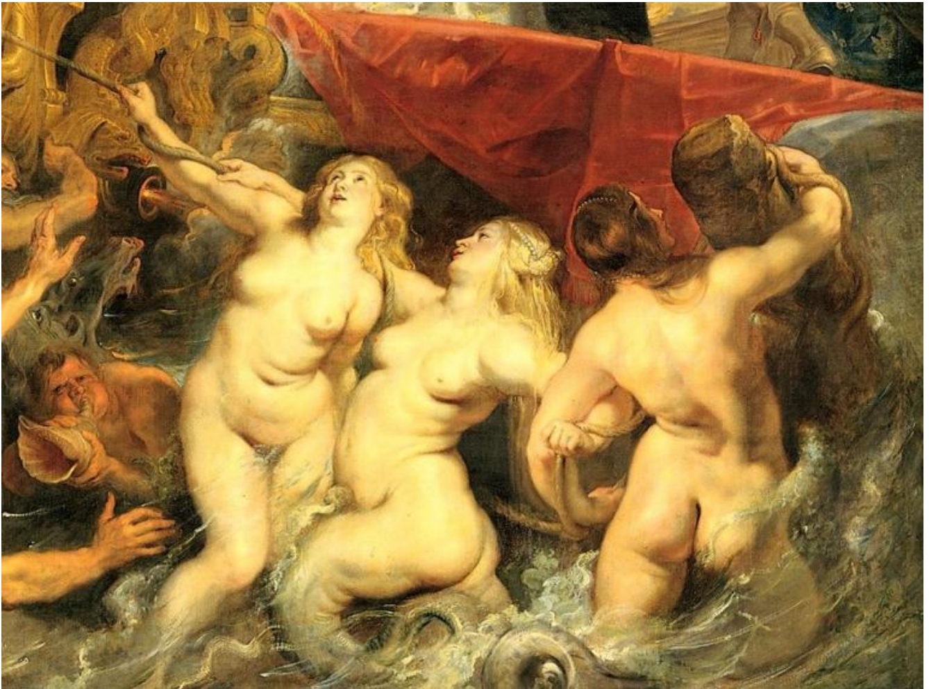
Pieter Paul Rubens, Lo sbarco a Marsiglia di Maria de' Medici, 1622, Parigi, Musée du Louvre, dettaglio.

È insomma il montaggio anacronico tra immagini differenti ma capaci di interagire tra loro che può sprigionare, sulla scorta di Benjamin, una scintilla che unisca il passato al presente.