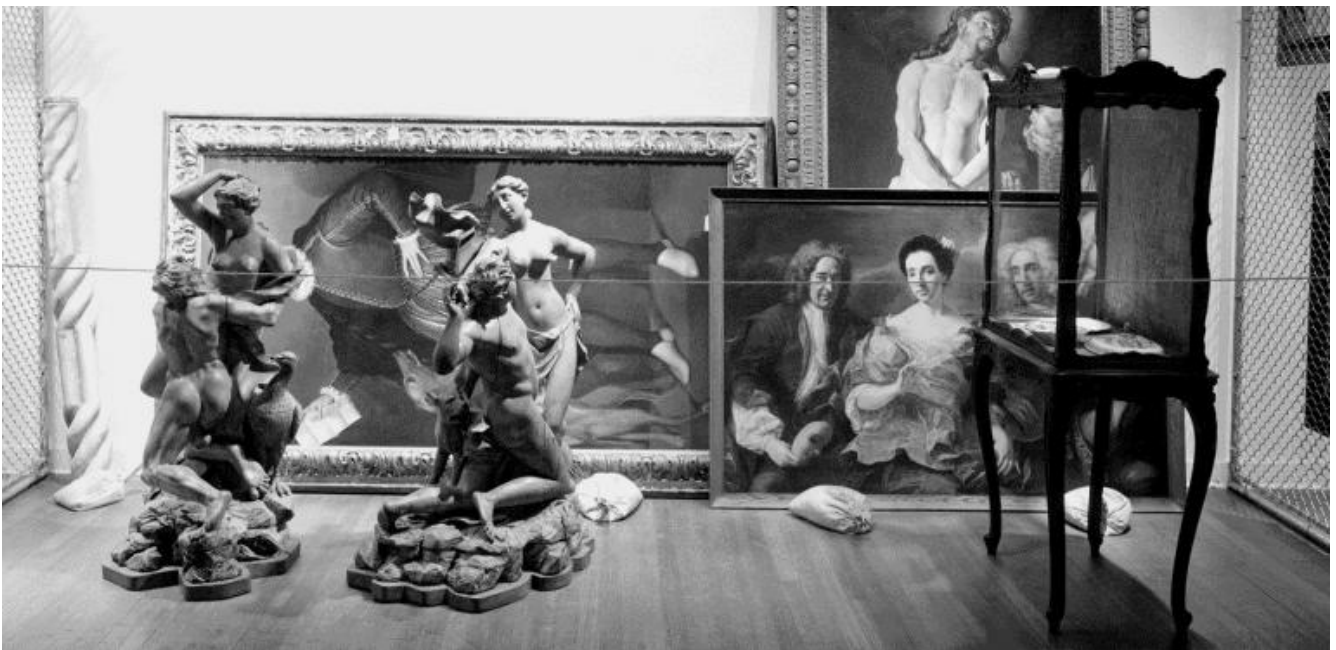
Un dettaglio dell'installazione di Raid the Icebox I with Andy Warhol, Rhode Island School of Design, Museum of Art, 1970.

Lo svaligiamento della riserva del RISD Museum da parte di Warhol è stato, clamorosamente, un'operazione tanto di dubbio rilievo all'epoca (e c'è chi ne ha parlato come di un grande rimosso, per decenni, per l'istituzione stessa) quanto ricca di suggestioni per la pratica curatoriale del futuro. In effetti non si finisce mai di citarla (Wes Anderson, per esempio, come ispirazione per la sua patinata mostra- Wunderkammer alla Fondazione Prada nel 2019-2020) né di riproporla ( Raid the Icebox Now , sempre al RISD Museum nel 2018-2020, cinquant'anni dopo Warhol) né di pensarla come la prima mostra anacronica , ovvero la prima che abbia messo in moto temporalità diverse, sfuggendo deliberatamente ogni classificazione storico-cronologica.