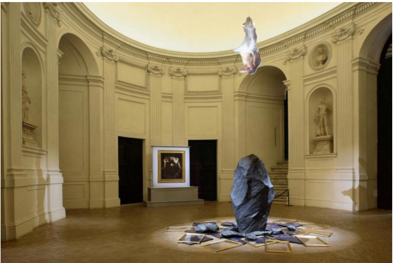
L'installazione di Eco nel vuoto di Giulio Paolini con Narciso alla fonte di Caravaggio, Roma, Palazzo Barberini.

Un doppio fuoco, quello della sala ovale con Paolini e Caravaggio, che a chi si occupa della vita delle immagini non può che evocare la sala ellittica progettata da Aby Warburg per la sua biblioteca, pensata per "riproporre la 'forma simbolica' dell'orbita cosmologica di Keplero" (Claudia Cieri Via, nel suo saggio) e il suo dinamismo continuo e mobile.