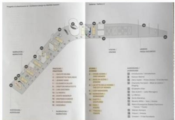
Buone Nuove. Donne in architettura. Alcune vedute della mostra visitabile al MAXXI e schema dell'allestimento.