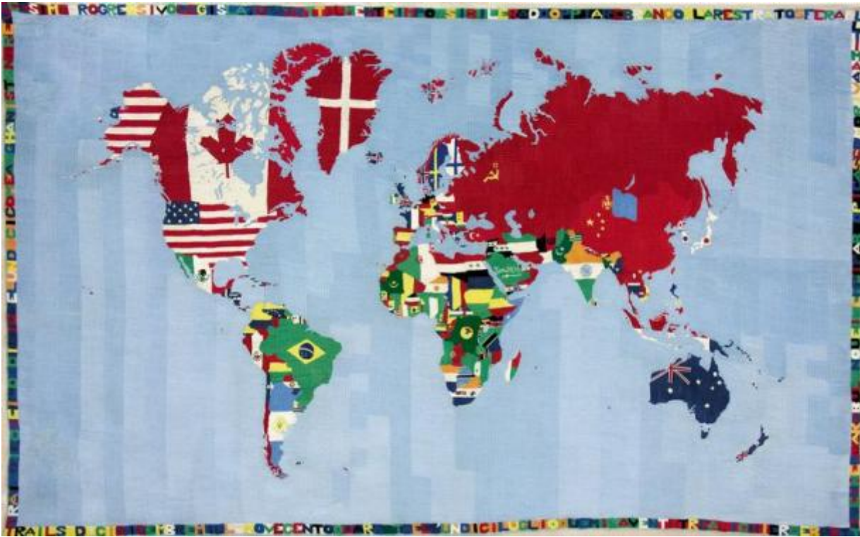
Alighiero Boetti, Mappa , 1971

Entriamo ora più nello specifico e osserviamo il capitolo “Definizione e controllo del territorio”. Qui il tema trattato è la carta geografica intesa come uno spazio astratto sul quale sono incisi i segni del potere politico, con tanto di confini ben indicati. Distaccandoci in parte dal testo di Tedeschi, proviamo a concentrarci sull’intricata situazione territoriale tra Israele e i Territori palestinesi. Una scelta, la nostra, dovuta non a una presa di posizione politica, ma proprio per verificare – attraverso una situazione concreta, e molto dibattuta – come e con quali strumenti diversi artisti siano riusciti, in modo emblematico, a uscire da una logica puramente informativa. Per prima cosa prendiamo in mano una carta dettagliata di Israele, come quella che proprio ora sto guardando. Già di primo acchito si capisce che c’è qualcosa di non pacificato e stabile: la striscia di Gaza pare l’angolo della punizione tanto è schiacciata verso il mare, e il confine con la Siria, là dove s’innalzano le alture del Golan, è segnato con una doppia linea di demarcazione che delimita una vasta terra di nessuno. In compenso le strade si snodano sciolte e libere, come se si potesse allegramente andare da Hebron a Be’Er Sheba e da lì fare un salto a Gaza per incontrare gli amici.