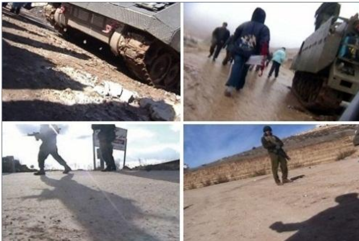
Emily Jacir, Crossing Surda (a record of going to and from work), 2002