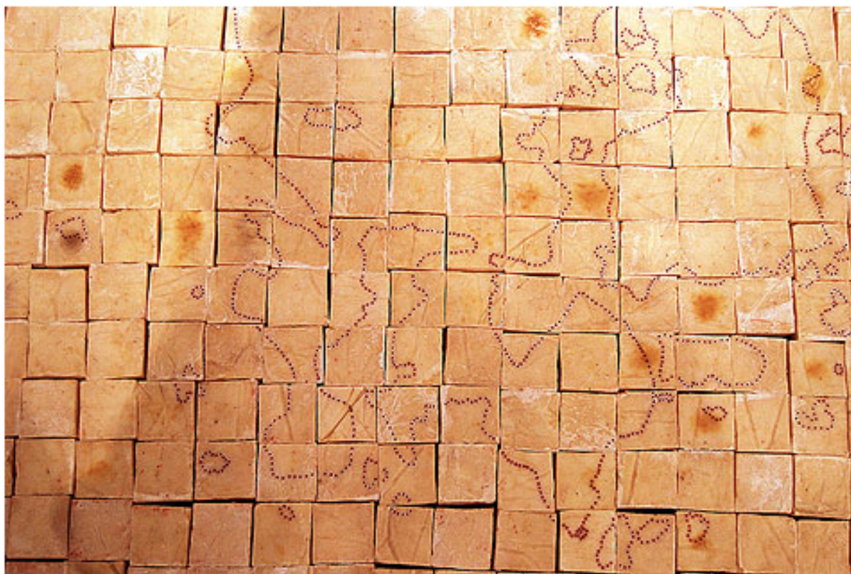
Mona Hatoum, Present Tense, 1996 (dettaglio)

accompagnata da fotografie che documentavano oggetti e prodotti tradizionali creati dai palestinesi). Diviene una sorta di corpo sdruciolevole, forte come un mattone, ma anche fragile e pronto a sciogliersi fino a sparire; contraddittoriamente intriso di saperi oppressi e tenaci come il profumo che emana. Saperi costretti a sopravvivere a stento (come fare a creare tale sapone se ai palestinesi viene sottratta proprio la terra, con i suoi campi di ulivi?), ma al contempo salvati e resi ancora vivi in quest'opera d'arte. Il suo lavoro si rivela dunque una sorta di crocevia metaforico e intenso fra tensioni irrisolvibili che coinvolgono lo spettatore impedendogli una visione pacificata.