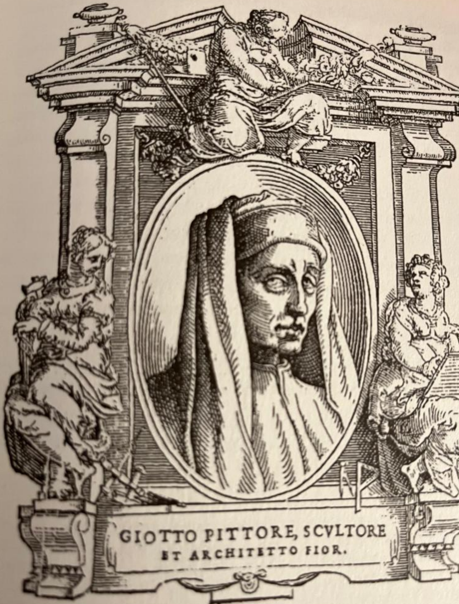
GIOTTO PITTORE, SCULTORE ET ARCHITETTO FIOR.