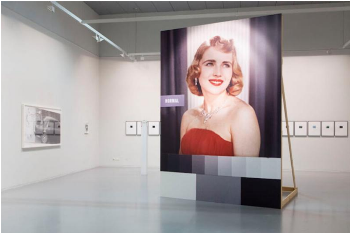
Broomberg and Chanarin, Everything Was Beautiful and Nothing Hurt, Installation View, FoMu, Antwerp (2014).

luce per registrare in modo astratto l'istante di tempo in cui accadeva qualcosa. Scopo del loro progetto era suscitare un dibattito intorno alle immagini di guerra (p. 165).