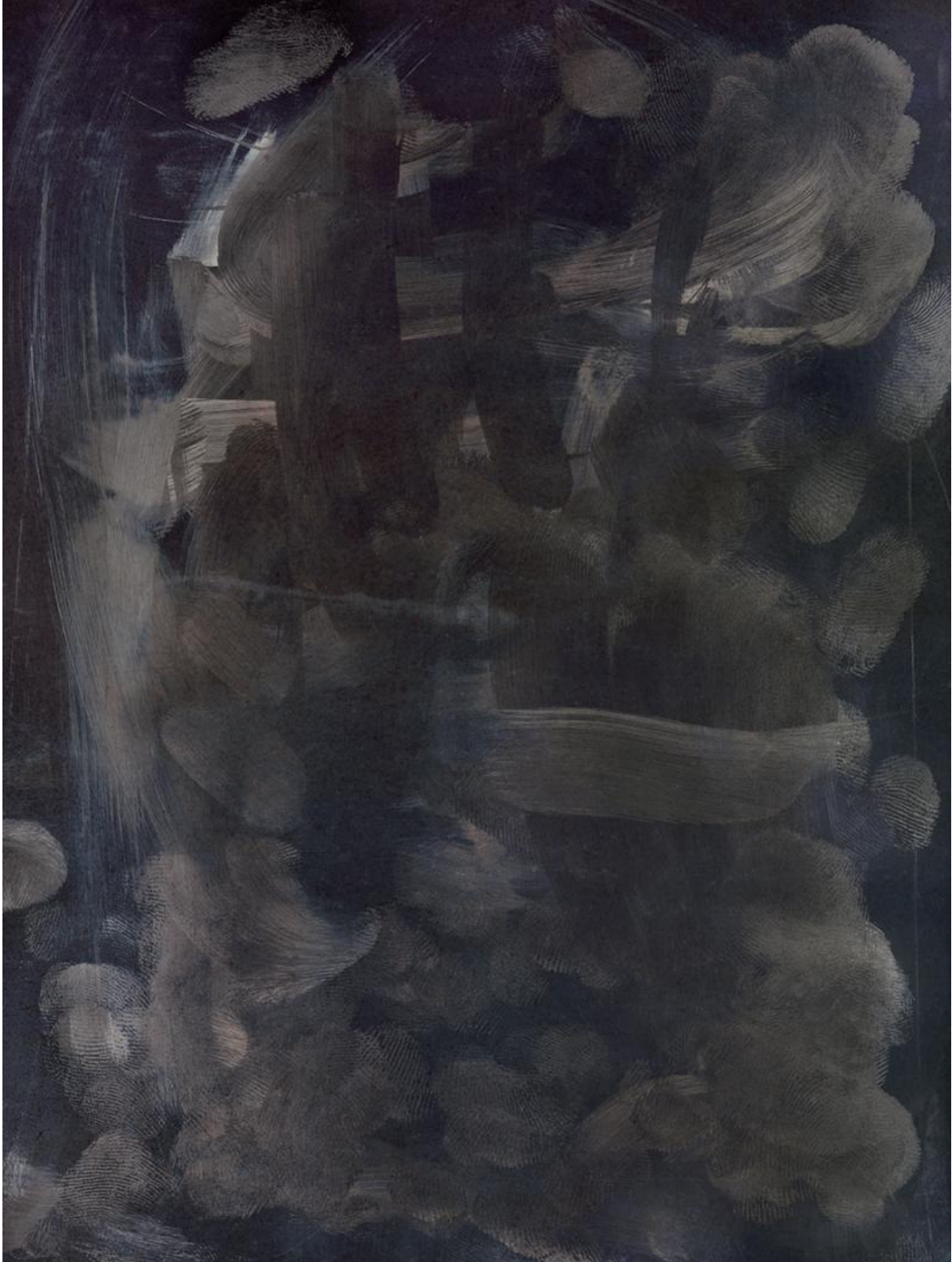
Simone Bergantini, Addiction #1 (2013).

un'immagine è quindi alle dipendenze di fattori che surclassano le precedenti economie visive dell'immagine" (p. 70), che diventa così insidiosa.