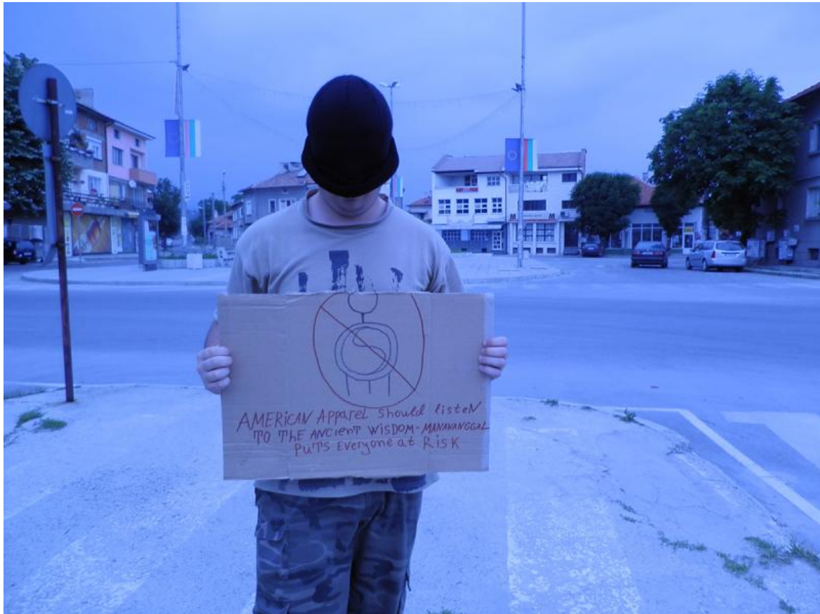
IOCOSE, A Crowded Apocalypse (2012).

Nel libro Le insidie delle immagini (Postmedia, Milano 2022) Sara Benaglia e Mauro Zanchi indagano sullo statuto delle immagini retroilluminate che appaiono sui monitor dei computer e sui display dei dispositivi mobili, ripercorrendo la strada che la fotografia ha fatto dalle sue origini fino ad oggi in compagnia della metafotografia. Se l'introduzione orienta il lettore, il primo capitolo ( Mediare, ancora ) chiarisce il modo in cui si debba intendere il termine metafotografia: "il linguaggio di cui la fotografia si serve per parlare di se stessa e [al contempo] per interagire con altri sistemi" (p.23). Dopo aver specificato le ragioni per cui è stato adottato l'uso del prefisso "meta", il saggio entra nel merito dei processi tecnologici che hanno causato lo "sfondamento del concetto di visione finora conosciuto" (p. 86).