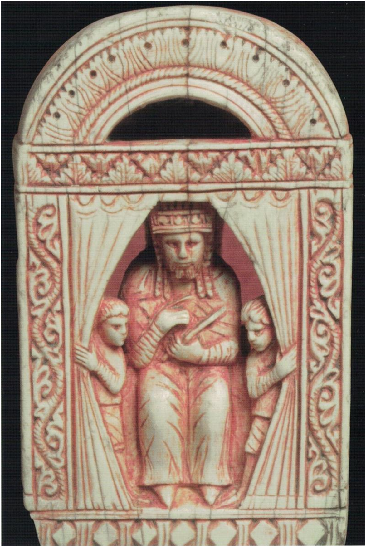
Gli scacchi bianchi e rossi del Medioevo. Pezzo della scacchiera detta "di Carlo Magno", Salerno, fine dell'XI sec., Parigi, Bibliothèque nationale de France, Cabinet des médailles.