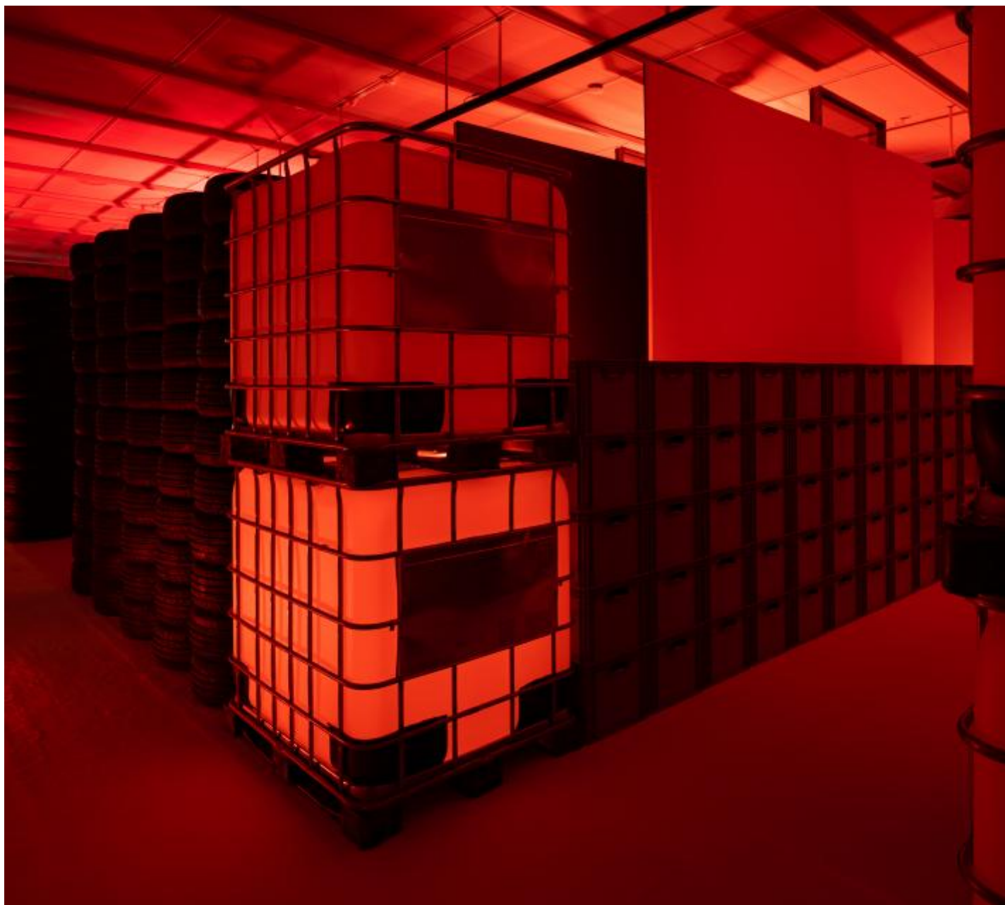
Installation view Anne Imhof - Youth . Stedelijk Museum Amsterdam co-presented with Hartwig Art Foundation.

La mostra, che ha completamente trasfigurato i mille metri di spazio che lo Stedelijik le ha dedicato, ha avuto un iter travagliato. Youth è infatti il frutto di un dialogo tra l'artista, appena reduce dalla 57ma Biennale di Venezia del 2017 in cui aveva rappresentato la Germania ottenendo il Leone d'Oro per il miglior Padiglione, e Rein Wolfs, allora direttore della Bundeskunsthalle di Bonn.