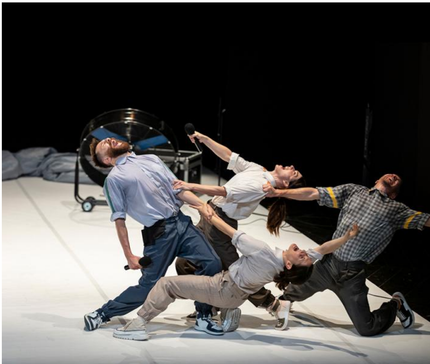
Il miglior spettacolo: L'angelo della storia, di Sotterraneo.

Però non serve scomodare la filosofia francese del secondo Novecento per ragionare su quanto una rappresentazione di qualcosa, per quanto possa aderire all'oggetto di partenza, non sarà mai una copia fedele della realtà ritratta. Perché parla non soltanto del mondo che prova a restituire – in questo caso, un ambiente teatrale quanto mai sfaccettato e molteplice –, ma anche, per forza di cose, di chi ha costruito quell'immagine: dei fotografi, il cui incrocio di prospettive dà vita ogni anno ai Premi Ubu. La selezione di vincitori e finalisti, insomma, dà conto inoltre dello stato dell'arte nel campo della critica: degli interessi di ciascuno, dei giudizi, delle preferenze che si fanno collettive, certo; ma inoltre, più sottilmente, dell'idea di cultura, arte, teatro diffusa, appunto dell'immagine della scena su cui si basano i votanti; forse anche dell'indirizzo che con le loro azioni – dentro e fuori di Ubu – desidererebbero imprimere al nostro teatro.