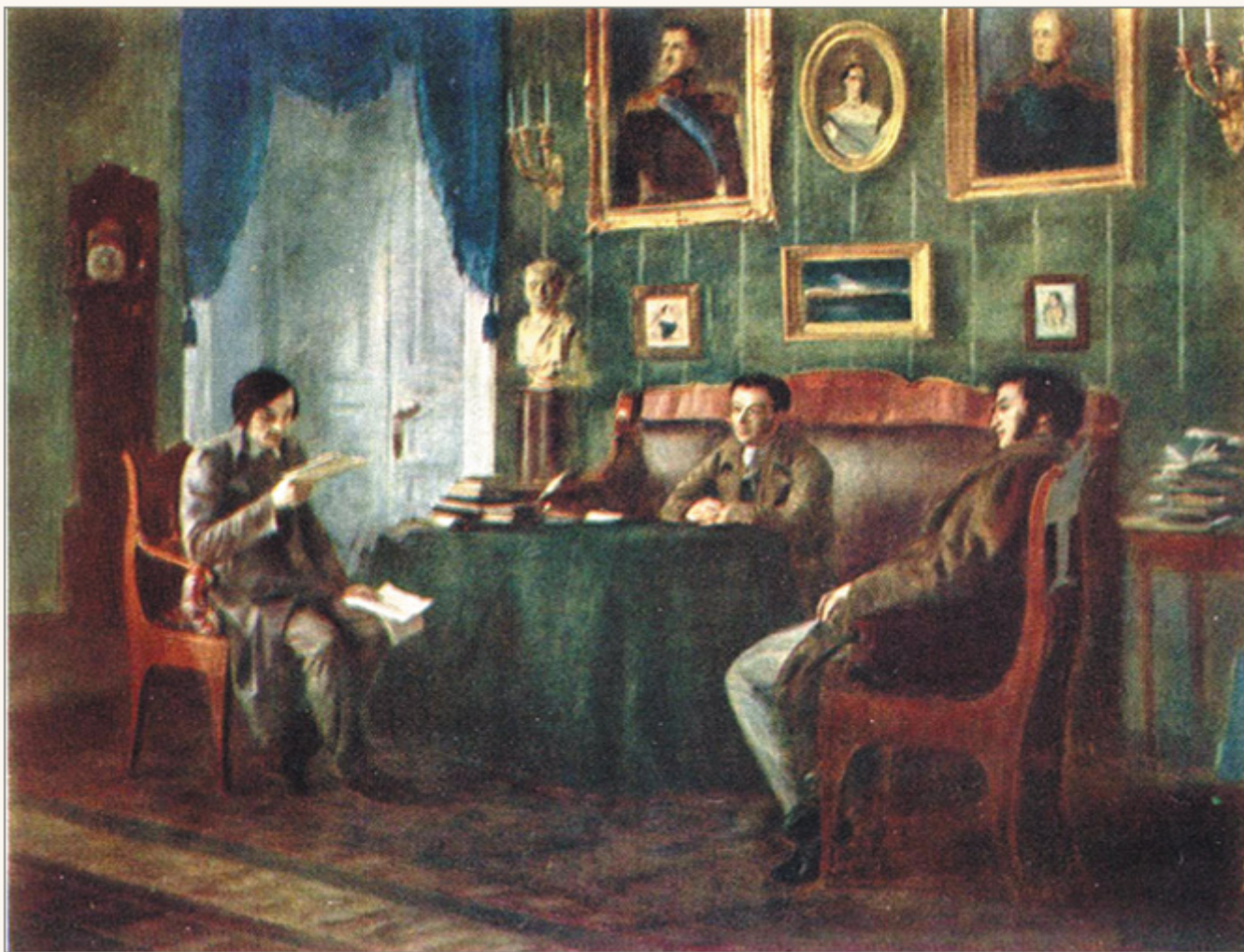
Gogol', Puskin e Zukovskij a Carskoe Selo nel 1831 (dipinto di P. Geller, 1880).

Relativamente alla morte, è interessante la testimonianza del medico A. T. Tarasenkov che tenta di curare Gogol' negli ultimi giorni di vita. Riferendo dello stato mentale e fisico del paziente, il dottore trasmette anche la sua incredulità di fronte a una malattia incomprensibile. «Alla fine della prima settimana di digiuno non c'era traccia di febbre né di alcuna particolare patologia, a parte il progressivo esaurimento delle forze. Solo tre giorni prima della morte il paziente si allettò e anche allora non si osservavano affezioni distinte a nessun organo» (p. 424). D'altra parte Gogol' si è ostinatamente convinto a voler morire. Oltre a digiunare, non collabora con i medici che sono accorsi a curarlo: preferisce la morte a un clistere, e anche una supposta purgativa è in grado di «procurargli strilli e lamenti terribili» (p. 434).