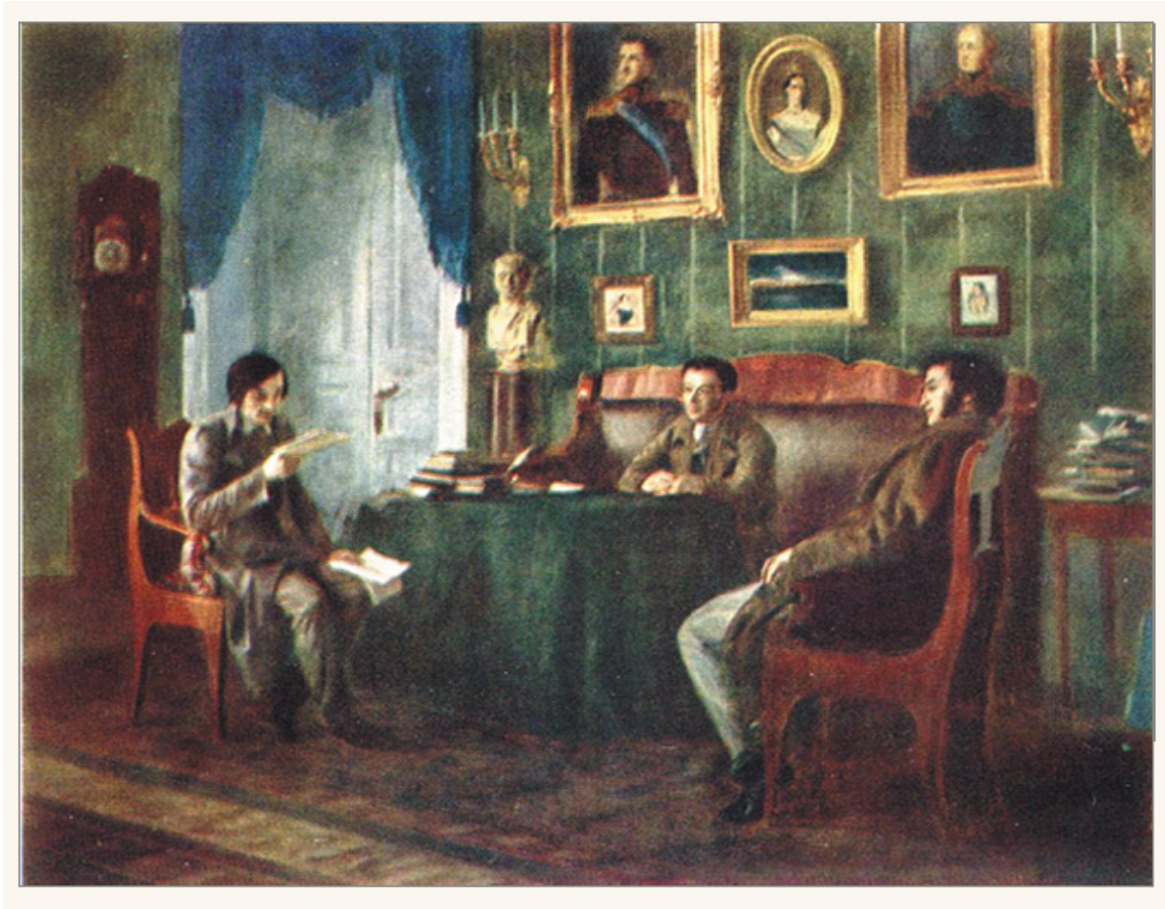
Gogol', Puskin e Zukovskij a Carskoe Selo nel 1831 (dipinto di P. Geller, 1880).

reazionarie di Gogol' che scandalizzano persino i suoi amici. Viaggia molto e sogna di andare in Palestina, progetto che riesce a realizzare senza però ottenerne la pacificazione spirituale sperata. Alla fine del 1848 si stabilisce in casa del conte A. P. Tolstoj, a Mosca, dove morirà quattro anni dopo.