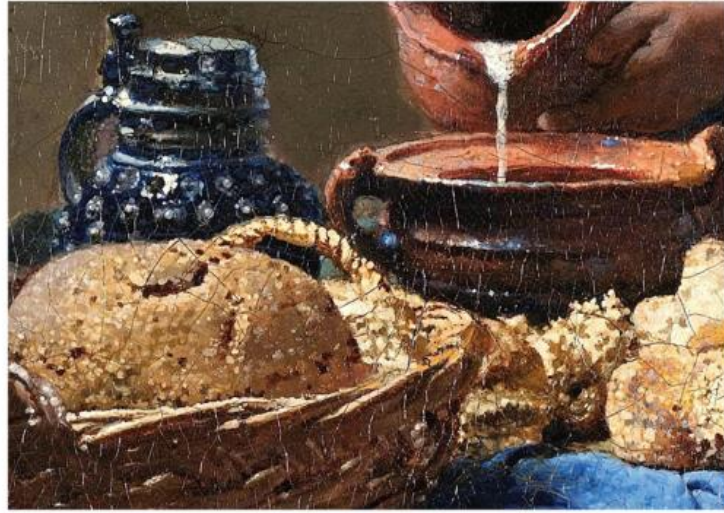
Johannes Vermeer, La lattaia, e dettaglio, olio su tela, c. 1658-1659, Rijksmuseum, Amsterdam.

La lattaia (1658-1659), che “nel silenzio dipinto” ha ispirato Wisława Szymborska , ne è un bellissimo esempio. È impressionante vedere come i chiodi e i buchi sul muro chiaro dietro alla donna intenta nel suo lavoro siano dipinti perfettamente a fuoco, mentre, in primo piano, abbiamo delle forme di pane (vedi dettaglio sopra a destra) che “si dissolvono in puntini”.