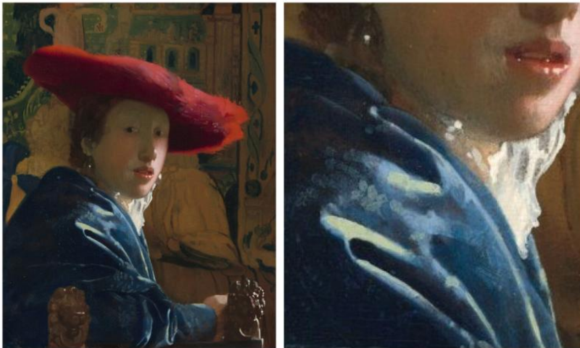
Johannes Vermeer, Ragazza con il cappello rosso, e dettaglio, olio su tavola, c. 1664-1667, National Gallery of Art, Washington DC.

Tre puntini bianchi sulle labbra rosse, ecco la resa della luce di Vermeer. Incomparabile sfinge.