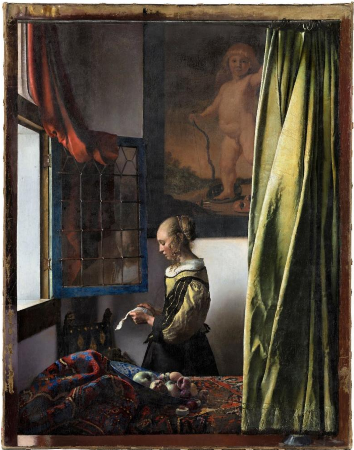
Johannes Vermeer, Ragazza che legge una lettera davanti alla finestra , olio su tela, c. 1657-1658, Dresda, Gemäldegalerie Alte Meister.

Uno dei primi esempi di questa maestria è Ragazza che legge una lettera alla finestra (1657-1658). Ci pare di toccare la tenda con mano. Un angolo di un interno si apre improvvisamente davanti a noi, che assistiamo a un evento intimo, la lettura di una lettera d'amore, come ci dice il Cupido da poco riportato alla luce dopo secoli - altri lo avevano sovradipinto. Il tempo è sospeso. Arco nella mano, Cupido ci guarda, sotto il suo piede due maschere, che erano ritenute segni di