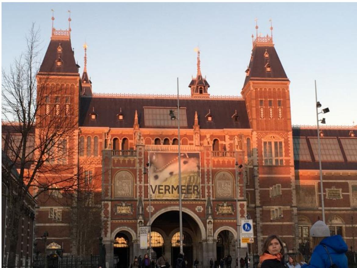
La facciata del Rijksmuseum, su Museumplein (foto dell'autore, 7 febbraio 2023).

Le giornate sembrano già più lunghe al nord. Sono quasi le sei e il sole accarezza ancora la facciata del Rijksmuseum di Amsterdam, che si tinge di un rosa intenso e annuncia: VERMEER. Solo Vermeer. Ventotto opere del pittore di Delft sono riunite qui per la prima volta. Dieci sale a lui dedicate, non c'è che lui. Nessuna altra opera accompagna il visitatore. Solo il Rijksmuseum, custode dei massimi capolavori del Secolo d'Oro olandese, poteva permettersi una scelta così radicale, quasi a dirci: inutile affiancargli altri quadri, nessuno gli somiglia.