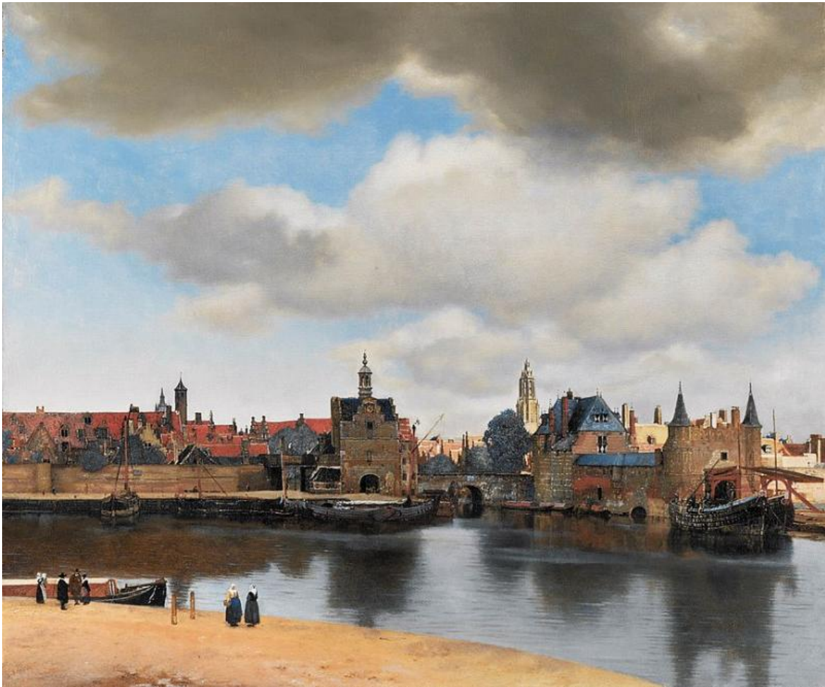
Johannes Vermeer, Veduta di Delft, olio su tela. 1660-1661, L'Aia, Mauritshuis.

È proprio la magica Veduta di Delft tanto amata da Proust che ci accoglie all'ingresso della mostra, accanto a La stradina , la fiabesca visione con la donna che cuce. Per quanto ne sappiamo, Vermeer dipinse solo tre quadri della città, e del mondo esterno in generale, i due giunti a noi sono qui esposti fianco a fianco. Nessuna enfasi sui monumenti più importanti, il maestro ci consegna Delft con occhio innovatore. Non c'è un ampio panorama visto da grandi distanze, come nei suoi contemporanei e predecessori, con chiese che spiccano in lontananza - no. Il suo 'ritratto' alla città è da sud-est, un angolo che non mostra le devastazioni della catastrofica esplosione della polveriera del 1654 - che vide Carel Fabritius tra le vittime. La datazione è prudente (1660-1661), ma gli studiosi azzardano delle ipotesi: il campanile della Nieuwe Kerk non sfoggia le sue campane, che furono in effetti rimosse nella primavera del 1660. Ecco, quel vuoto è l'indizio prezioso, una data: poco dopo quell'evento.