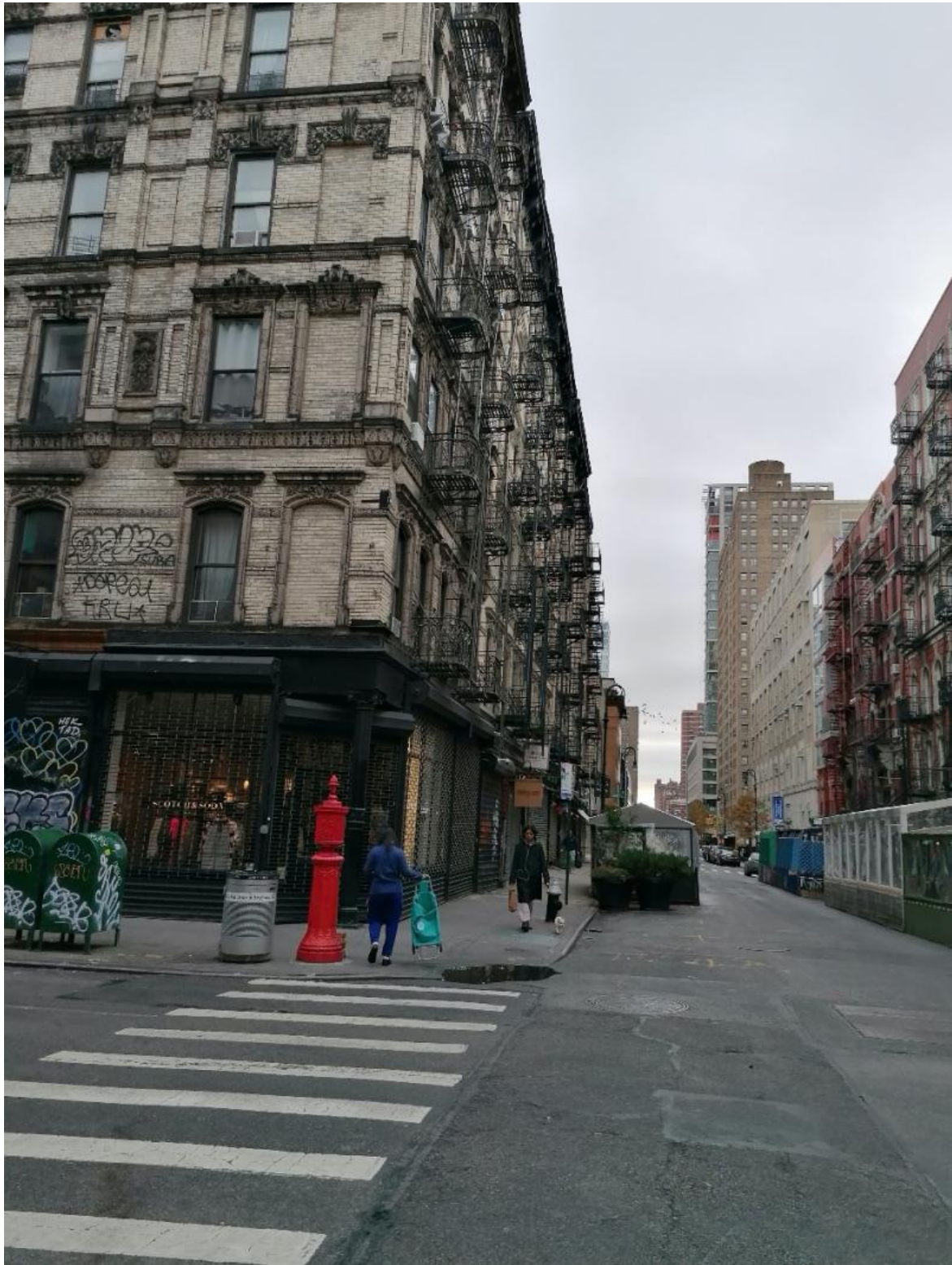
Manhattan, Lower East Side, fine novembre 2022.

Nulla di paragonabile qua in valle: tutti gli indici di produzione manifatturiera e di offerta di servizi hanno ormai dall'anno scorso recuperato e poi superato i livelli di pre-pandemia. I turisti sono tornati fra le montagne come nelle piazze della Città Alta bergamasca. L'aeroporto di Orio al Serio sforna record di arrivi e partenze ogni mese che passa, i ristoranti si riempiono nei weekend, i cantieri edili si moltiplicano, i furgoni delle consegne a domicilio e i camioncini dei pendolari