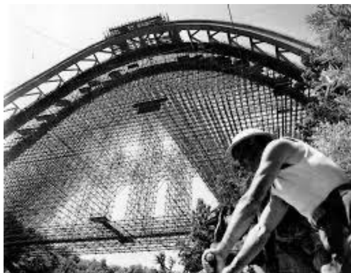
Domus: viadotto dell'Autostrada del Sole in costruzione

La nozione storiografica di Dopoguerra può servire come cornice degli studi, ancora da svolgere, su quanto accaduto tre anni fa, anche solo a fare attenzione a un dato: il numero complessivo dei caduti bergamaschi militari e civili nei cinque anni della Seconda Guerra Mondiale è di poco superiore a novemila, mentre nel solo 2020 si contano quasi seimila e duecento vittime di Covid nella bergamasca. Gli storici che hanno indagato sul secondo dopoguerra del XX secolo, tuttavia, si sono serviti di una gamma amplissima di strumenti disciplinari, socioeconomici, politico-giuridici, demografici, antropologici, culturali... Qua il rischio è che la vicenda giudiziaria comprometta ogni altro genere di approccio e complichino quindi le prospettive degli studi a venire.