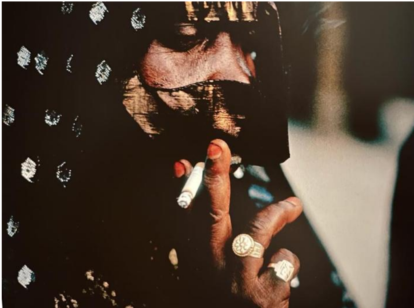
Celebrazioni di nozze, Emirati Arabi Uniti, Dubai, 1971.

Per questo Eve Arnold parte alla volta del Medio Oriente nel 1969 per capire la libertà celata dietro l'uso del velo imposto alle donne: il colore è la scelta che riesce a svelare l'usanza, ed è il modo per vedere il bianco e il nero senza poterli confondere con altre tonalità. Così si può capire davvero lo sporco scuro sotto le unghie smaltate di rosso mentre impugnano una sigaretta, in Afghanistan, come pure i contrasti variopinti che circondano i nuovi soggetti della fotografa, in Turchia, in Cina, in Mongolia. L'America in cui rientra Eve Arnold, negli anni Ottanta, è il Ku Klux Klan, è l'Università, sono gli spogliarellisti e nuove lotte. Il resto del mondo è l'unico contraltare dell'America, che, per contro, diventa l'unica terra del ritorno: Hollywood, il Vietnam, Malcolm X, sono ora diventati il tempo di cui si ha memoria.