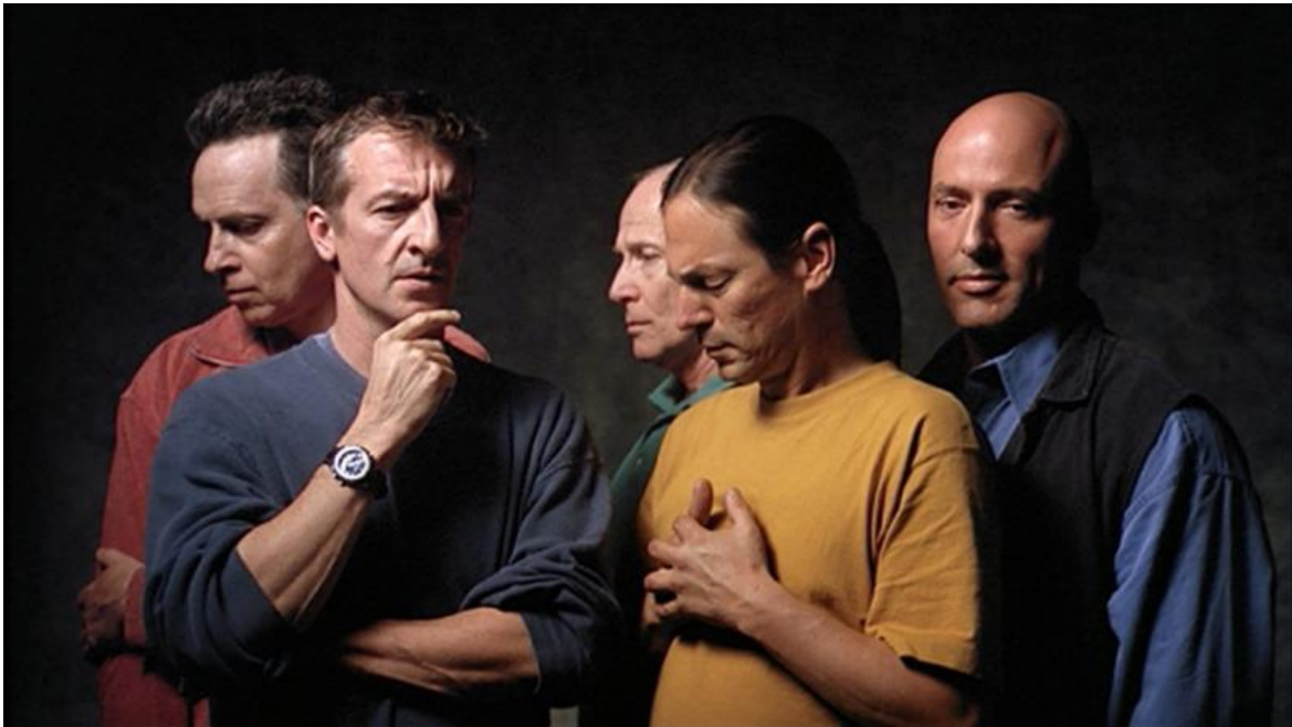
The Quintet of the Silent, 2000.

Se la musica, come scrive Jankélévitch, «è sempre una stilizzazione del tempo», il super slow-motion di Bill Viola applicato all'espressione delle emozioni stilizza il tempo dilatandolo: come una lente d'ingrandimento temporale ci fa entrare nelle pieghe della durata, le spiana in modo che lo sguardo possa toccare tutte le deformazioni dei volti, le più piccole increspature del pathos.