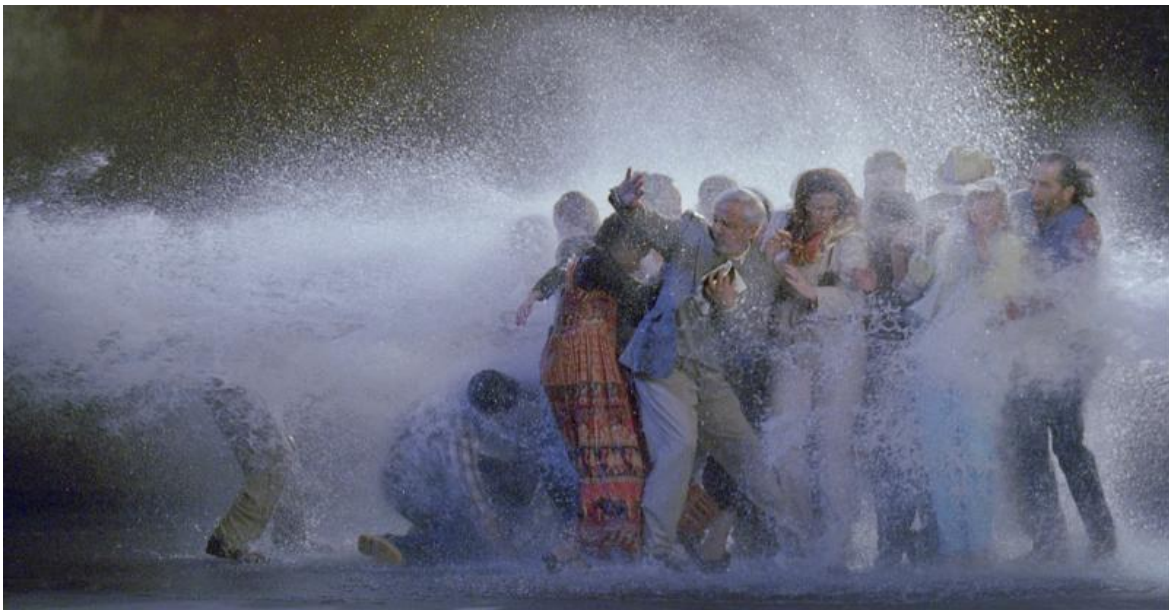
The Raft, 2004.

È ancora l'acqua l'elemento drammaturgico - e «traumatologico», suggerisce Fabbri - di un'altra opera famosa di Viola nella quale siamo portati a proiettare un forte messaggio politico: The Raft (2004).